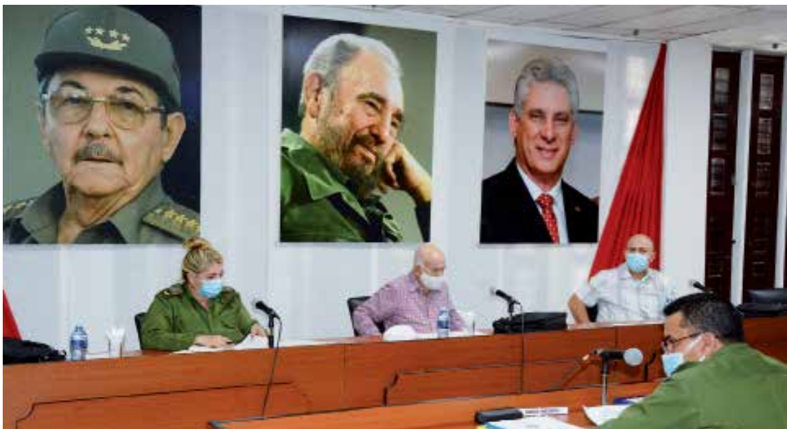
Morales Ojeda destacó la importancia de dar seguimiento desde el Partido a temas vitales para el país como la economía y el trabajo político ideológico.