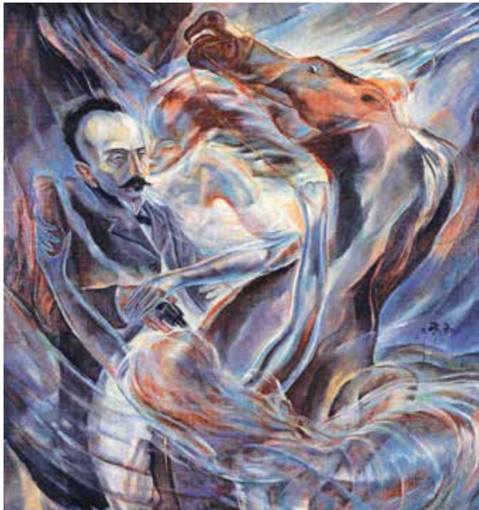
La caída del Apóstol desde la mirada del pintor Carlos Enríquez.

Luego las autoridades norteamericanas en la isla lo prepararon todo jurídica y orgánicamente para el triunfo de su pupilo Estrada Palma, quien asume el gobierno de la república mediatizada el 20 de mayo de 1902. Este señor, quien un día fuera ponderado por Martí como “el cenobita de Central Valley” y llegó a ser uno de sus más cercanos discípulos, pide en 1906 una nueva intervención norteamericana en Cuba para solucionar un conflicto político interno con la oposición liberal, sin