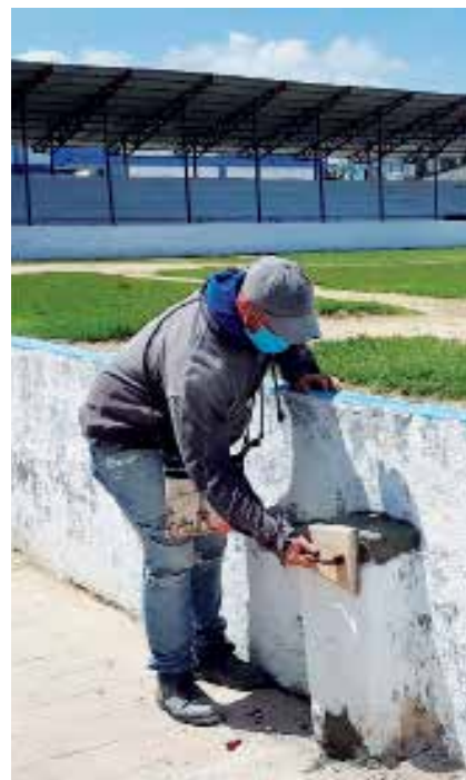
Para el 4 de junio deberá quedar lista la reparación del estadio.

Queda aún, por desgracia, mucho tiempo para que los estadios vuelvan a recibir a sus anfitriones por excelencia. Pero cuando la pandemia pase, los de aquí podrán disfrutar esta entrega. Ojalá este nuevo traje reviva los ánimos que hace más de 40 años hicieron explotar esa “ollita” del Yayabo.