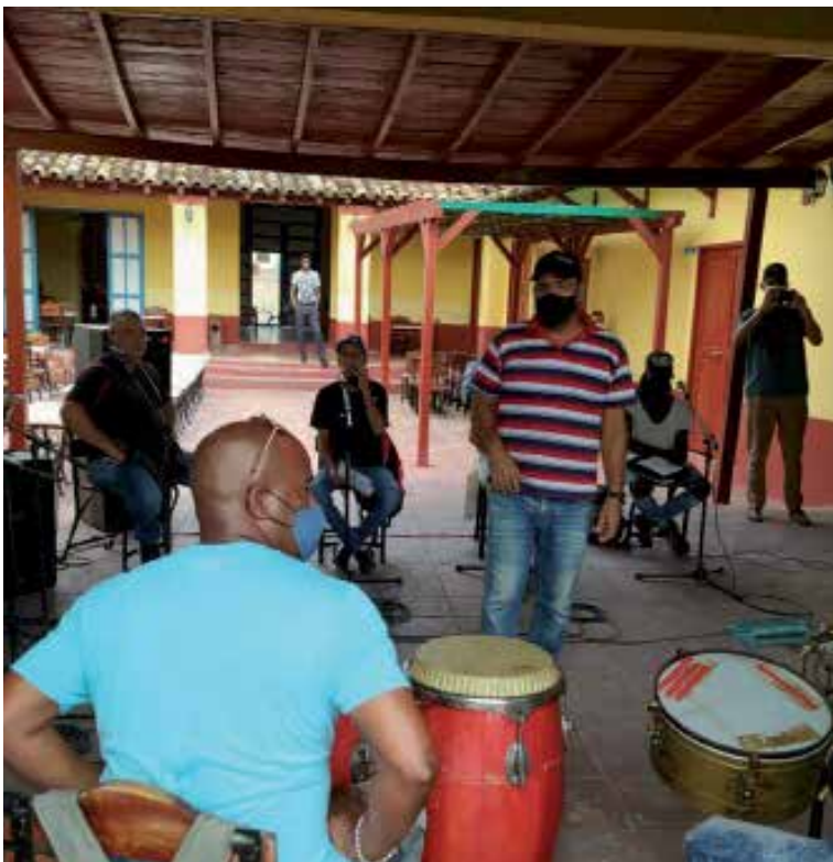
Luego de un dilatado proceso, el equipo logró reunirse en la Casa de las Promociones Musicales de Sancti Spiritus.