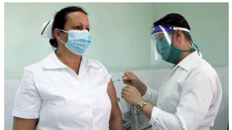
La vacunación abarcará a cerca de 22 000 trabajadores de la Salud y más de 3 000 estudiantes de Ciencias Médicas.

La intervención en población de riesgo —como se nombra científicamente—, supone la administración de tres dosis del candidato vacunal Abdala: la primera el día cero, la segunda a los 14 días y la tercera a los 28 días.