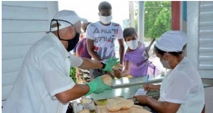
Todos los núcleos espirituaños reciben el pan que se distribuye a diario por la canasta básica familiar.

El pan que se envía a algunos organismos es de 50 gramos, mientras el de la población se comercializa con el gramaje habitual.