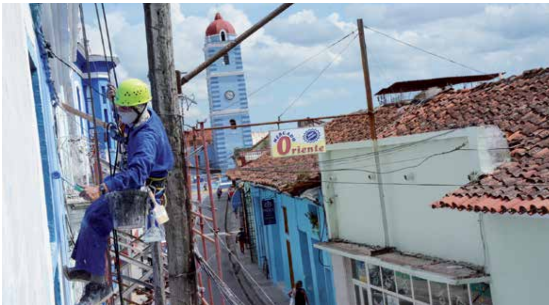
Entre las acciones de rehabilitación figura la pintura de varios inmuebles.