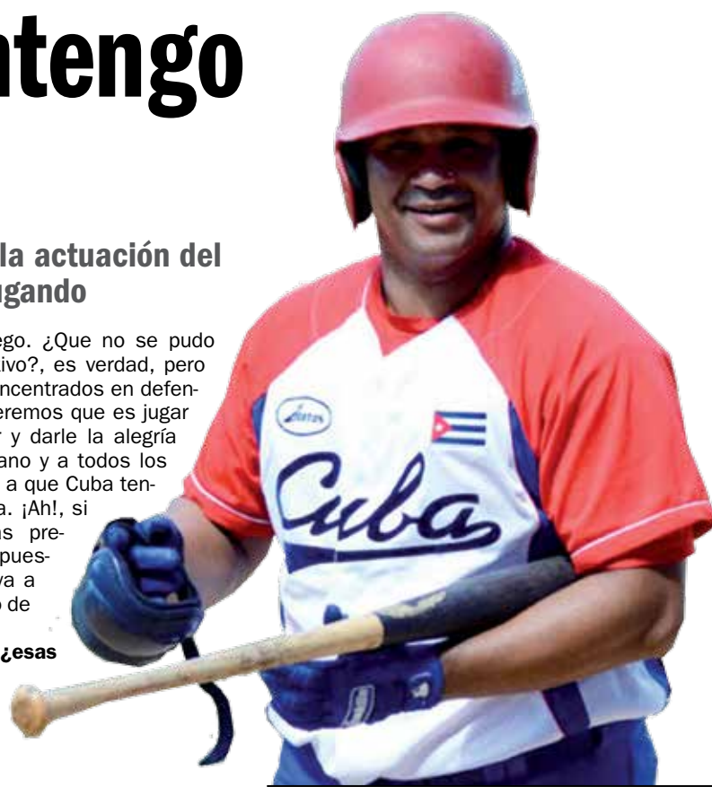
El estelar espirituario asegura que no se dará por vencido.

Allí no hubo presión de ningún tipo, ni por la dirección del equipo ni por el Inder. Sucieron situaciones con personas que tomaron su decisión, pero no pasó nada, a