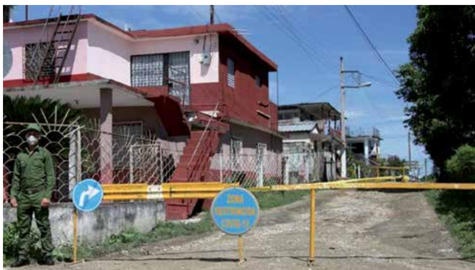
La capital espirituana sigue presentando la situación más compleja.