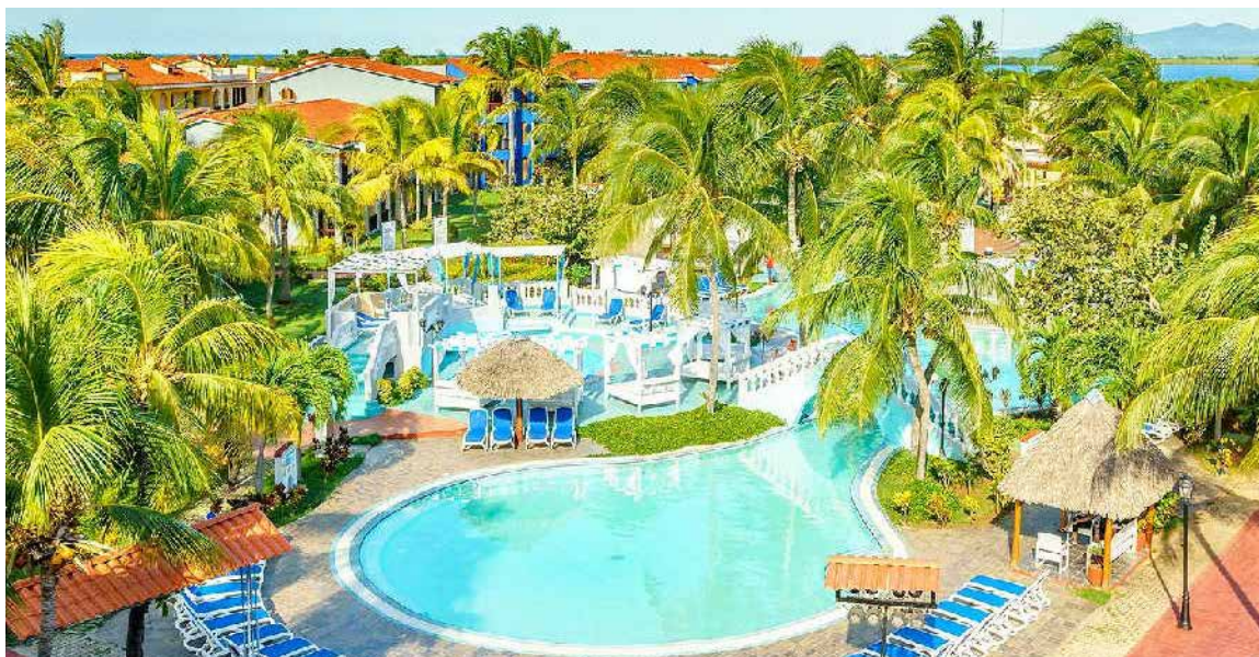
En el hotel Memories Trinidad del Mar se labora para recuperar un grupo de habitaciones.