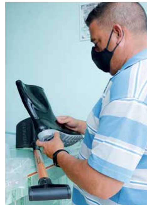
En la tienda situada en el centro comercial La Sierrita, en la carretera hacia Trinidad, se hace la oferta en MLC.