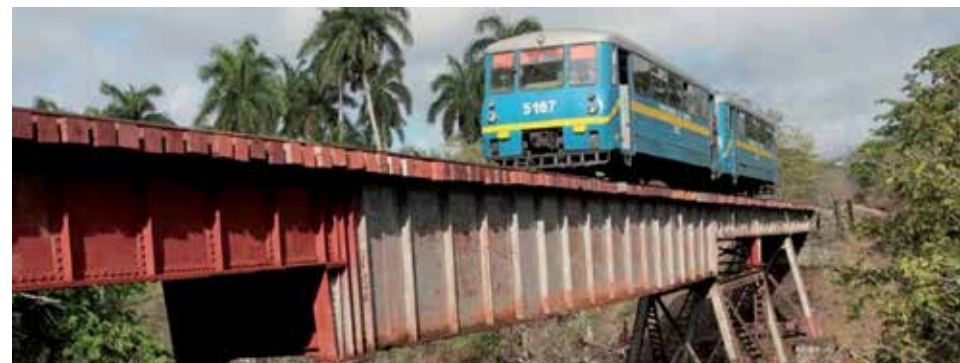
La reparación del ramal Zaza-Siguaney satisface una reiterada demanda popular.

La funcionaria recordó, además, que en cumplimiento de las indicaciones emitidas por el presidente de la Asamblea Nacional Esteban Lazo Hernández de no realizar el Proceso de Rendición de Cuenta del delegado a sus electores por la situación de la pandemia, los delegados mantienen el vínculo con sus electores a través de su presencia en otras acciones relacionadas con el control a los servicios brindados por Comercio y Gastronomía, así como las ventas realizadas por la corporación Cimex y TRD, tanto en su propia circunscripción como en el Consejo Popular y el seguimiento a la elaboración y calidad de los alimentos del Sistema de Atención a la Familia.