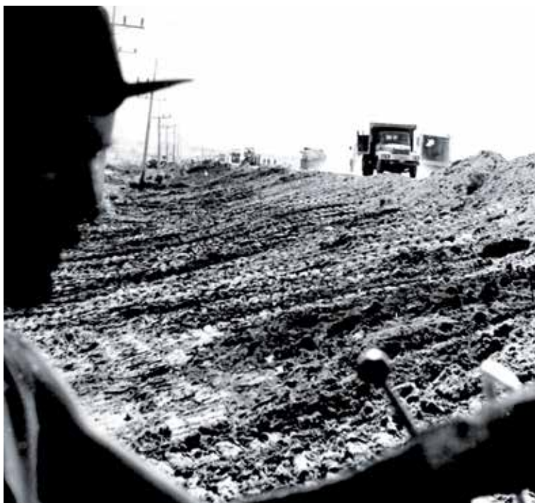
La ejecución de la Zaza fue una epopeya constructiva a inicios de la década del 70 del siglo pasado.

Luego de construida la Zaza he pasado mucho por allí, hasta me he parado arriba de la cortina y enseguida rememoro aquel trabajo. Me reanima pensar que todo el sacrificio que hicimos un grupito de siete personas está recompensado con esa enorme obra hidráulica de la Revolución.