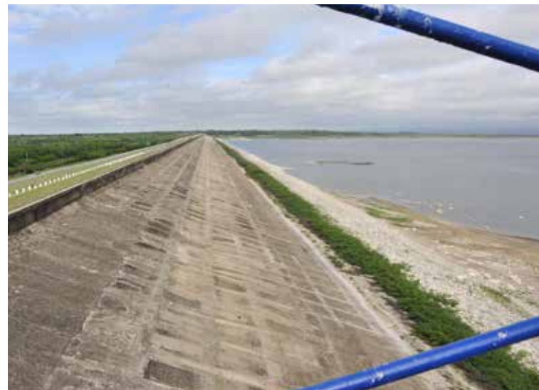
En mayo del 2017 la intensa sequía dejó ver, como pocas veces, la majestuosa cortina.

¡Qué va!, hicimos también un levantamiento topográfico a través del vaso de la presa, una poligonal —trazado que no es recto— marcando puntos cada 250 metros hasta cerca de la Carretera Central, otra por la carretera del hotel Zaza, y para la otra banda del embalse, definiendo todo lo que había en el terreno y las cotas de lugares donde no llegaría el agua de acuerdo con el nivel de la cortina.