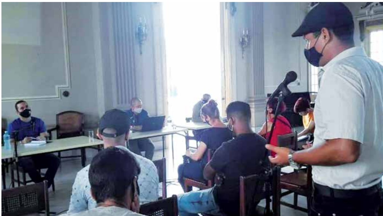
Los asociados insistieron en la necesidad de asumir el ejercicio del criterio en cada uno de los espacios creativos.