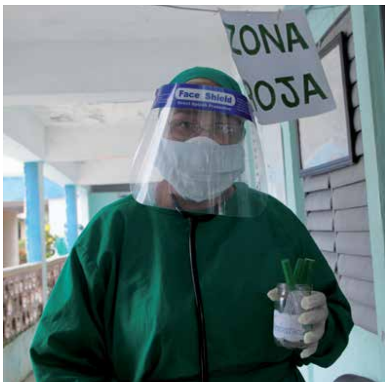
El control de la pandemia sigue siendo un asunto pendiente.