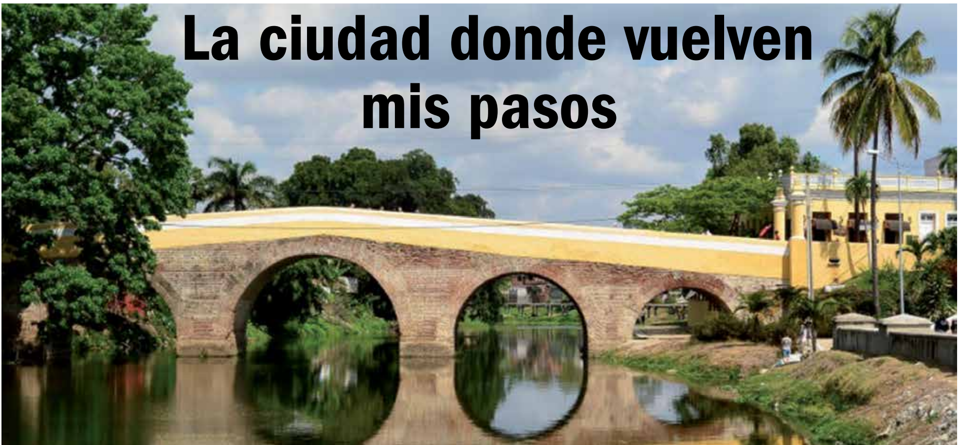
El puente sobre el río Yayabo constituye un símbolo entrañable de la villa.