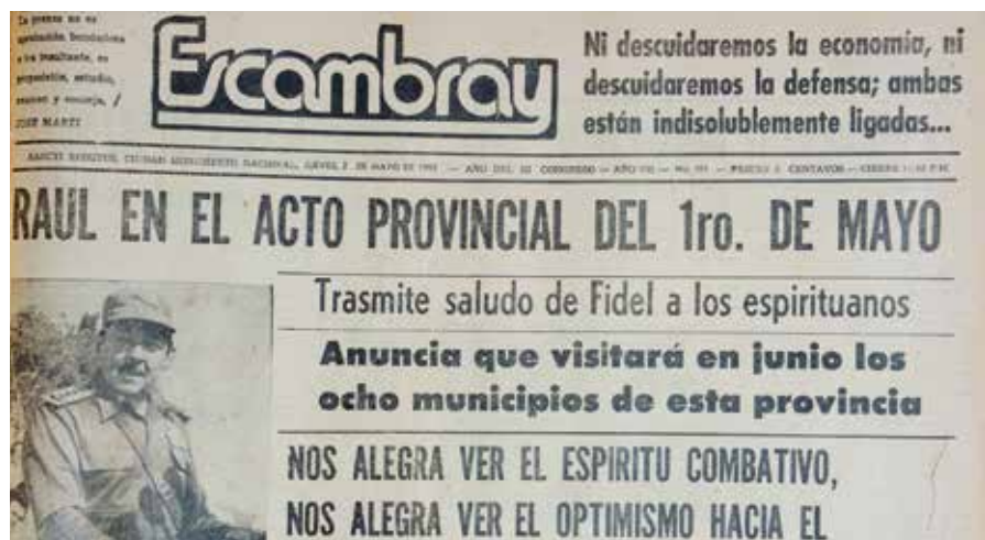
Así reseñó Escambray la visita del General de Ejército en junio de 1985.