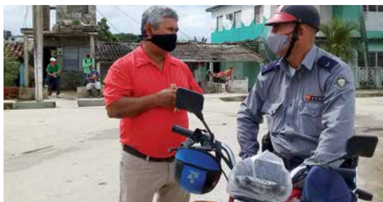
En el Reparto Escribano aprendió a valorar los vínculos con la comunidad.

Por fortuna, ahí están los hombres y mujeres de ese cuerpo armado, codo a codo con el pueblo, y en esta etapa de enfrentamiento a la COVID-19 se les ha visto en las calles, preservando el orden y ayudando a cuidar la salud del pueblo.