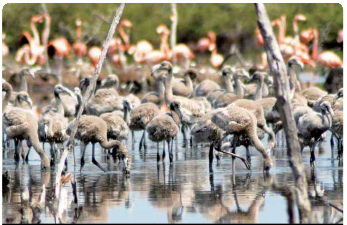
En el Parque Nacional Caguanes, en Yaguajay, anidan poblaciones de flamencos de singular belleza, que se distinguen por su colorido.