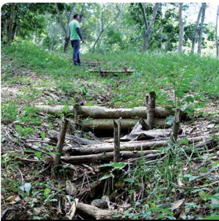
En las Alturas de Fomento se emplean barreras para evitar la erosión de los suelos.