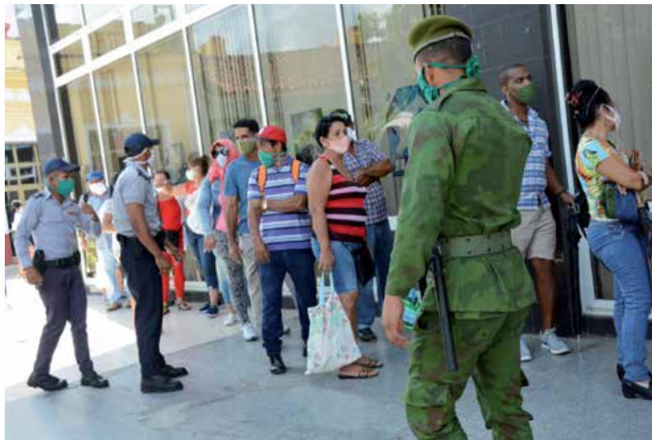
Las fuerzas del Minint han sido un baluarte en la lucha contra la COVID-19.