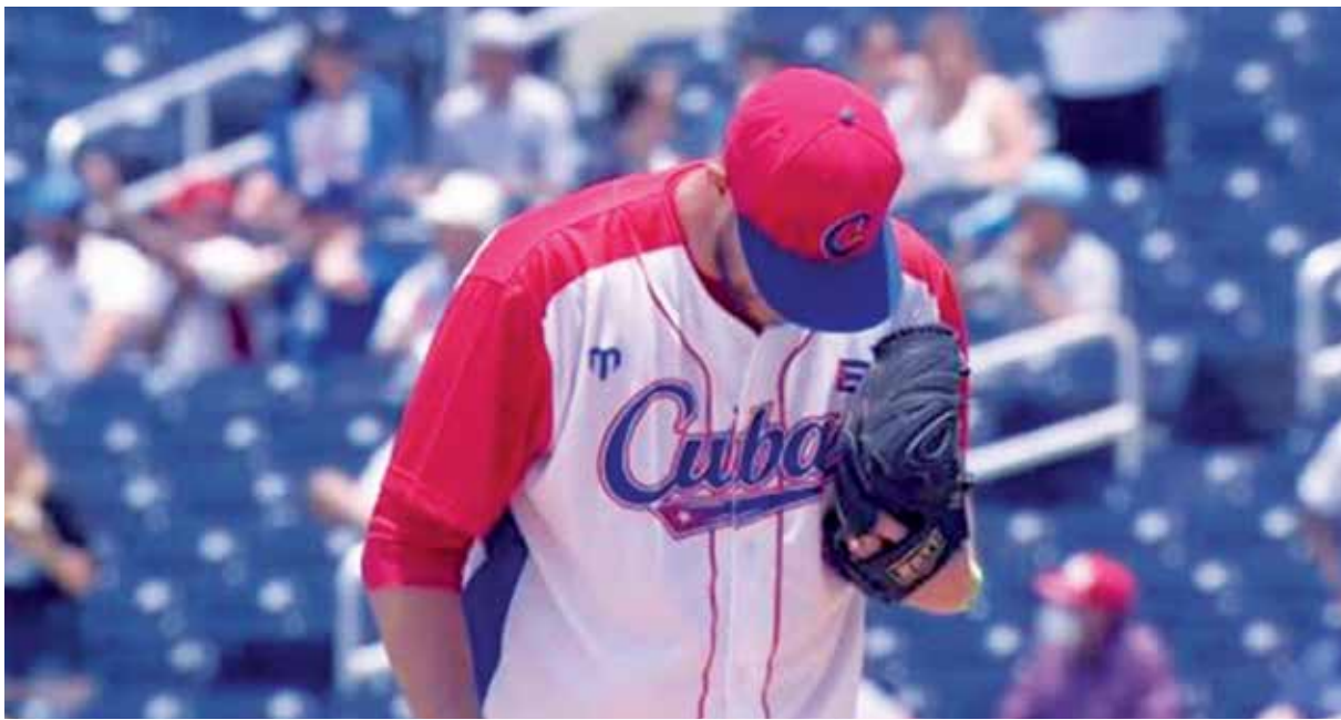
El pitcheo abridor no pudo hacerse justicia a la hora clave.