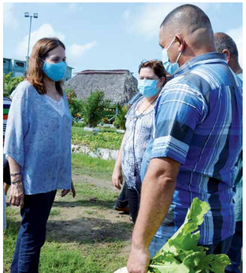
El recorrido incluyó centros productivos y entidades vinculadas con los servicios a la población.

"Esta rendición de cuenta del Gobierno de Sancti Spíritus a la Asamblea Nacional resulta, en esencia, la rendición de cuenta de todo el pueblo espirituario, otra motivación para seguir aportando en aras de resolver los desafíos pendientes y consolidar los resultados de trabajo del territorio, en el marco también de los aniversarios de la fundación de sus villas", subrayó en una de sus intervenciones la Vicepresidenta del Parlamento cubano.