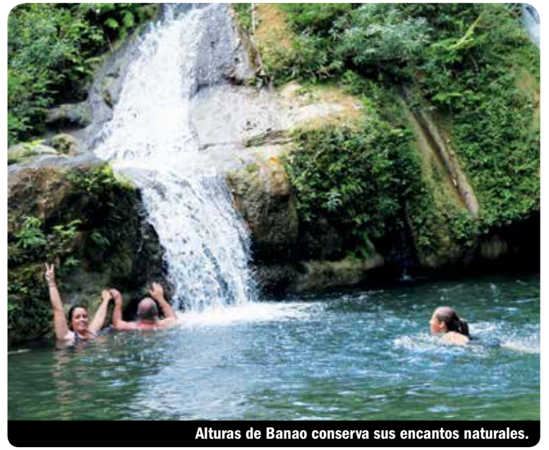
Alturas de Banao conserva sus encantos naturales.