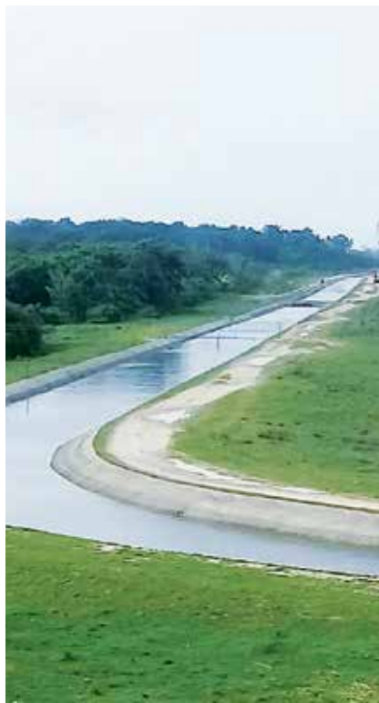
El canal La Felicidad ya beneficia plantaciones cañeras en Jatibonico.

A la par de la rehabilitación de la presa se acciona en la extensión del canal La Felicidad, una obra de alto interés hidráulico que llegará a 18 kilómetros —tiene ejecutados 3.3— y proyectada para beneficiar plantaciones cañeras y agrícolas en las provincias de Sancti Spíritus y Ciego de Ávila.