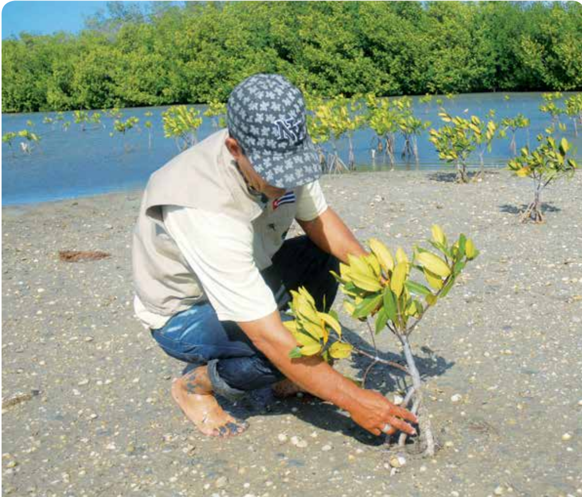
Luego de sufrir serias afectaciones, la recuperación de los manglares comienza a ser una realidad.

Este 5 de junio los espirituanos reafirman su compromiso de continuar preservando el entorno a favor del desarrollo sostenible