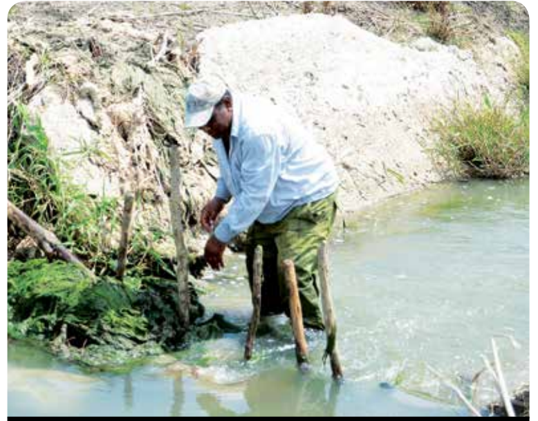
El sistema de canales de Sur del Jíbaro garantiza un equilibrio entre la economía y la naturaleza.

Aun cuando falta camino por recorrer en este sentido, en el territorio se siguen de cerca los proyectos de la Tarea Vida, la recuperación de los manglares, la actualización de los estudios de peligro, vulnerabilidad y riesgo a tono con los fenómenos meteorológicos más recientes y los presupuestos de las regulaciones ambientales vigentes, entre otras prioridades.