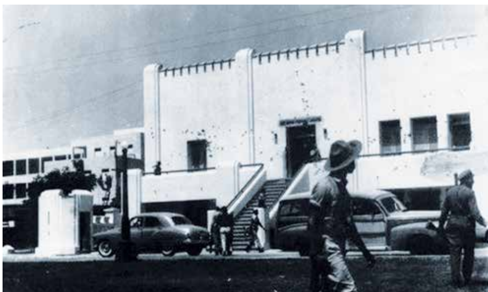
El Moncada fue atacado el 26 de julio de 1953 por un grupo de jóvenes que luego sufrieron persecuciones y asesinatos a manos de la tiranía batistiana.

"Defender banderas en tiempos difíciles es cuando verdaderamente resulta meritorio. (...) Defender el socialismo cuando no hay solamente dificultades internacionales, sino dificultades también nacionales, es verdaderamente lo más meritorio, y tenemos que defender el socialismo ahora que hay dificultades internacionales y hay también dificultades nacionales. Unas son derivadas de nuestros propios errores, otras son derivadas de coyunturas que están más allá de nuestras posibilidades".