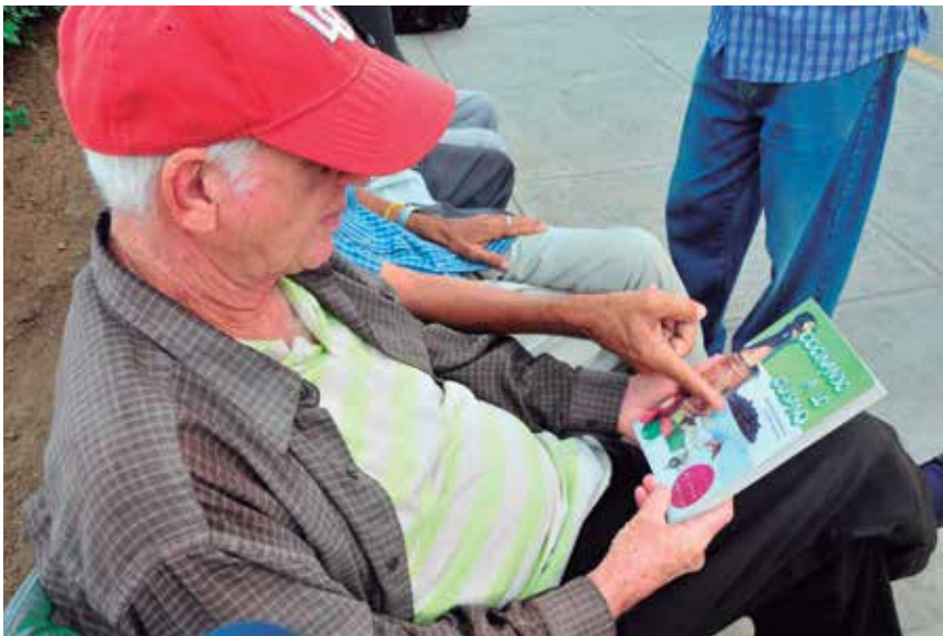
Los adultos y adultos mayores siguen apostando por el libro impreso.

Un estudio sobre el hábito de la lectura en la provincia arrojó importantes luces sobre ese necesario mediador en la formación de los seres humanos