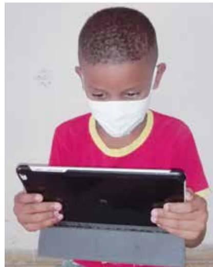
El público infantil y juvenil prefiere la lectura en formato digital.

Cada acción que forme como mínimo a un nuevo lector resultará una gran victoria frente a las carencias y necesidades culturales en un contexto donde el flujo de información no encuentra frenos. No debe prevalecer como preocupación si se lee de forma tradicional o en formato digital, sino cómo conducirlos a productos que incidan en la formación como seres sociales.