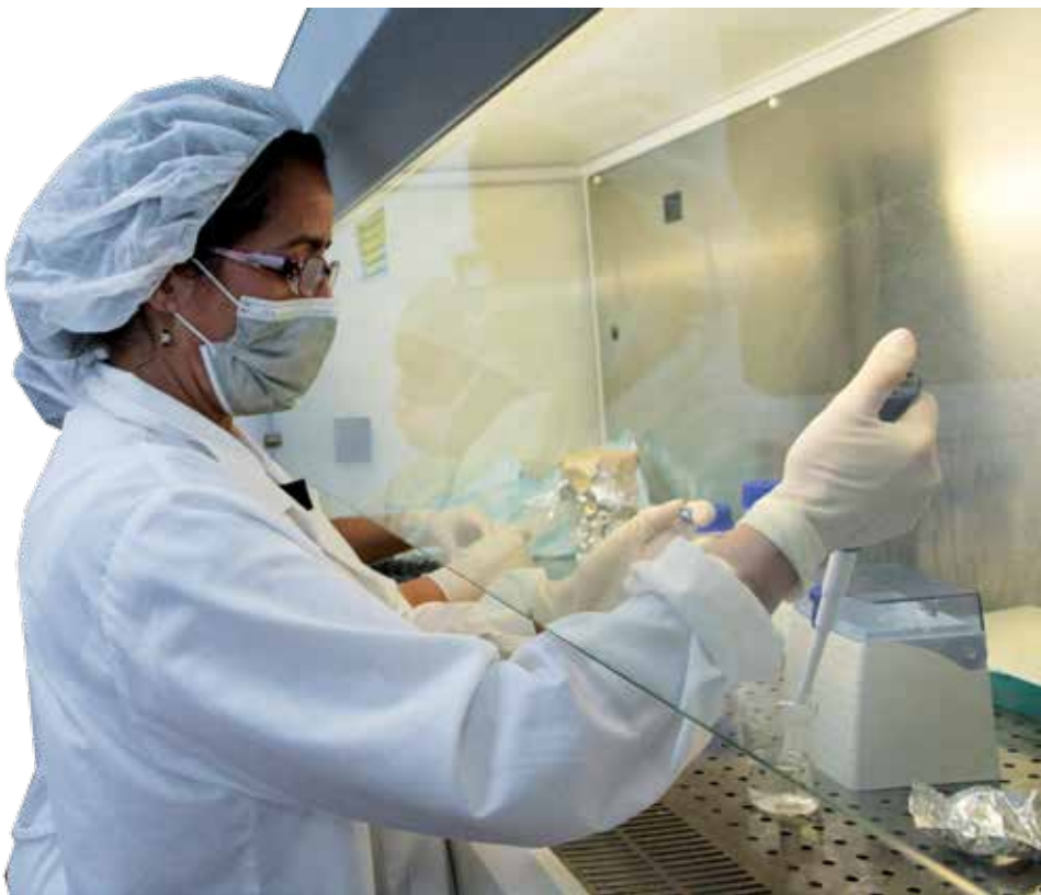
Los jóvenes del CIGB resultaron pieza clave en este resultado.