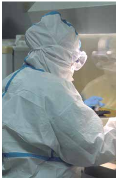
La detección de contagiados en el menor tiempo es una premisa para frenar la transmisión.

Y también lo sostiene Marcos, quien igualmente se ha probado como casi médico y equilibrista: “A los pacientes les llevamos desde las seis comidas que se les dan hasta