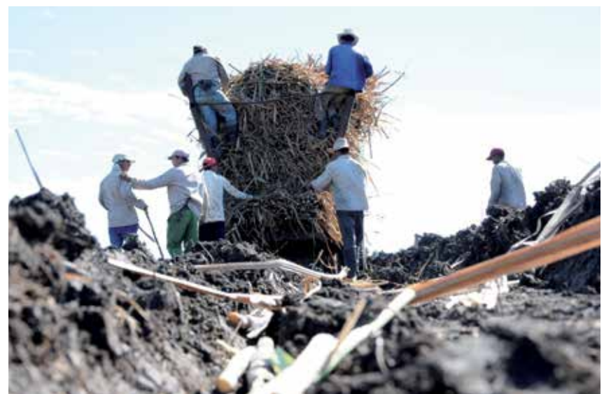
Los espirituanos ofrecerán su aporte a la siembra de caña en áreas de los dos centrales del territorio, entre otras labores.

“En dependencia de las necesidades de los municipios —acotó López Martín—, los trabajos podrán realizarse durante sábado y domingo, lo cual incluye también la preparación de los vacunatorios previstos para el inicio de la inmunización de la población, porque muchos de ellos radicarán en escuelas o centros de trabajo y precisan de detalles finales en cuanto a pintura, limpieza e higienización”.