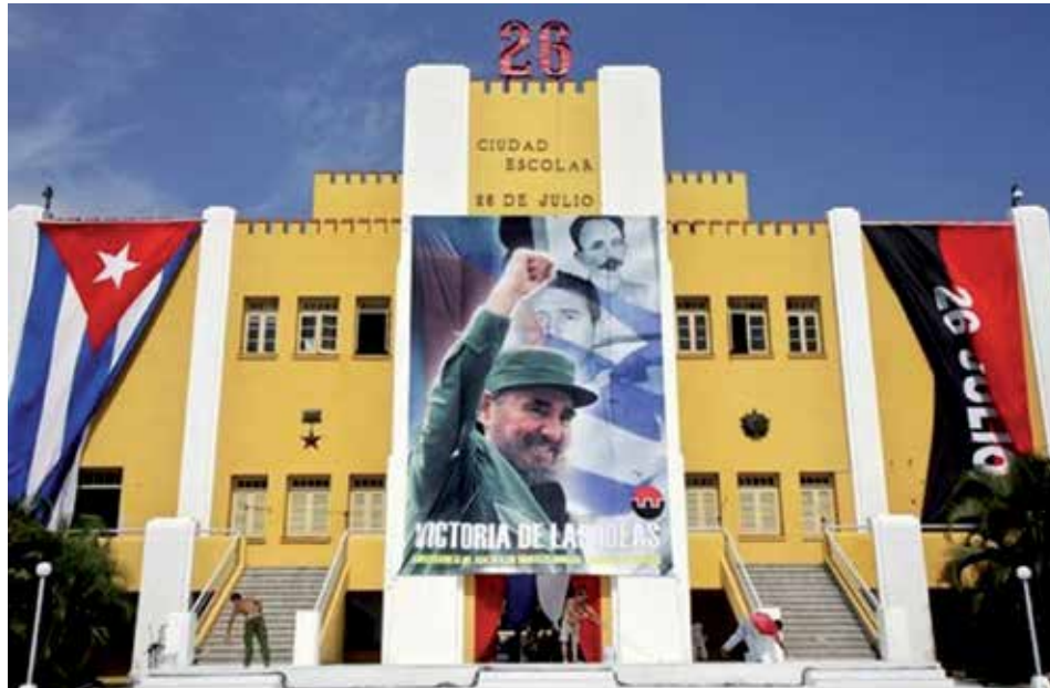
El cuartel convertido en escuela constituye un símbolo de la rebeldía de nuestro pueblo a favor de su libertad.

Segundo, que el autor intelectual de los hechos de la mañana de la Santa Ana era nuestro Héroe Nacional José Martí y que