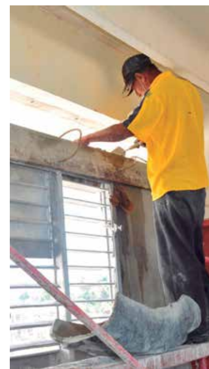
Entre las acciones figura el cambio de carpintería en varios planteles.

El jefe del Departamento de Inversiones afirmó que cada año la Dirección Provincial de Educación realiza trabajos de reparación y mantenimiento en su red escolar, asunto que en medio de los contratiempos mitiga el deterioro que sufren algunas instalaciones docentes.