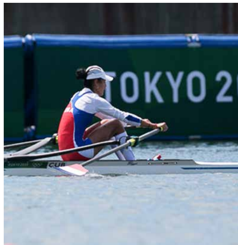
La esportuana entró cuarta en su hit eliminatorio.