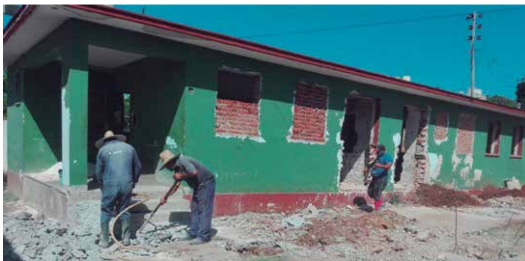
Esta inversión es la más importante del sector de la Salud en la provincia.