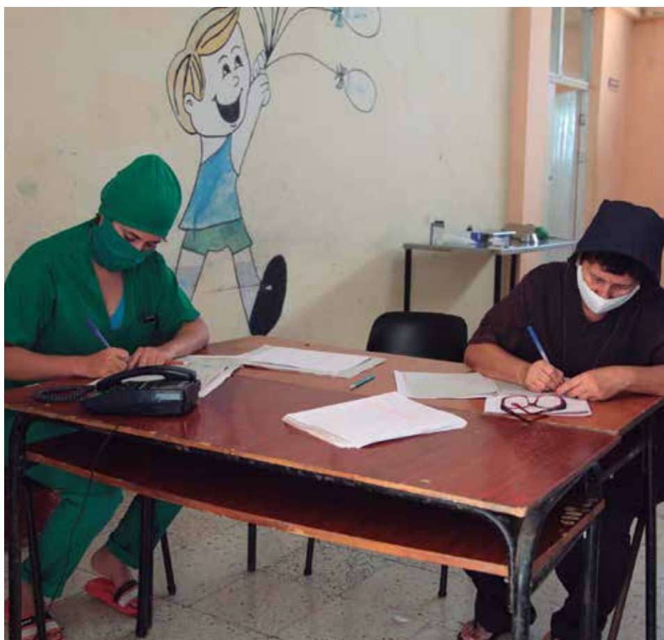
Trabajadores de la Salud y de otros sectores se han integrado en la lucha contra la pandemia en el territorio espirituario.