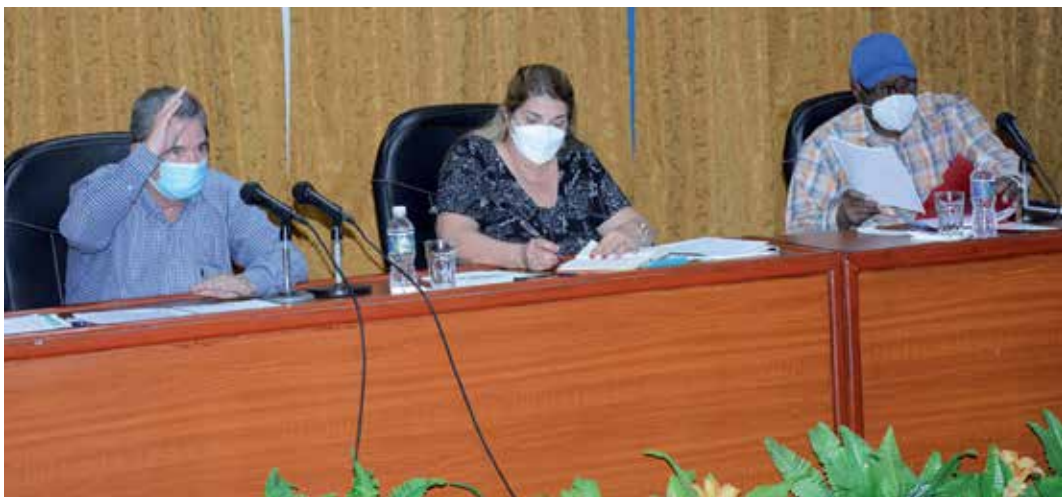
En el encuentro se indicó mantener un monitoreo diario de los mercados agropecuarios.