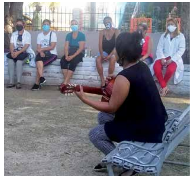
La juventud fue protagonista de la experiencia.