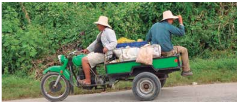
Los propietarios de estos vehículos deberán inscribirlos en el plazo establecido; fuera del mismo perderán el derecho a la legalización.

Igualmente, se exigirán fotocopia del Carné de Identidad del propietario y tres fotos impresas tipo postal del medio de transporte en distintas posiciones (frontal, lateral y trasera). Una vez que pase por el Somatón, donde se emite un certificado de revisión, si el medio queda apto para circular, completará el expediente para presentarlo ante la comisión Minint-Mitrans de la provincia y, de ser aprobada la propuesta, se elevará a su homóloga nacional, que finalmente legalizará la solicitud.