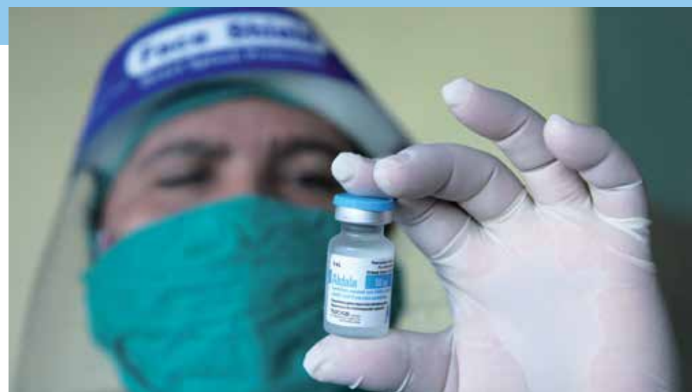
Infografía: Dayamis Sotolongo y Yanina Wong / Fotos: Oscar Alfonso / Fuente: Dirección Provincial de Salud

Esquema de vacunación: tres dosis (primera, a los 14 días y a los 28 días)