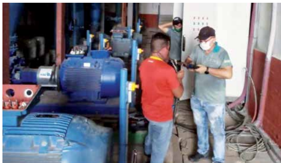
El acueducto de Jatibonico asegurará mayor calidad del agua y un servicio más estable para la cabecera municipal y comunidades periféricas.

El proyecto hidráulico, actualmente en explotación limitada, está siendo ejecutado a un costo que supera los 15 millones de pesos en moneda total