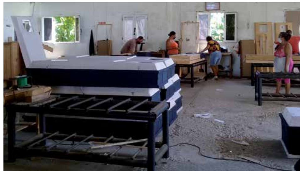
En la Fábrica de Ataúdes de la provincia, ubicada en la ciudad cabecera, se ha triplicado el número de féretros construidos en los últimos meses.

Jornadas verdaderamente épicas se viven al interior del engranaje. A juzgar por los registros del centro, en el mayor cementerio espirituario se realizó en el pasado mes de julio cerca del triple de los sepelios en relación con igual período del año anterior, y en agosto el número (206) se fue muy por encima de los 111 del mismo lapso correspondiente al 2020.