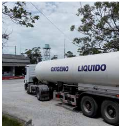
Sancti Spíritus entrega también cilindros de oxígeno medicinal a Villa Clara.

La planta espirituana procesa el producto líquido proveniente de La Habana y Santiago de Cuba, así como el importado o donado por países solidarios