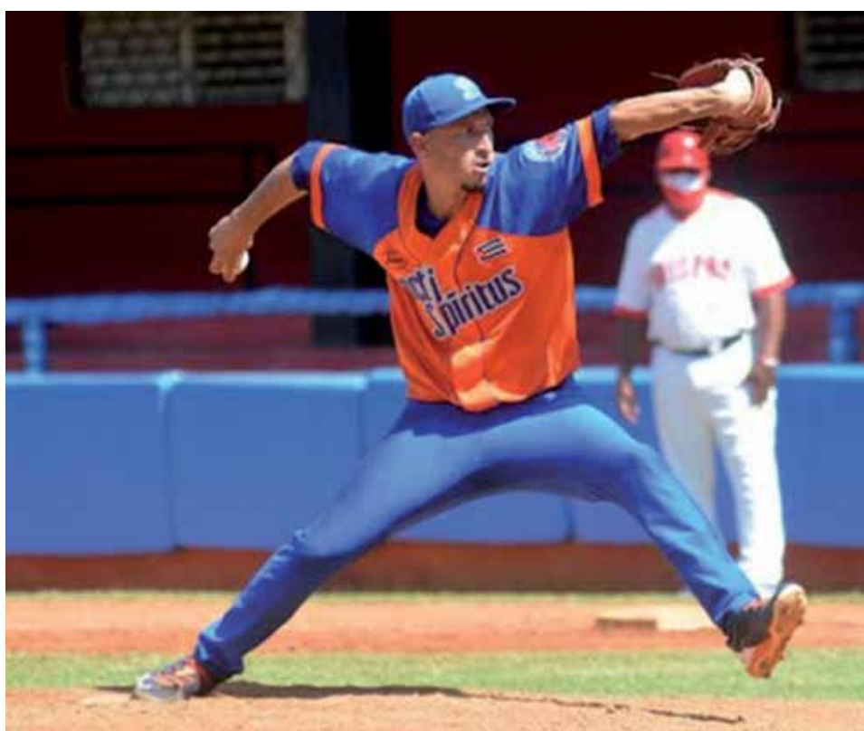
El lanzador Yuen Socarraz se sumará ahora al club Leones del Escogido, de República Dominicana.