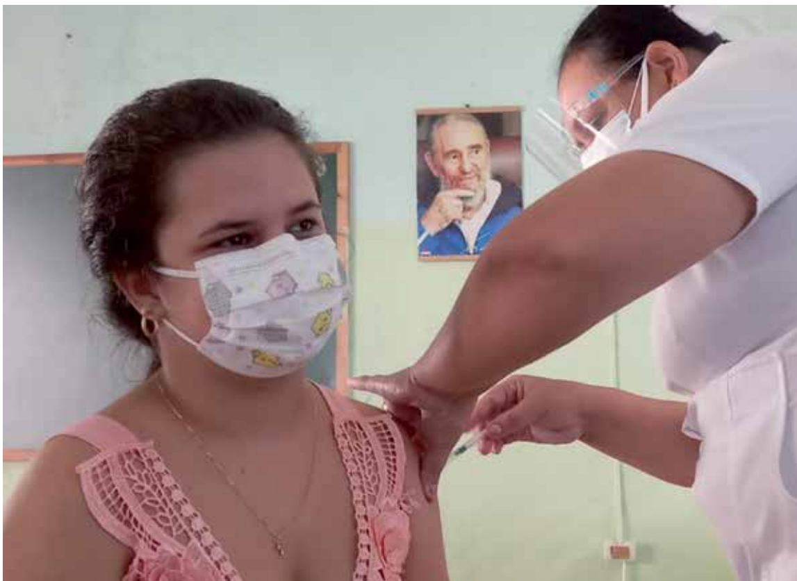
A este grupo etario se le suministra la vacuna Soberana 02.