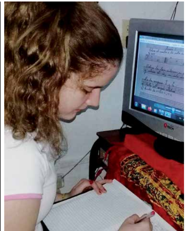
Los estudiantes de la Enseñanza Artística se preparan en casa con la guía de sus profesores.

Ansia que impide olvidar las finas huellas precoces camufladas en las voces dispuestas a caminar.