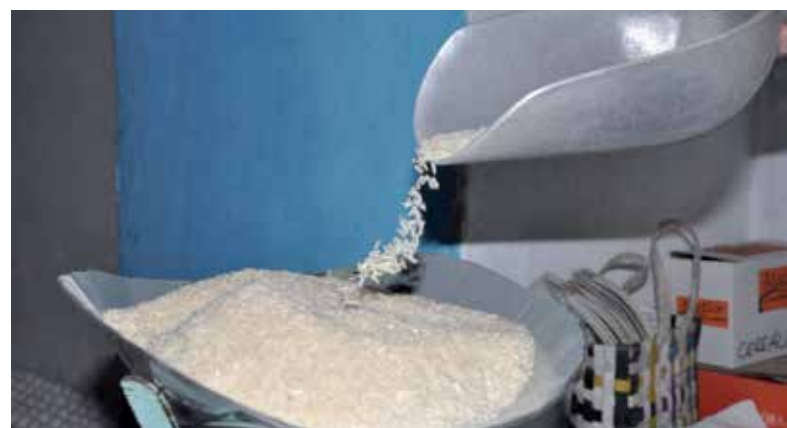
La entrega de arroz adicional se interrumpe hasta diciembre.

De igual forma destacó el compromiso de la juventud espirituanas con este proceso de marcada relevancia para el país, al igual que con el enfrentamiento a la covid, una etapa en la que las nuevas generaciones tampoco han dejado de impulsar tareas de impacto en el orden económico y social.