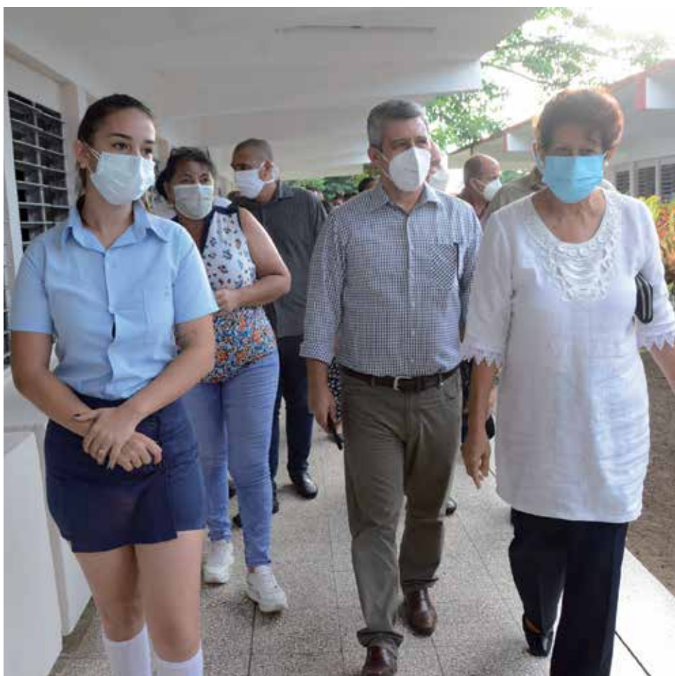
El viceprimer ministro Jorge Luis Perdomo intercambió con estudiantes y trabajadores del centro mixto Antonio Maceo, de Taguasco.

Ese fue el llamado del viceprimer ministro cubano, Jorge Luis Perdomo Di-Lella, en encuentro con representantes del quehacer socioeconómico en el territorio espiritano