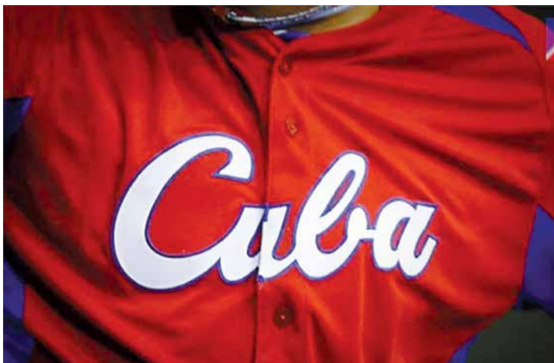
La pelota se lleva en el corazón de los jugadores y de toda Cuba.