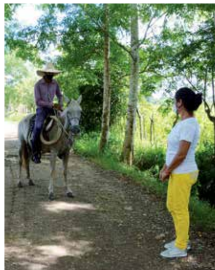
La restricción de la movilidad llega hasta el barrio de El Almendrán, donde se evidencia un complejo escenario epidemiológico.

El territorio también necesita mantener el control estricto de sus fronteras, tal como sucede en la entrada del camino que conduce al caserío de El Almendrán, donde tres trabajadoras de Educación hacen guardia desde las seis de la mañana hasta las seis de la tarde, en aras de evitar que los habitantes del lugar entren o salgan porque esa zona está en cuarentena. Constancia, disciplina y voluntad es lo que se requiere en la tierra del arroz para dar el puntillazo final a la pandemia.