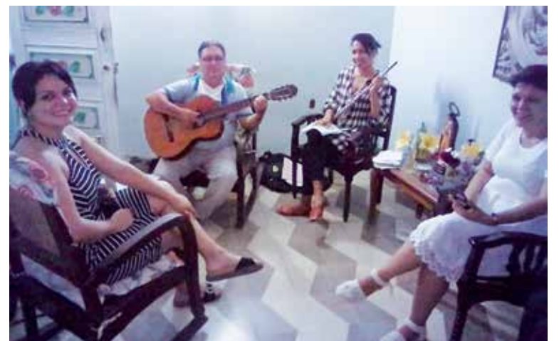
A su tiempo se confirmó como un proyecto que defiende la paz.

los integrantes pueden pedir la palabra. Dicen un poema, cuentan una historia de vida, conversan, se canta...”.