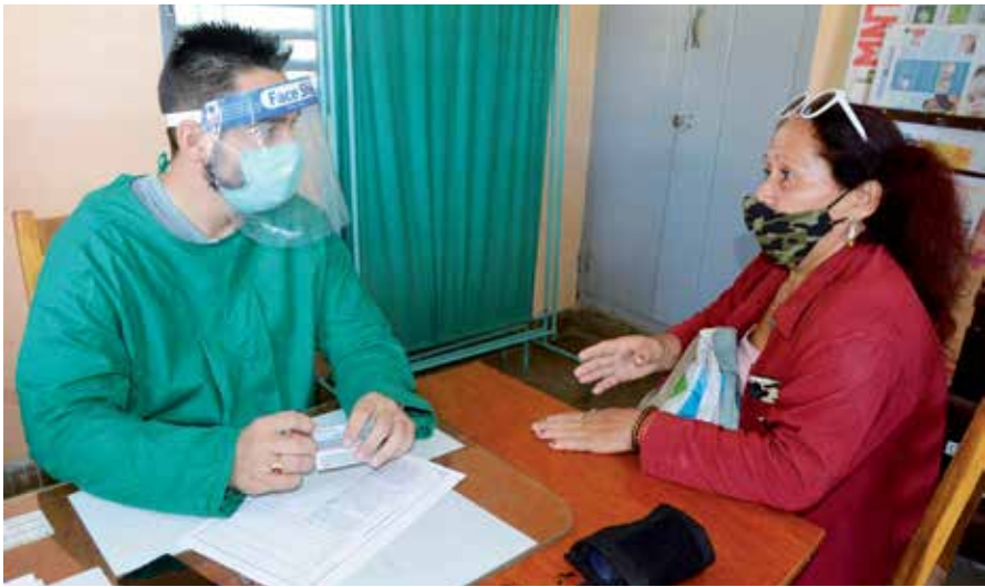
Hasta las consultas de Infecciones Respiratorias Agudas llegan los pacientes.

Un estudio poblacional, varias zonas en cuarentena y un mayor control de las entradas y salidas en las comunidades fronterizas figuran entre las principales medidas que se aplican en ese municipio