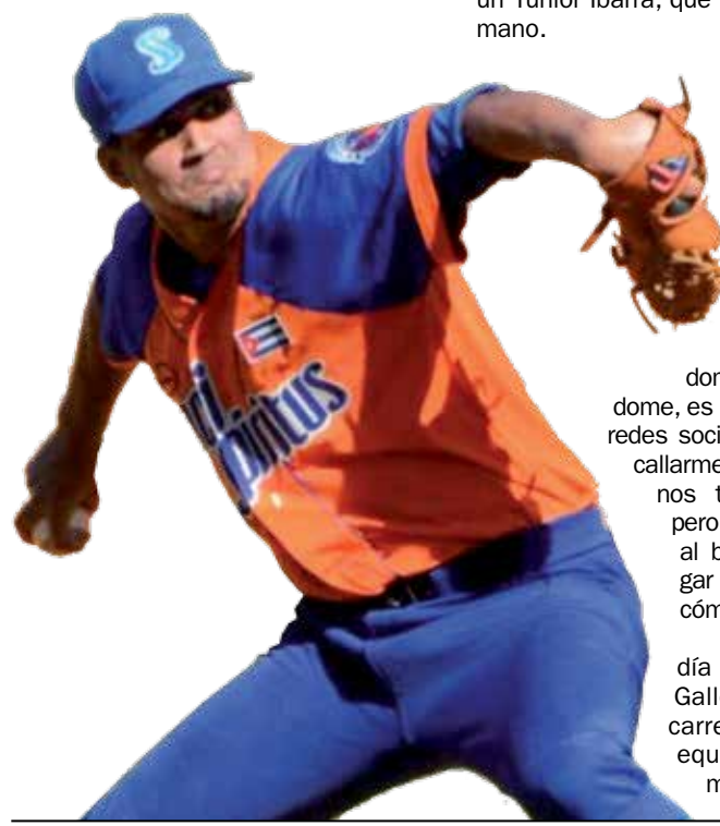
Pedrito aguarda por la decisión de la Comisión Provincial de Béisbol.

“Espero algún día jugar con los Gallos y cerrar mi carrera aquí con el equipo que me formó”. (E. R. R.)