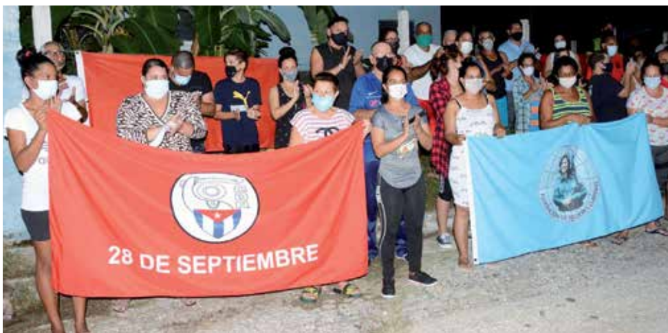
Desde los barrios se alzan las voces de los jóvenes que aseguran ser la continuidad para materializar el desarrollo y la defensa del país.

Ratificaron vecinos de la Zona 167 de los Comités de Defensa de la Revolución en Sancti Spiritus ante el llamado a marchas “pacíficas” en la isla el próximo 15 de noviembre