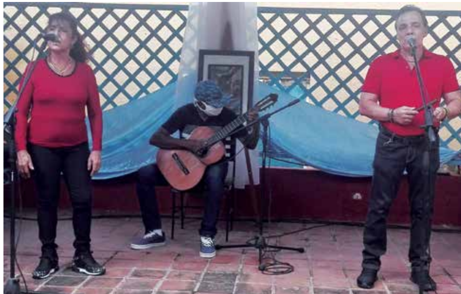
El dúo Los bohemios ostenta la categoría nacional.

“Ya está el catálogo nacional. Por iniciativa nuestra diseñamos el provincial con más de 70 unidades, tanto con el máximo nivel como el que se otorga por los especialistas del Consejo. Pero no hemos podido imprimirlo por falta de recursos. Por eso, reconocemos lo realizado por el colectivo de la Osvaldo Mursulí, que sin tener cómo, sino por esfuerzos propios, pudieron materializar esa necesidad,