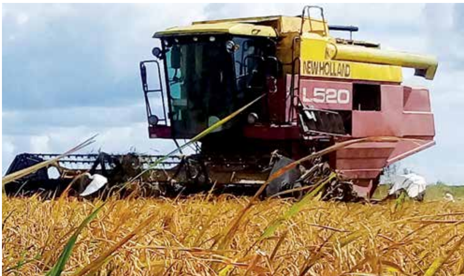
En la producción arrocera descansa uno de los pilares fundamentales de la economía del municipio.

Sus hijos —una hembra y un varón— saben de su afición por desempeñarse en la zona de riesgo y respetan su preferencia. La dirección del centro la menciona entre los primeros en el grupo de trabajadores que merecen reconocimiento por su aporte. Y ella, decorosa y sincera, no pierde la ocasión para agradecer: “Perdone que la llame, pero es que en la entrevista hablé solo de mí y eso no es justo. Quisiera que escribiera sobre las atenciones de mi colectivo, que se preocupa por todo, hasta por apoyar a mi familia cuando he estado lejos de la casa”.