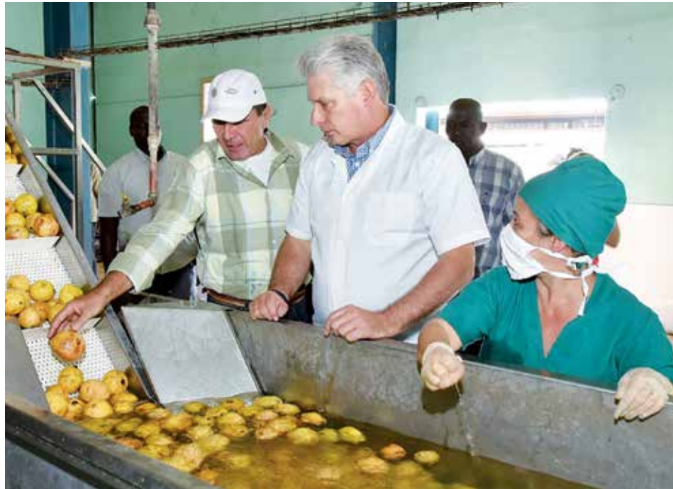
En una de sus visitas al territorio espirituano, el Presidente cubano Miguel Díaz-Canel Bermúdez ponderó las potencialidades productivas de Sur del Jíbaro.

Igualmente, ha sido insuficiente la exigencia al trabajo de la Unión de Jóvenes Comunistas y a las organizaciones de masas para que logren objetividad en sus listas de reservas, prioricen la preparación y calidad de sus cuadros con el interés de garantizar el tránsito hacia la organización partidista, lo que denota la falta de intencionalidad y la no identificación de reservas idóneas.