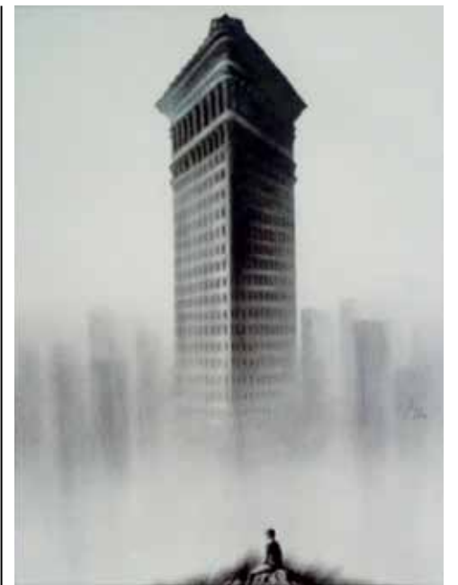
El dibujo Contemplador de bosques , de Juan Carlos Lage, mereció premio.

Poco a poco y gracias al empuje arrollador del pequeño colectivo, la Casa de Cultura Osvaldo Mursulí Recarey ha intentado suplir necesidades y parecerse mucho más a su comunidad. De ahí que el día de la presentación del catálogo se escuchara el mejor de los piropos: “¡Esta Casa de Cultura está a otro nivel!”.