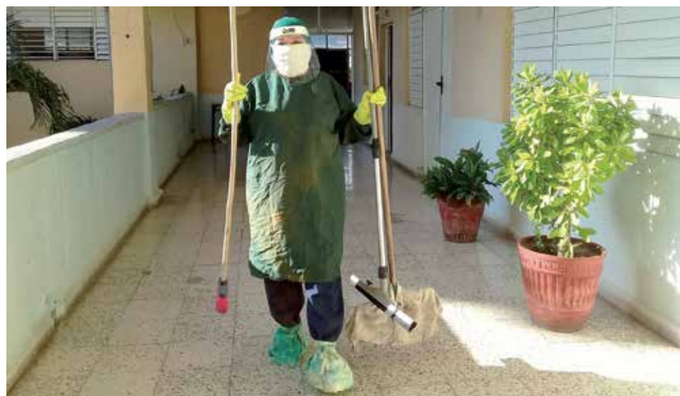
Desde marzo del presente año, la educadora se desempeña en labores de limpieza en la Zona Roja.

Por tal motivo, el Partido deberá continuar fortaleciendo el papel de las organizaciones de base para perfeccionar el trabajo político-ideológico e impulsar la actividad económica en función de avanzar y consolidar la implementación de las Ideas, Conceptos y Directrices del VIII Congreso del Partido Comunista de Cuba.