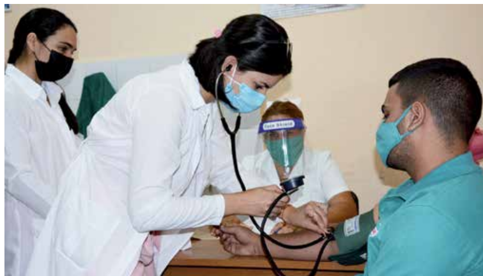
El trabajo del personal de la Salud ha sido decisivo para contener la enfermedad.

Numéricamente, Yaguajay encabeza esta semana los guarismos en el entramado provincial con 192 casos, lo cual —pese a que representa una disminución respecto a períodos anteriores— demuestra que aún la situación epidemiológica allí sigue siendo preocupante. Lo contrario ocurre en Sancti Spíritus: 190 contagiados en los últimos días, pero este territorio