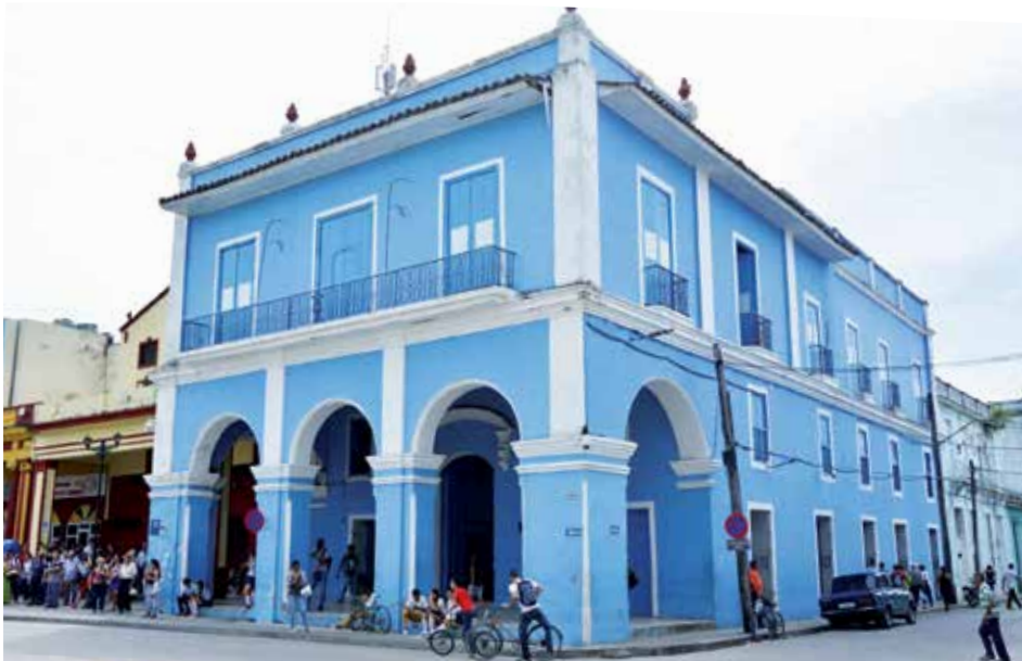
La Casa de Cultura Osvaldo Mursulí ha transformado su imagen y su quehacer.

Por primera vez en el sistema de Casas de Cultura de Sancti Spiritus, se presentó de manera impresa el catálogo de excelencia del movimiento de artistas aficionados en el municipio cabecera