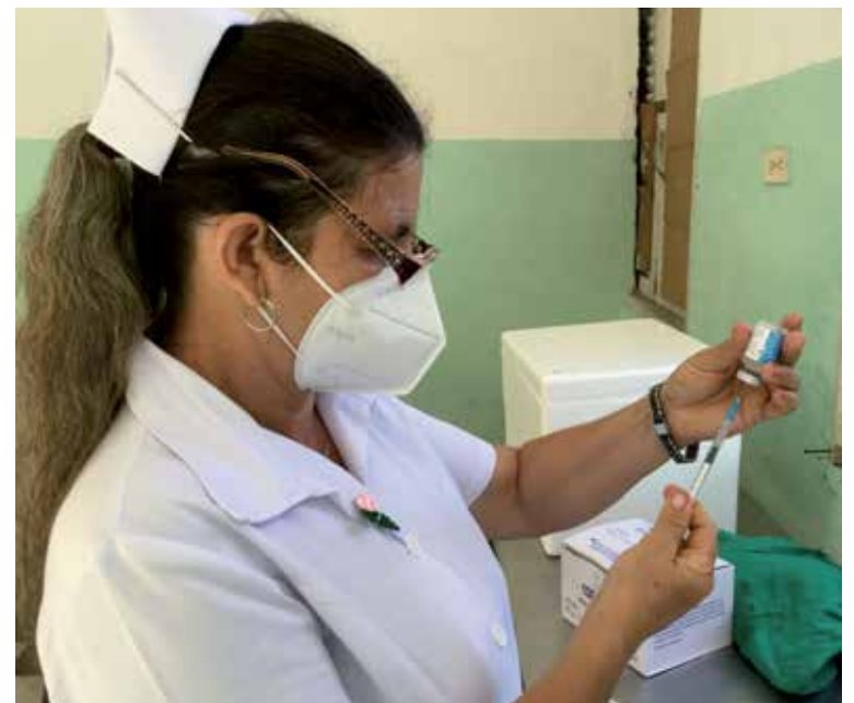
Los vacunatorios habilitados ya se encuentran listos.

Según la propia especialista, en diciembre también se vacunarán con este producto los niños de dos a cinco años que sean asmáticos.