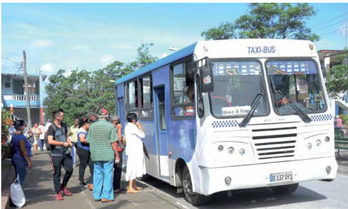
El transporte urbano circulará solo en horarios pico y hasta las 7:45 p.m.