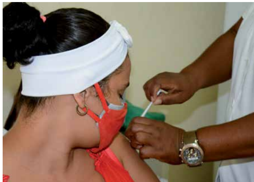
Más de 219 540 espirituanos han sido inmunizados contra la covid.

Como bien han insistido las autoridades sanitarias, el avance de la vacunación es también otro de los modos de protegernos y de ir, a su vez, cortándole un tanto el paso a la covid.