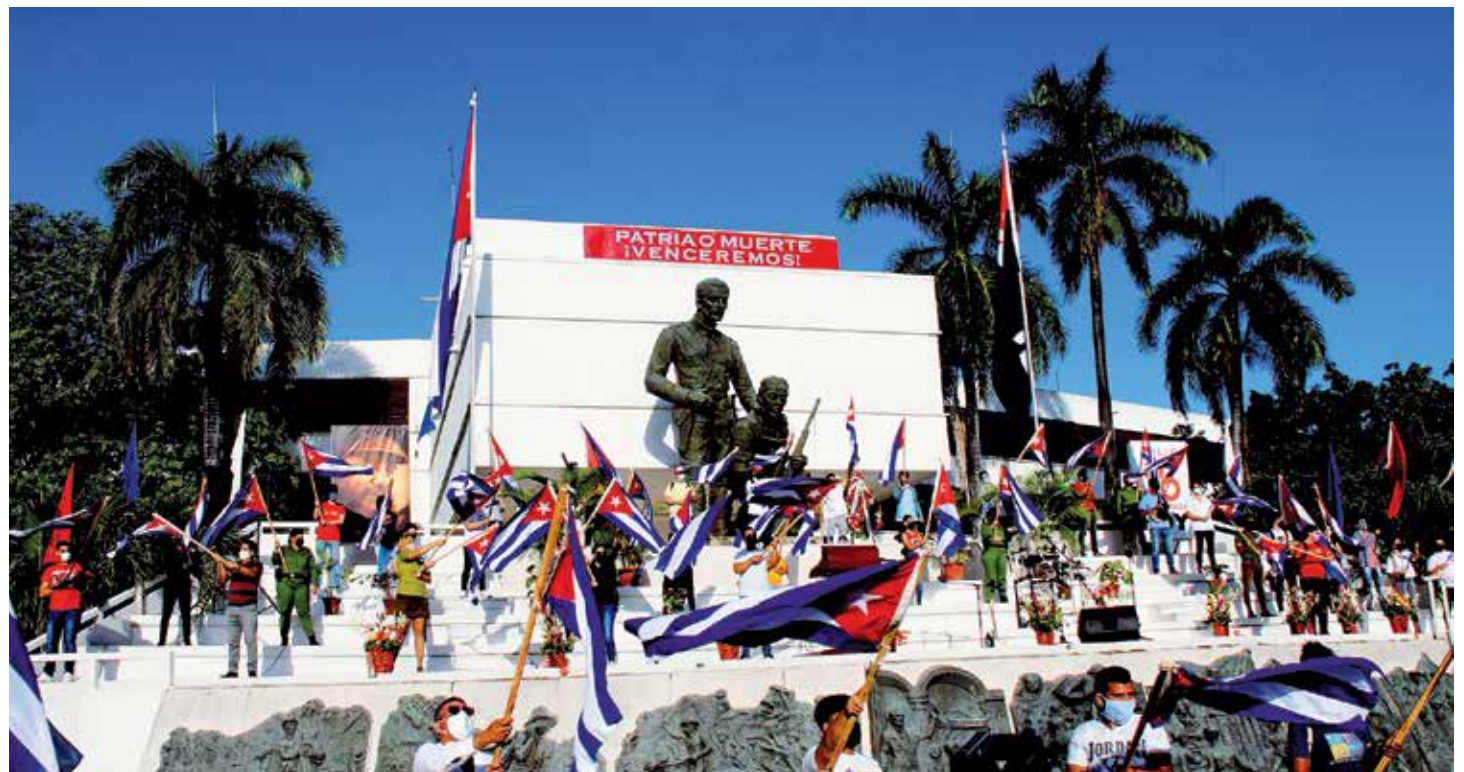
Los espirituanos reafirman su compromiso con la Revolución y el Socialismo.

En el año 2020 la Circulación Mercantil total se cumplió al 104.8 por ciento. El Comercio Minorista cumple al 101.4 por ciento, decidido por la Alimentación Pública con el 110.3 por ciento. Al cierre de septiembre la Circulación Mercantil total ejecuta 1 726 127 500 pesos, el 74.2 por ciento de lo previsto. El Comercio Minorista aporta 1 527 045 900 pesos, el 74 por ciento de lo comprometido, se afectan significativamente los surtidos de materiales de construcción, así como productos libe-