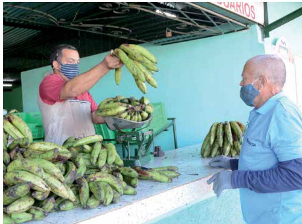
Continuar incrementando la producción de alimentos constituye una prioridad.

se cuenta con siete Parques Solares Fotovoltaicos (PSFV) interconectados al Sistema Electroenergético Nacional, los cuales suman 18.55 MW, en preparación se encuentran nueve con una potencia de 38 MW.