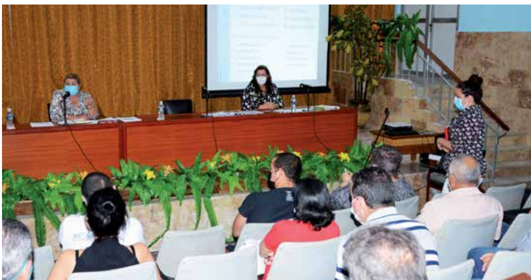
Las máximas dirigentes del Partido y el Gobierno en la provincia intercambian con los principales cuadros del territorio.