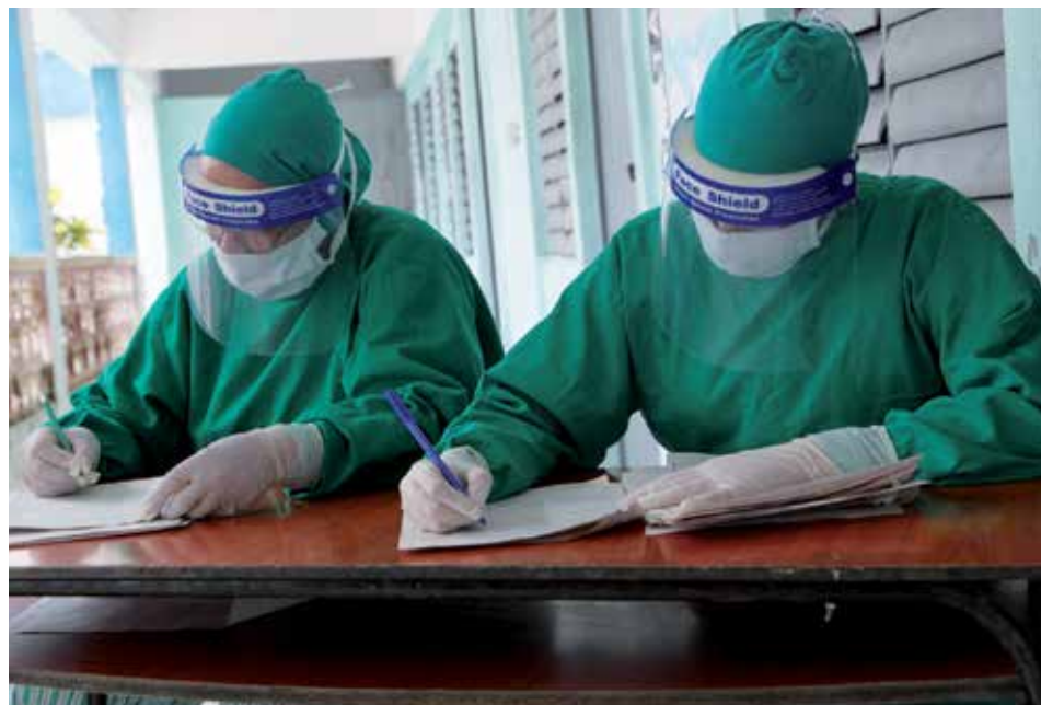
El enfrentamiento a la covid ha demandado un enorme empeño de los trabajadores de Salud y otras instituciones.

En relación con las Fuentes Renovables de Energía, se prevé alcanzar un 37 por ciento de generación en el 2030. En la actualidad