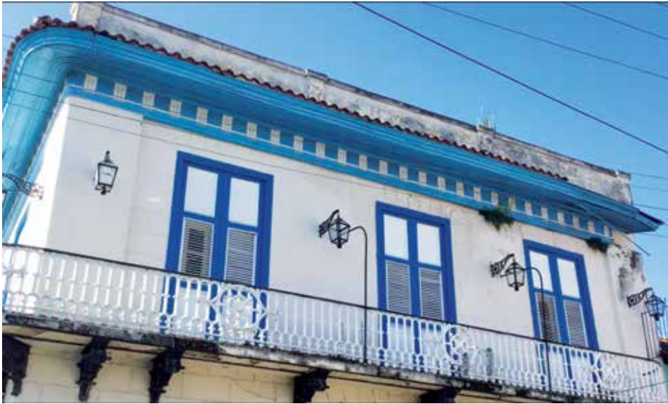
El moho, plantas y aleros semidesprendidos son los nuevos elementos “decorativos” de la institución.

Serias afectaciones en techos, humedad en las paredes y mal estado de la marquetería han obligado a ubicar en almacenes improvisados buena parte de su colección