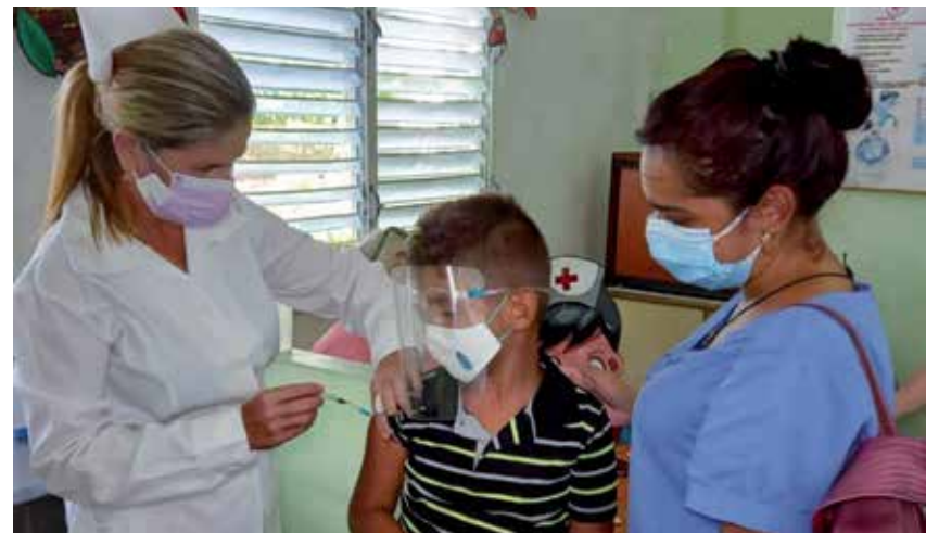
El 90 por ciento de los niños espirituanos han sido vacunados.

La vacuna cubana aún no está reconocida por la Organización Mundial de la Salud y en eso se está trabajando; entonces hay países que no la aceptan como Estados Unidos —y en el caso de los viajeros que tienen que entrar a ese país el Ministerio de Salud Pública aún no tiene respuesta para ello— y otros que sí como, por ejemplo, Guyana, mientras otras naciones solo piden el PCR.