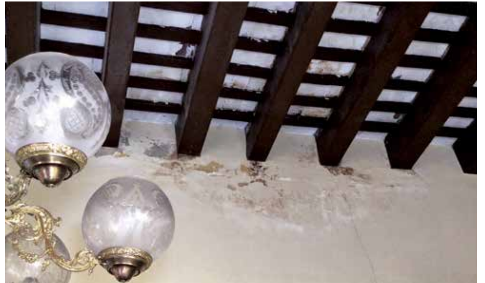
El desprendimiento de pedazos de techo obligó a resguardar los exponentes museológicos.

¿Desde el primer síntoma de que el deterioro era imparable dieron aviso?