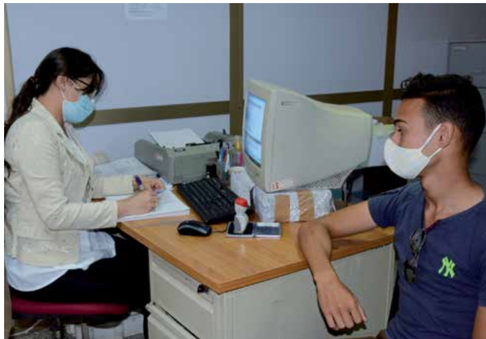
Los interesados en las nuevas modalidades de ahorro deben concurrir de forma presencial a las sucursales bancarias.

Hasta ahora estas cuentas solo las han abierto trabajadores bancarios. Aún es una oportunidad muy reciente.