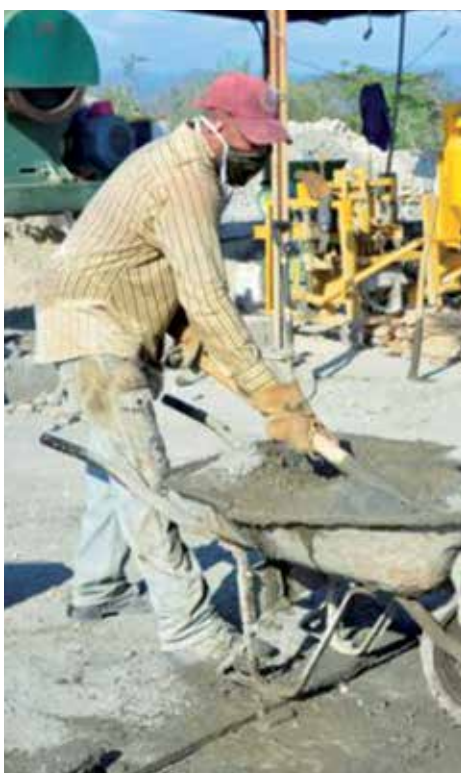
Fortalecer la producción de materiales de la construcción es una meta.

En el año 2020 se reportaron 31 089 actividades culturales. Al cierre de octubre sobresalen las actividades de literatura, música, artes plásticas y otras que se desarrollan a través de las plataformas digitales. Además, se desarrollan actividades culturales con buen impacto en los puntos de vacunación existentes en la provincia.