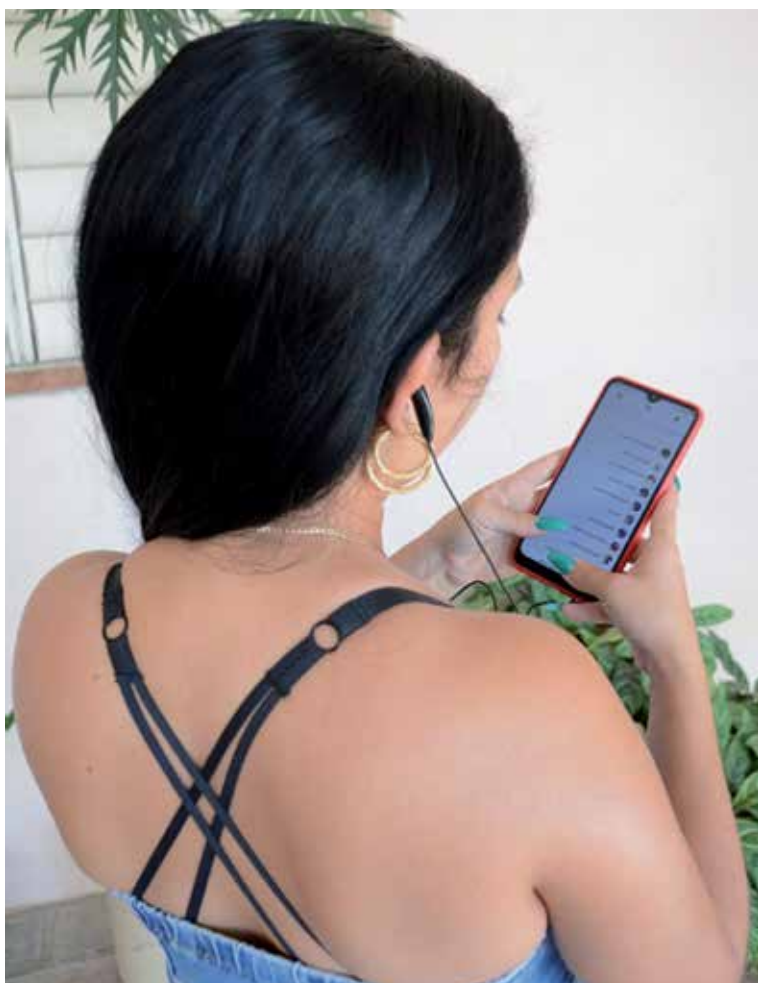
En la ciudad de Sancti Spíritus se concentra el mayor porcentaje de clientes con este servicio.

Este objetivo podría verse favorecido con la nueva promoción de Etecsa, vigente desde el pasado 7 de diciembre y hasta este sábado día 11, que posibilita adquirir una línea por 500 CUP (250 por la activación más 250 de saldo inicial). Disponer de una línea permanente, sin promoción, cuesta 1 000 CUP; de estos, 750 por la activación.