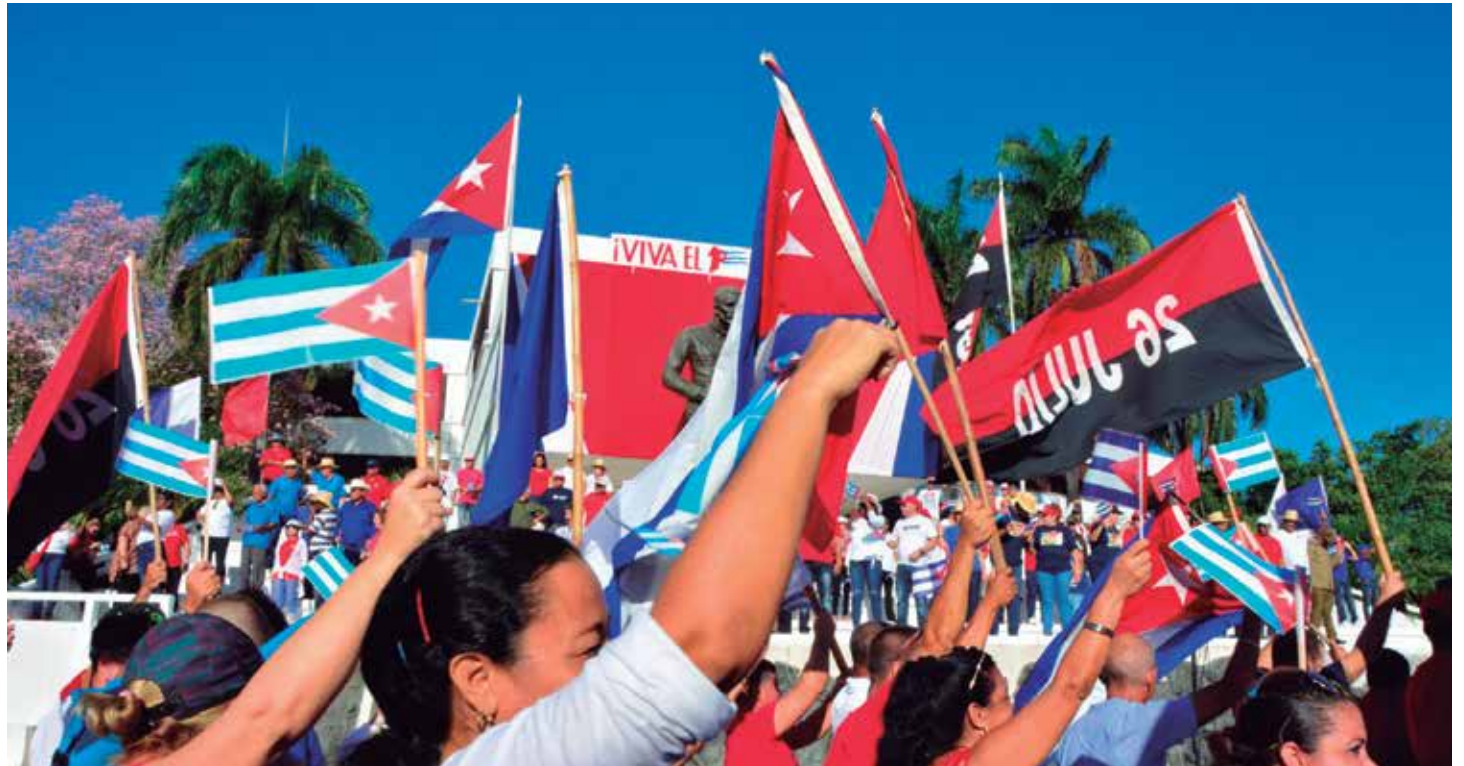
El pueblo espiritano mantiene su fidelidad incondicional a la Revolución.

Generar acercamientos legítimos, desterrar la improvisación, atemperar el diálogo y distinguir las nuevas generaciones como gestores de las transformaciones en marcha