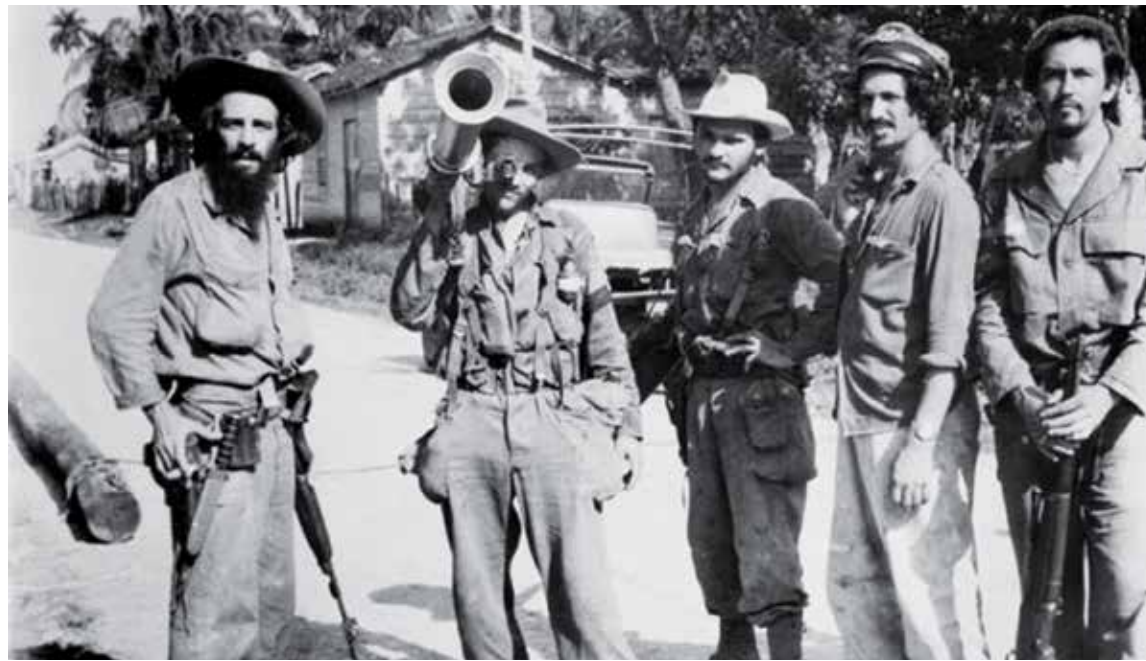
Camilo y un grupo de rebeldes en las cercanías del cuartel de Yaguajay.

se actuó contra los preparativos de las elecciones fraudulentas que organizó el régimen con el propósito de perpetuarse bajo un viso de falsa legitimidad. Pero las tropas del Señor de la Vanguardia no se limitan al entorno yaguajayense, sino que el 24 toman el cuartel de Zulueta, pueblo situado en la carretera Placetas-Caibarién, con balance de cuatro heridos y siete prisioneros y la captura de 13 armas largas, municiones y pertrechos.