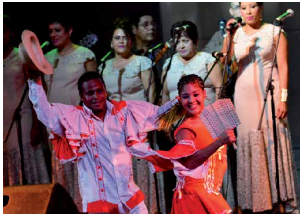
Una representación del talento artístico espirotuano animará la gala.

La gala cultural será en la Plaza de la Revolución Mayor General Serafín Sánchez Valdivia, testigo de importantes sucesos de nuestra historia y que por sus dimensiones puede acoger a un mayor número de personas, siempre cumpliendo los protocolos sanitarios.