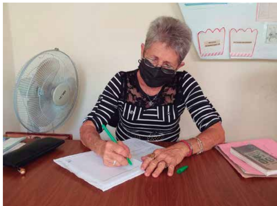
La educadora evoca con orgullo sus días de alfabetizadora.

La combatividad, la ejemplaridad, el espíritu inconforme, la creatividad revolucionaria y la ética de nuestra militancia fortalecerán la capacidad transformadora de nuestra organización como vanguardia política de la sociedad.