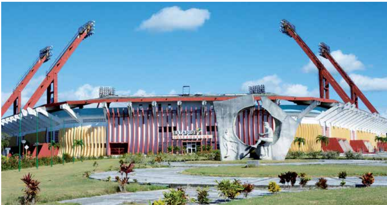
El estadio espiritano ofrecerá espacio a otras formas de gestión y ampliará sus servicios.