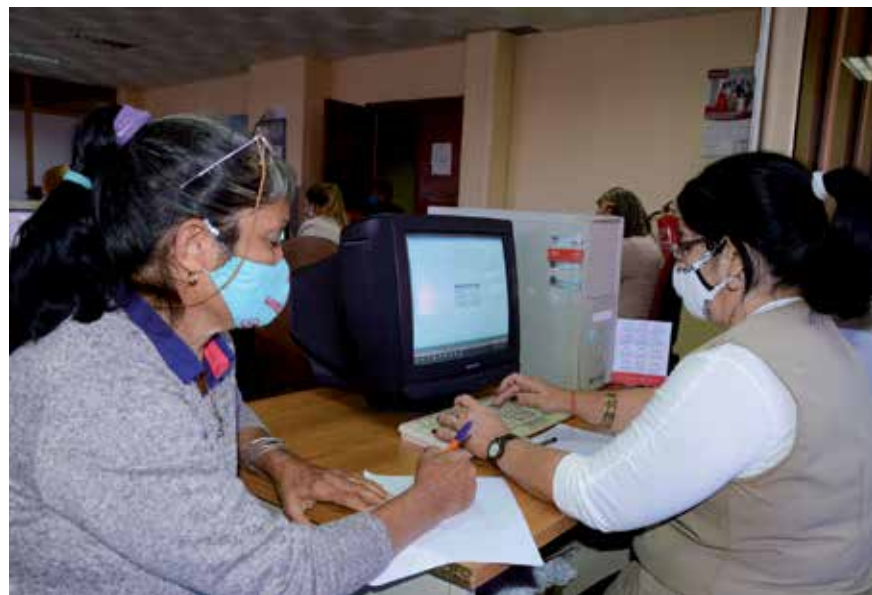
El fondo de fomento agrícola facilita préstamos con mínimas tasas de interés.

Aunque ya queda poca disponibilidad de este fondo, los productores aún pueden adherirse a esta posibilidad, que se mantendrá el próximo año, incluso con