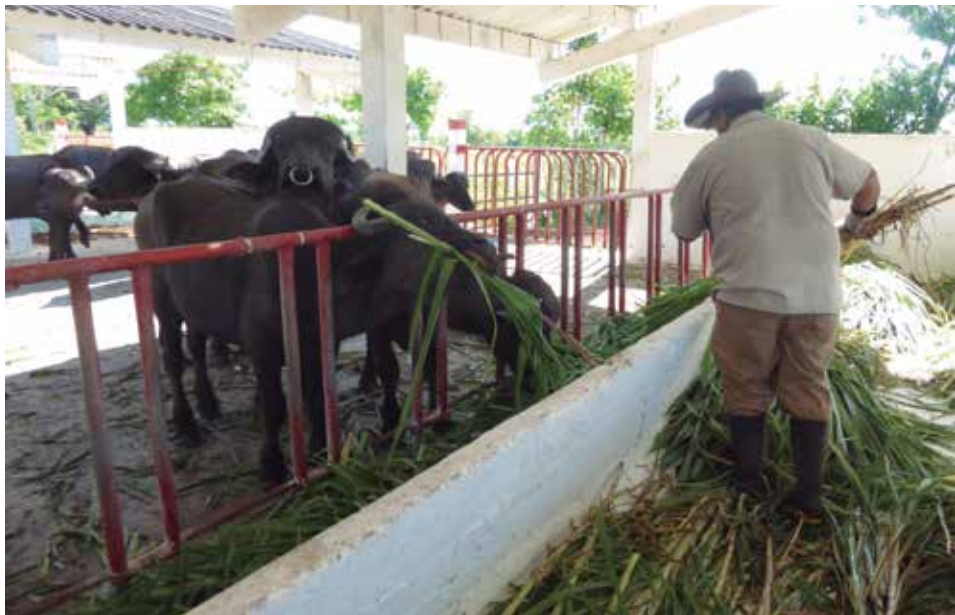
La atención a la ganadería precisa un mayor impulso en el territorio.