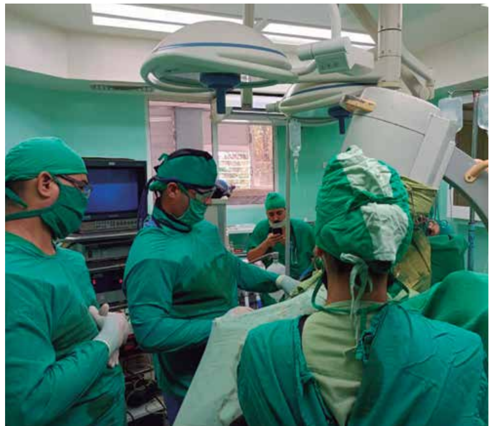
El objetivo es lograr que el mayor porcentaje de los casos pediátricos sea resuelto con abordajes mínimamente invasivos.

El objetivo —aclaró Pérez Sánchez— es lograr que el mayor número de casos sea resuelto con abordajes mínimamente invasivos por los resultados que hoy exhibe la cirugía endourológica en adultos, aplicada en Sancti Spíritus desde el 2015 y con la cual se han beneficiado alrededor de 500 pacientes.