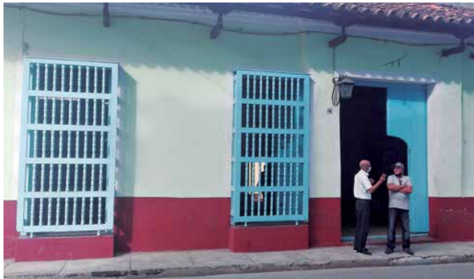
Desde su retorno a la nueva normalidad, la Casa de la Trova Miguel Companioni no ha podido materializar su objeto social.