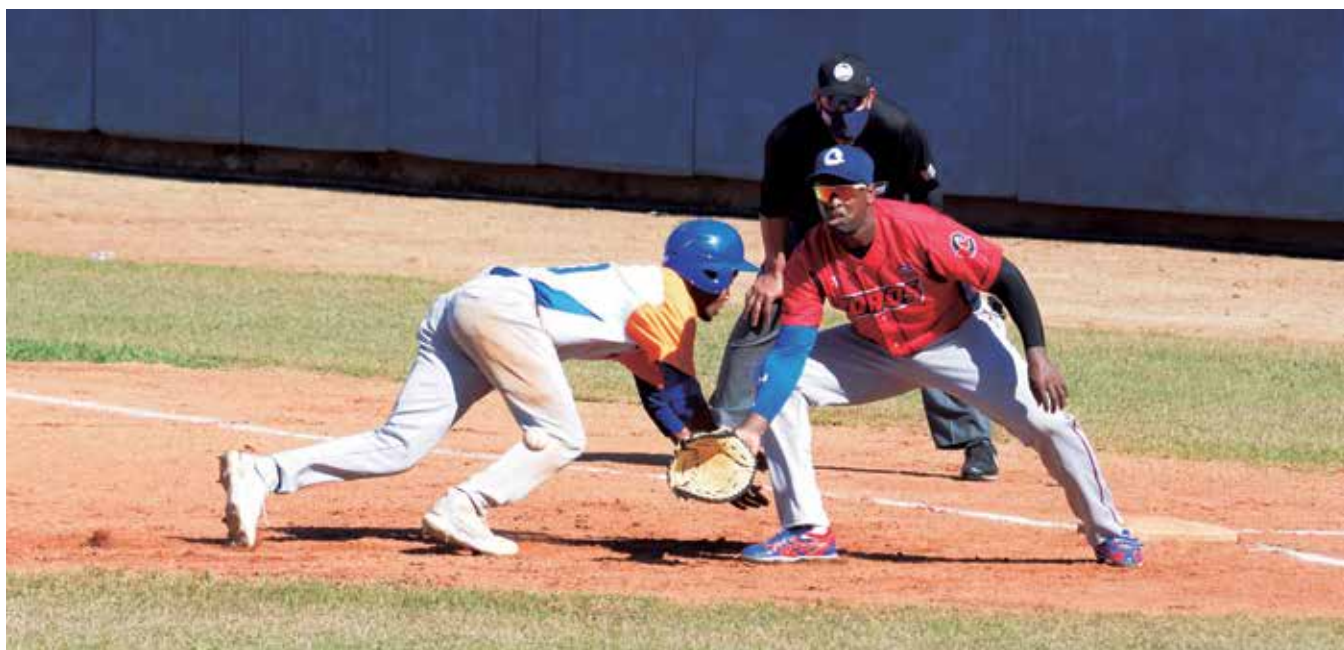
El equipo comenzó con buen ímpetu frente a los Toros de Camagüey.