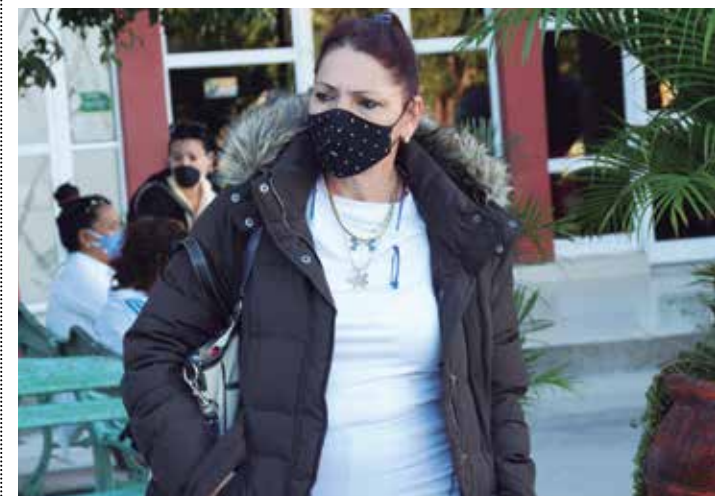
Las temperaturas muy frías casi constituyen una rareza en los inviernos cubanos.

Según los pronósticos, a partir del martes ocurrirá un ascenso gradual de las temperaturas.