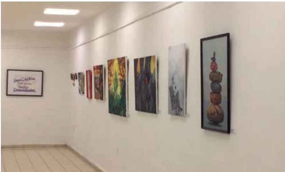
Pocos espirituanos se interesan por mirar las obras y mucho menos por conocer los mecanismos comerciales para su adquisición.

Una sala creada hace varios meses para vender obras de artistas de la plástica espirituana hoy está en franca inactividad comercial