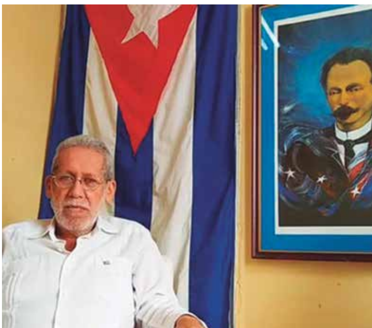
“Martí es un hombre al que hay que acudir todos los días”, destaca Juanelo.

La primera fase del proyecto de audiolibro que reúne a autores espirituanos incluye sonetos para el más universal de los cubanos