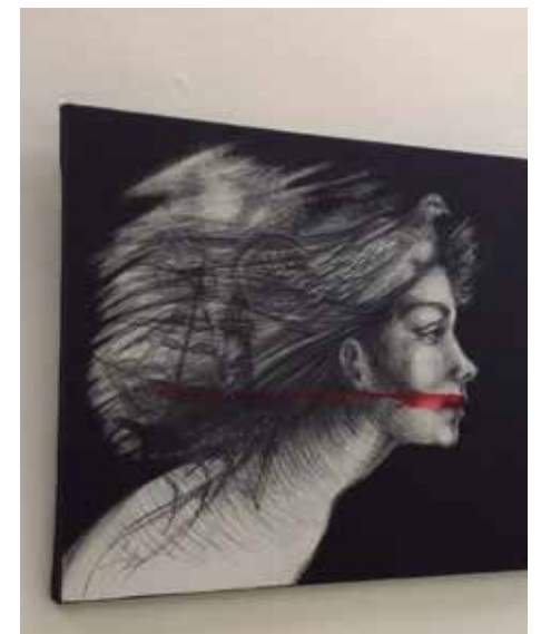
La promoción de las obras de arte sigue siendo una asignatura pendiente.

Reevaluar propuestas, hacer estudios de públicos, ampliar la gestión comercial entre consagrados y noveles, formatos y precios, así como volcarse de forma atractiva a las redes sociales permitirá que la comercialización del arte poco a poco tome cuerpo en Sancti Spíritus. De seguir el conformismo de quienes cumplieron con el anhelo —debatido en cuanto espacio fue posible—, la galería comercializadora seguirá a semejanza de una casa fantasma, donde demasiado silencio asusta.