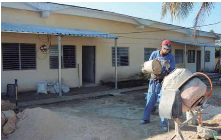
Más de medio centenar de casas se han entregado por la vía estatal con miras a fomentar la natalidad.

Insertado en una política gubernamental, el programa beneficia a madres, padres o tutores legales que tengan bajo su guarda y cuidado a tres o más hijos de hasta 17 años