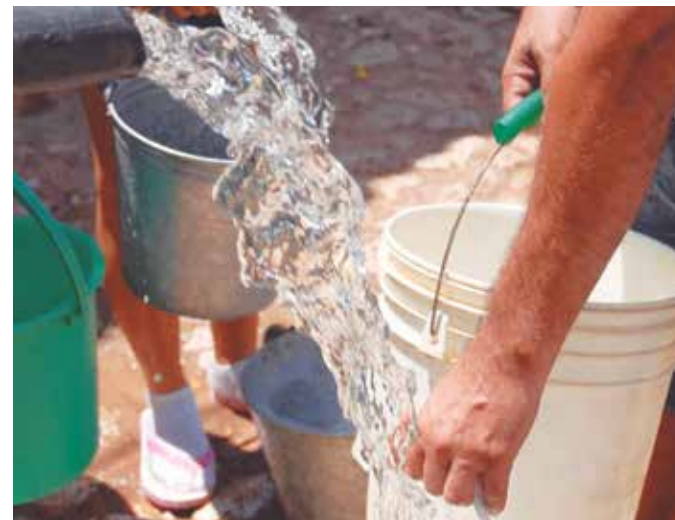
Algunos puntos altos de la ciudad espirituanas reciben actualmente el agua en pipas.

otros lugares altos y puntos terminales de la red en Sancti Spíritus, las cuales se priorizan para el tiro de agua en pipas, que resulta insuficiente debido al déficit de combustible.