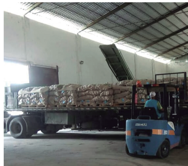
La semilla arribó esta semana a la provincia.

“Es producir la papa por métodos agroecológicos y con destino al autoabastecimiento local; el país siempre ha sostenido la papa bajo sistemas de producción con grandes gastos en insumos, elevado uso de la maquinaria y de agroquímicos, un proceso que genera altas producciones, pero colateralmente ocasiona problemas de compactación, acidificación, salinización y erosión de los suelos, a la vez que ante las limitaciones con estos recursos nos que-