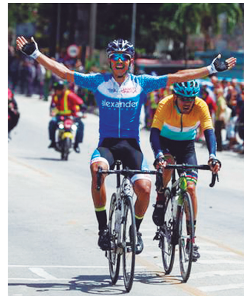
Algunos eventos ya tienen fecha marcada, como el giro ciclisto nacional.

Porque un deportista no se forma en un día —ni en un año—, la proyección debe ir más allá de los eventos importantes del ciclo olímpico que termina en 2024 con los Juegos de París para que se mantenga la esencia de lo que aún constituye una conquista del proyecto revolucionario cubano. (E. R. R.)