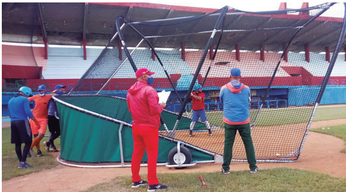
El estadio espiritano ofrecerá espacio a otras formas de gestión y ampliará sus servicios.