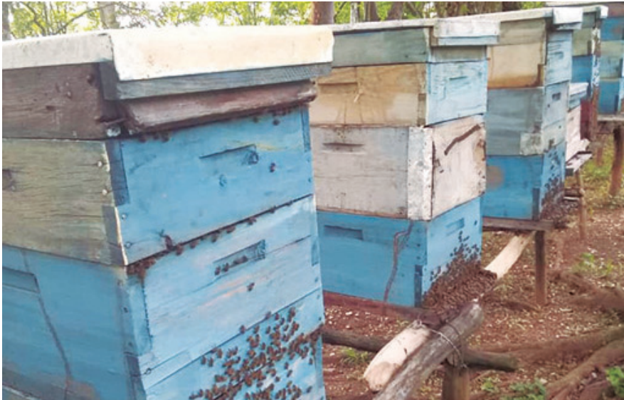
El territorio espirituario superará ampliamente la producción de miel del pasado año.

Además de sobrepasar la producción planificada para el año, la Apicultura en Sancti Spíritus debe conseguir la segunda mayor marca de su historia