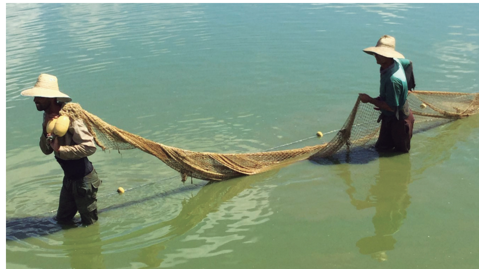
Muchas empresas productoras no alcanzaron los resultados esperados durante el 2021.

El proceso se llevó a cabo para ordenar. Hoy el alza de los precios no solamente es por la TO, han incidido varios factores. El desordenamiento no ha sido producto de lo que se diseñó en la TO. La TO ha traído como resultado ordenar algunas cuestiones que durante los años anteriores se venían haciendo con algunas irregularidades. Lo otro es que dio la posibilidad a nuestro sistema empresarial de implementar 43 nuevas medidas que lo fortalecen, buscando incremento de producciones que garanticen las necesidades del pueblo.