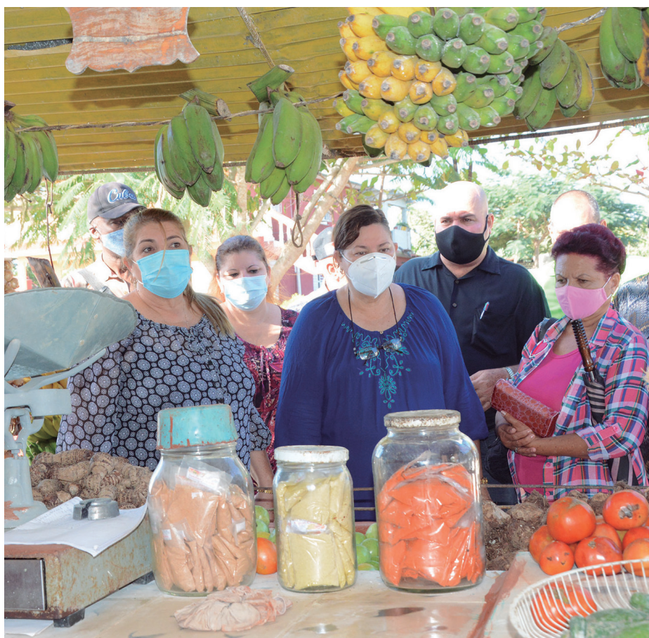
Las máximas autoridades de la provincia recorrieron en Taguasco puntos de venta de la agricultura.