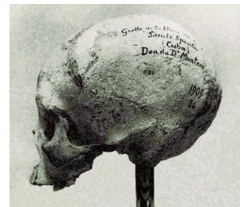
Imagen de uno de los cráneos humanos encontrados en la Cueva del Purial.