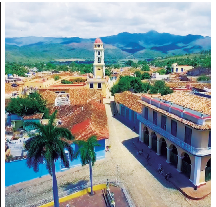
La Ciudad Museo del Caribe recibirá su cumpleaños con una canción y un videoclip que convidan a descubrir sus encantos.

“Él es lo que no pude ser: cineasta. Me he dedicado a la crítica. Su entrega, talento y trabajo me llenan de satisfacción y me confirman que hay una continuidad. Ya rebasé los 70. No sé cuántos años más pueda estar por aquí. Pero estoy feliz porque dejé mi semilla”.