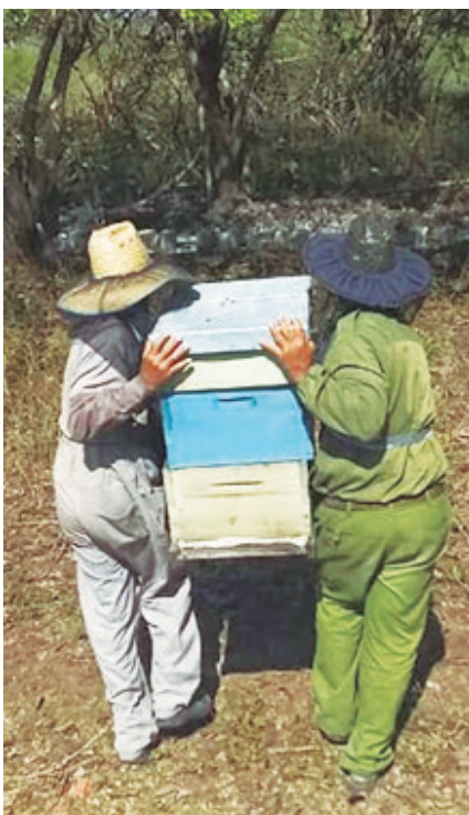
Entre el 40 y el 45 por ciento del total de colmenas se movió hacia lugares con mejores floraciones.

En estos 12 meses de tantos tropiezos y avatares, la Apicultura se puso a tiempo la vacuna del trabajo, actuó como una verdadera colmena que hizo de la trashumancia —movimiento de los apiarios hacia lugares de mejores floraciones— la mejor herramienta a la hora de manejar las dotaciones y convirtió las medidas agropecuarias en un catálogo de oportunidades para revivir la economía y la producción, al punto de superar en cerca de 300