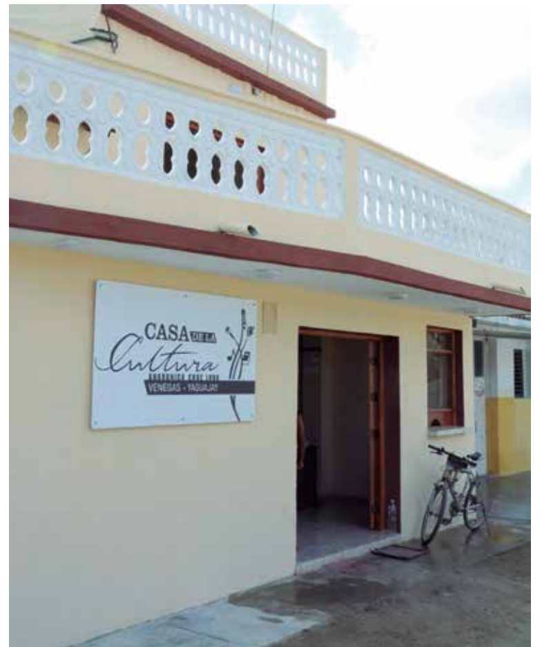
El pueblo de Venegas agradece la transformación de la Casa de Cultura Comunal, que muestra ahora una imagen renovada.

“En cada tregua de la pandemia y antes de que existiera planificamos acciones. Lo hacíamos en la