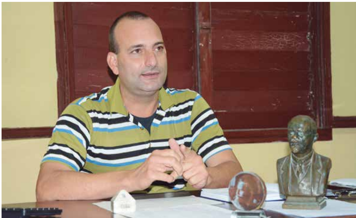
De Jatibonico he aprendido mucho y el vínculo con el pueblo es fundamental.