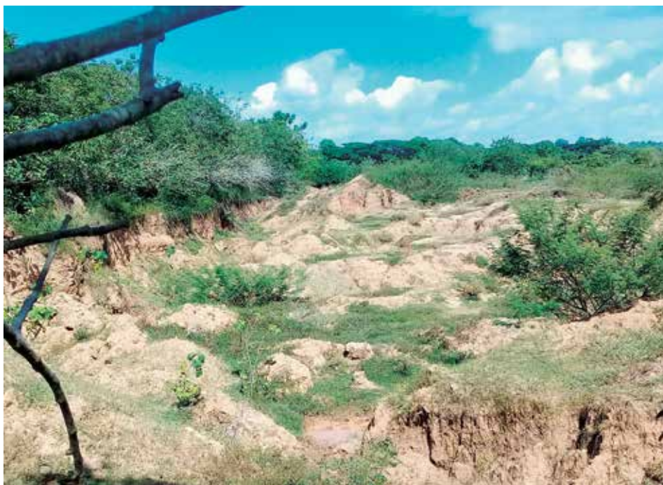
Antes esta finca producía, hoy es un paisaje lunar; también un área entregada en usufructo en una zona aprobada para minería.

Ejemplos hay muchos, Escambray expone dos en aras de ilustrar las diversas lecturas de este proceder. En terrenos donde hoy se asienta la Cooperativa de Producción Agropecuaria (CPA) Ángel Montejo —zona conocida como Camino de las Cañas, en la periferia de Sancti Spíritus— se ha concentrado desde