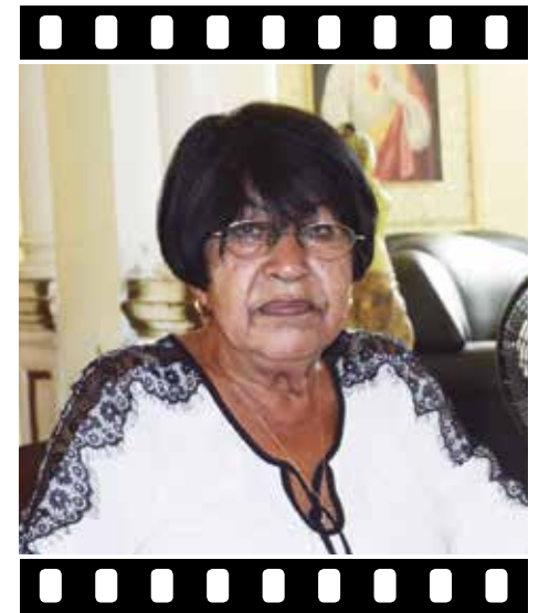
“Aunque me tenga que pasar días y días sin dormir, me gusta que lo que hago tenga resultados”.

Economistas y Contadores de Cuba (ANEC); además de una sistemática participación en conferencias y simposios internacionales, así como publicaciones en revistas y sitios digitales.