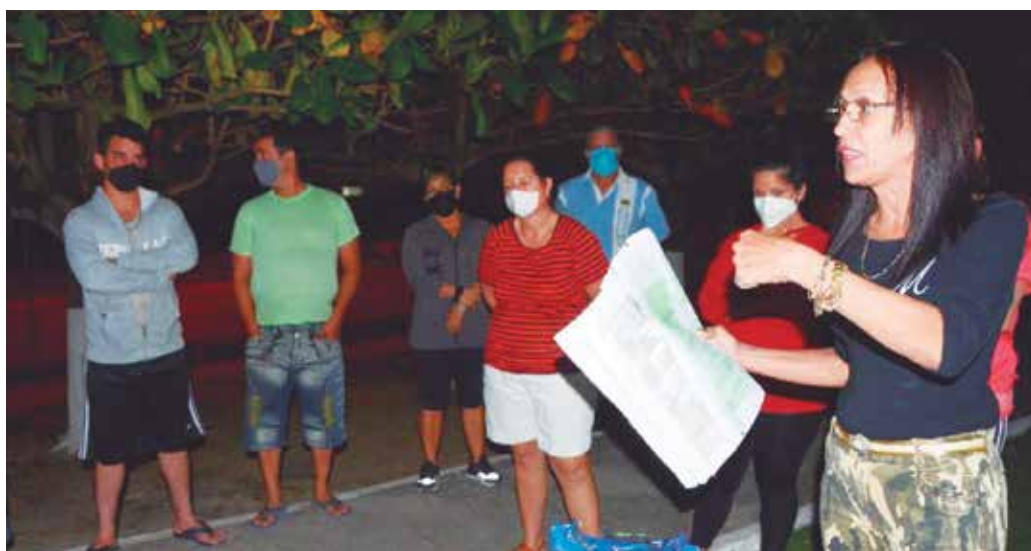
Los vecinos centraron sus planteamientos, fundamentalmente, en los derechos de los niños, las niñas y los adolescentes.