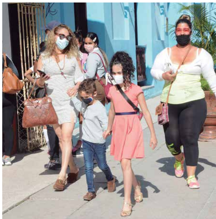
Epidemiólogos del territorio vaticinan un decrecimiento de manera progresiva de los infectados en las venideras jornadas.

Sujeto a ello, habrá que prescribir en los mandatos de la nueva normalidad la suspensión de la anarquía de conductas individuales y colectivas irresponsables; mal que también ha golpeado con fuerza volcánica en estos predios. Es cierto, eso no carga todas las culpas de la covid; pero buena parte de estas, sí.