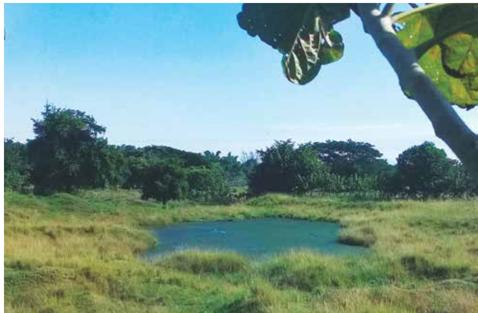
El proyecto de rehabilitación que se aprueba como parte de la concesión minera estipula rellenar los terrenos y no dejar huecos.

“Realmente no ha habido ni se ha logrado un nivel de exigencia para que se restablezca el área —recalca Ríos Orellana—; a los organismos involucrados nos falta integrarnos más y monitorear ese asunto, porque lo cierto es que se ha dado prioridad a la necesidad de la construcción en detrimento de la posibilidad de seguir produciendo alimentos en ese lugar objeto de la concesión minera”.