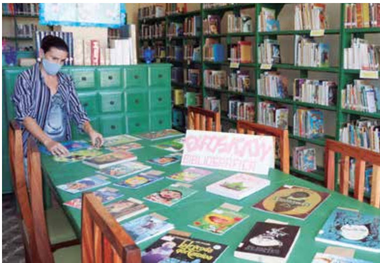
Junto a las labores de reparación llegaron a la Biblioteca Pública 15 estantes, cuatro registros de información y un catálogo.

Venegas hoy es un pueblo con dicha. Posee como ninguna otra localidad —ni siquiera la capital provincial— instituciones culturales con tan buen confort. Por tanto, sobre los hombros de sus colectivos y la comunidad recaen nuevas responsabilidades: no permitir que se les acomoden las huellas del abandono y el descontrol, así como aprovechar las brechas que hoy tiene el sector cultural para no seguir siendo desde la economía un peso excesivo al país y buscar mediante el ingenio que sus servicios sean el alma de la localidad.