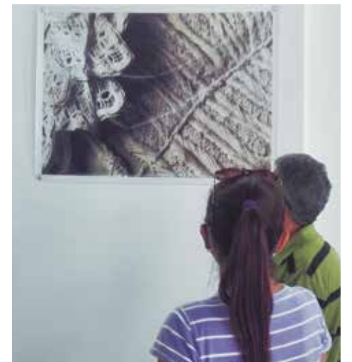
Detalles de obras del proyecto trinitario se disfrutaban en la muestra.

Como ha sucedido en las dos plazas adonde ha llegado esta propuesta, los públicos en cada diálogo con las piezas serán capaces de captar el espíritu propio de nuestra cultura e identidad entrelazados por la maestría de hilos generacionales inmortales en el tiempo. (L. G. G.)