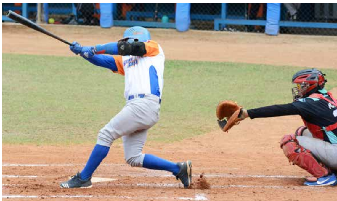
No siempre la producción de hits se traduce luego en carreras.