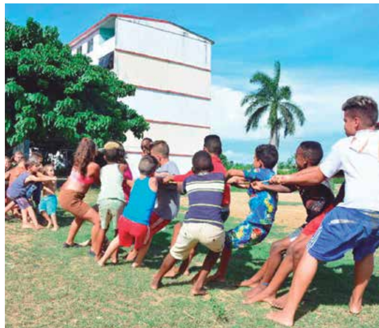
Actividades recreativas en los barrios figuran entre las opciones a propósito de la celebración.

Y en ese maratón podrán vencer aquellos que tengan las mejores reservas en todos los departamentos.