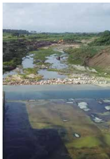
Pese a la sequía, la mayoría de los embalses tiene un llenado favorable.

Más de 105 000 espirituanos sufren actualmente afectaciones en el servicio de agua potable como consecuencia no solo del bajo nivel de las fuentes de abasto debido a la sequía, sino también por la rotura de equipos y otras dificultades tecnológicas.