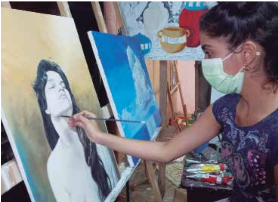
“Puedo tener seis cuadros en elaboración, los voy pintando por tiempo. Me gusta variar, porque a veces me aburro de uno y me voy para otro y así voy acabándolos todos”, asegura.