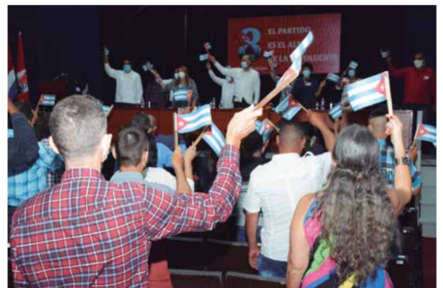
Previo a la cita, se realizó el proceso de balance en las organizaciones de base y luego, a nivel de municipio.

En saludo a dicha asamblea en el territorio tienen lugar numerosas actividades, entre las que sobresalen la realización de trabajos productivos en todos los municipios para incrementar la producción de alimentos, reparación y mantenimiento de varios centros en los diferentes sectores, el incremento de las acciones a favor del programa de reanimación de comunidades, impulsar la producción azucarera, cumplir el plan de siembra de caña previsto para la etapa, terminación de varias viviendas, además de acciones comunitarias y celebración de hechos históricos relevantes, entre otras.