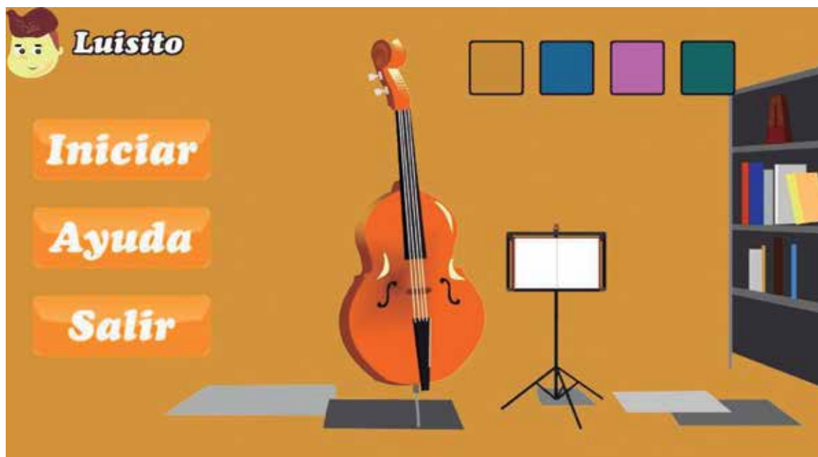
El proyecto prevé de manera didáctica el aprendizaje de este instrumento aplicando la tecnología digital.