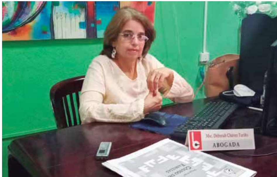
La jurista reconoce que es un Código para cuidar la vida, la salud y el patrimonio.

“No es un secreto que en los niños está viva la autonomía progresiva, a eso contribuye el entorno social, educacional y familiar. Que tengan un criterio no quiere decir que se les permita tomar decisiones equivocadas. Lo que respeta la nueva letra son los deseos