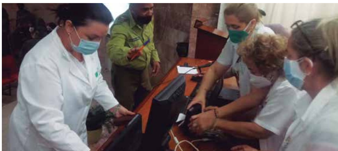
Trabajadores del centro asistencial agradecen la eficaz labor de las autoridades competentes.

Al referirse al refuerzo en la edad pediátrica, Fundora Martín explicó que aún se halla en estudio, por lo que los expertos no han definido todavía cuándo y cómo se llevará a cabo este tipo de vacunación en los infantes.