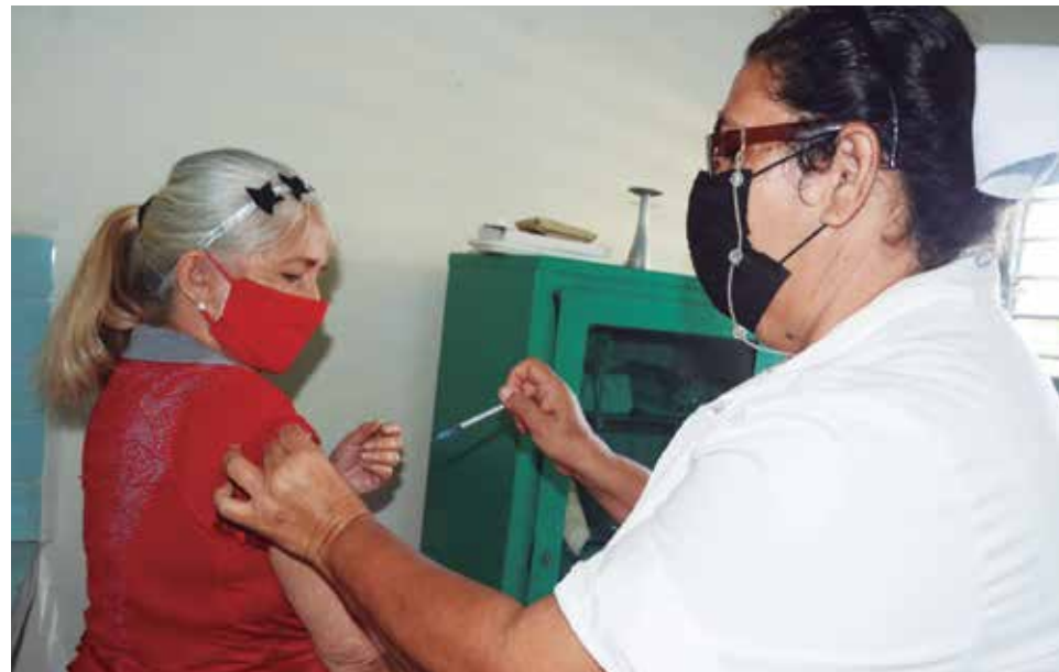
Miles de espirituanos han recibido el esquema completo de inmunización con las vacunas cubanas.