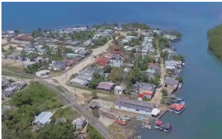
La comunidad de Tunas de Zaza es considerada un punto caliente por la recurrencia de ilegalidades pesqueras.

La Oficina de Regulación y Seguridad Ambiental informó que se impusieron sanciones, realizaron decomisos y establecieron los puntos calientes donde más ilegalidades de este tipo ocurren en la provincia