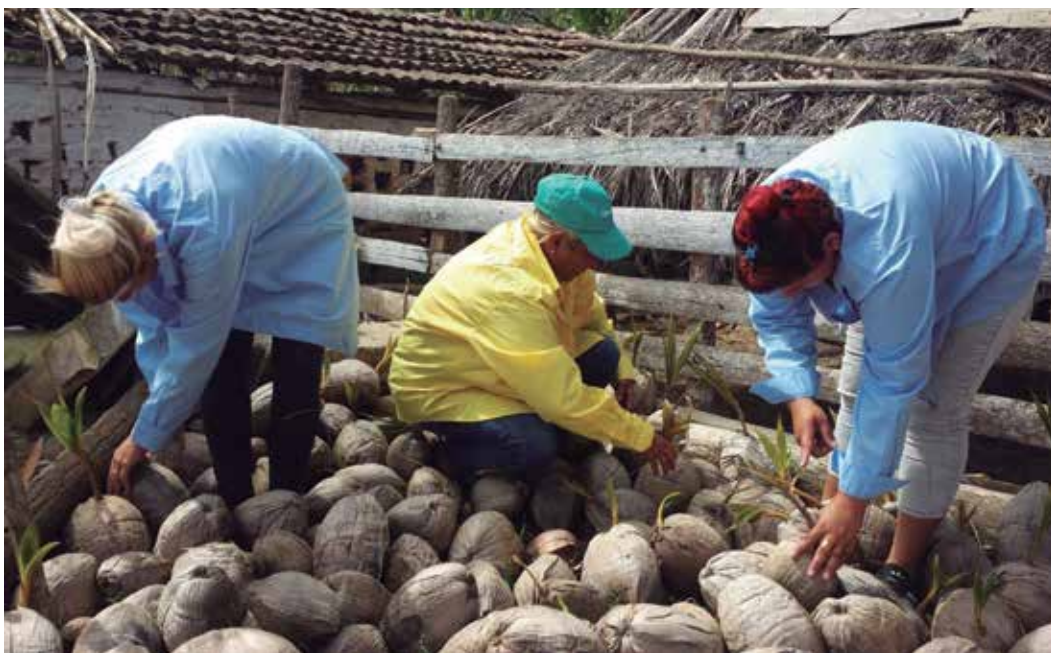
Las mujeres del territorio mantienen un singular protagonismo en la producción de alimentos y otras tareas.