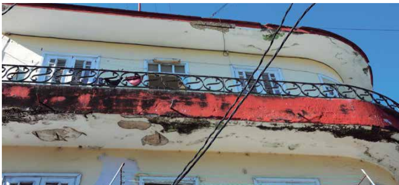
En riesgo inminente de un desprendimiento se encuentran, desde hace años, los balcones de este edificio.