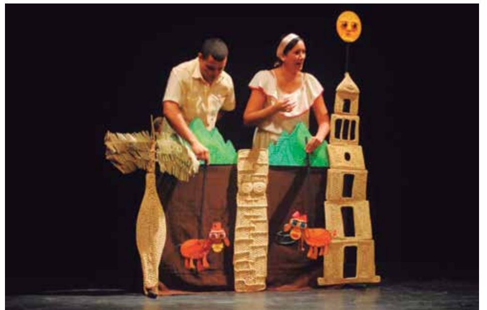
Esta puesta en escena ofrece una gama infinita de posibilidades de interpretación.

“Ahora mismo trabajo en dos poemarios. Uno se titula La forja . Va a ser un poemario con obras en formas clásicas, tradicionales como el soneto, la décima o el verso alejandrino. Tiene como columna vertebral la relación del Adelantado Pablo, personajes de la novela Los pasos perdidos de Alejo Carpentier, con la fundación, asumido desde todas las aristas. Además, laboro en un libro de décimas”.