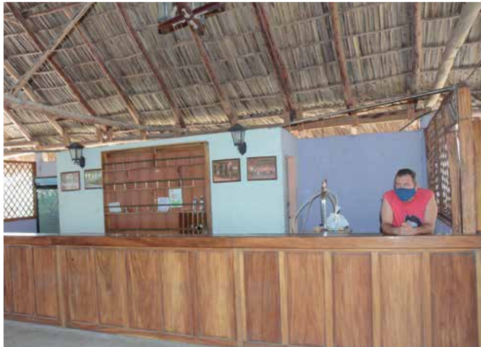
A pesar de que puede realizar compras por autogestión, la unidad El Ranchón de la UEB del Siboney permanece vacía y sin ofertas.

“A ello se une el alza de los precios de todos los productos —continúa Castro Martínez—, el año pasado, por ejemplo, ofertamos el bistec de cerdo a 145 pesos