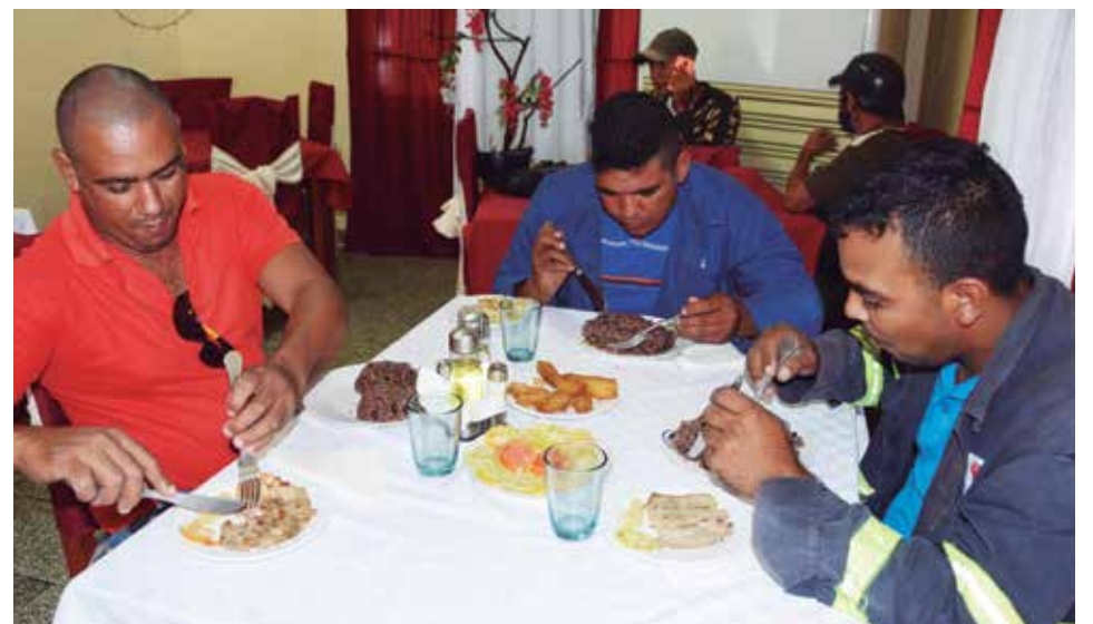
La Gastronomía espirituana depende, en más del 90 por ciento, de los productos procedentes de la autogestión.

Y no se trata de llamados y consignas sin un fundamento sólido, pues la implementación del perfeccionamiento es un hecho que en la mayoría de estas estructuras ha dado frutos, lo cual consta cuando surgieron y debieron probar su valía puertas afuera de los establecimientos a causa de la covid y después que llegó la nueva normalidad y los centros gastronómicos reabrieron para recibir a los clientes. Ejemplos positivos hay, pero mientras la eficiencia no se generalice, la Gastronomía no puede darse por perfeccionada.