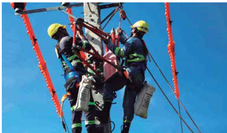
Los estudiantes del centro se preparan para cualquier contingencia.

Tampoco me propuse ser cuadro ni nada de eso, solo he aceptado tareas por la voluntad de servir y ser útil. Cuando me citaron para hablarme de ocupar la responsabilidad de secretaria no puedo decir que de primer momento di un sí; me quedé callada, solo le pregunté a la anterior secretaria: ¿Usted cree que yo pueda asumir ese desempeño con una niña de seis años? Y aquí estoy, por mi compromiso con la Revolución.