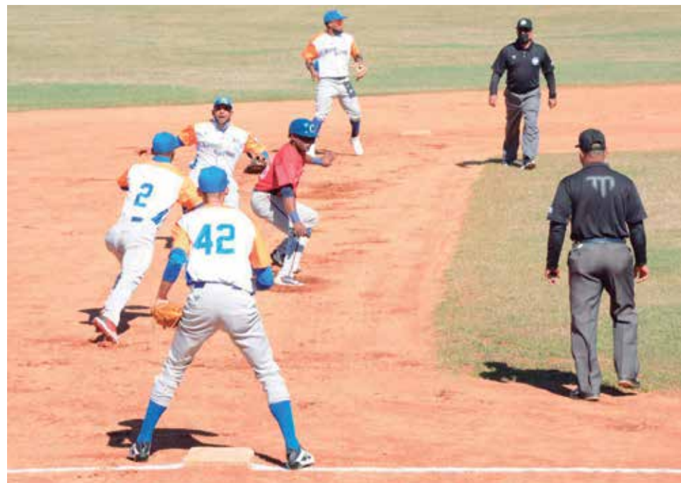
Los Gallos han mantenido un paso estable en lo que va de campaña.