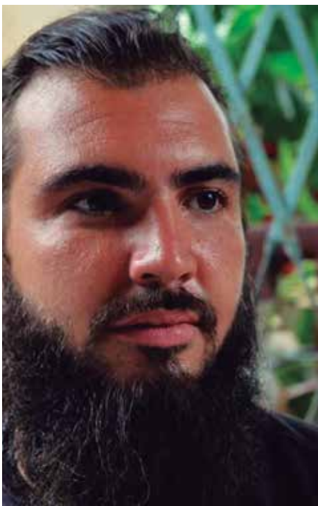
Con el libro Bestia contextual este joven trinitario obtiene su primer lauro en literatura.

“La noticia la recibí con euforia. Soy un poeta inédito. Este es mi primer lauro en