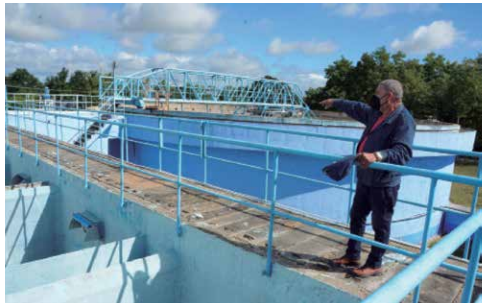
En la Planta Potabilizadora faltan por instalar algunos accesorios y aditamentos.

Así mismo es. La ONAT reconoce la importancia del trabajo por cuenta propia no solo por su repercusión en el presupuesto estatal; sino, también, por los servicios y bienes que genera. Pero, tiene la obligación por ley de velar por que cada contribuyente aporte según los ingresos percibidos, y actuamos en función de eso.