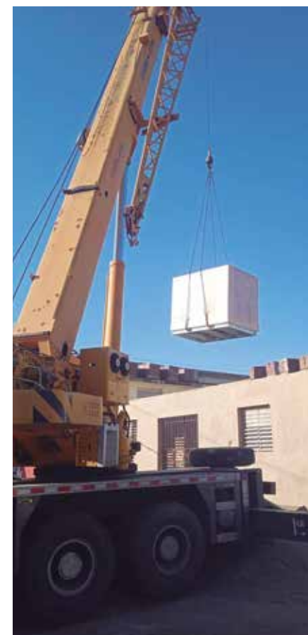
El emplazamiento de la planta en el hospital de Trinidad implicó la construcción de una nave en áreas exteriores.

De acuerdo con una reciente información publicada el pasado 30 de marzo en el periódico Granma , tras un donativo proveniente de la República Bolivariana de Venezuela se prevé la ubicación de modernas plantas procesadoras de oxígeno medicinal, de tecnología china, en más de 40 instituciones hospitalarias de Cuba.