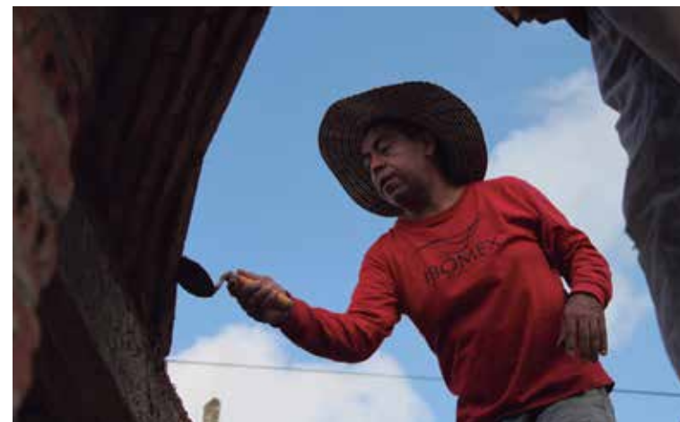
La comunidad trinitaria de San Pedro se convirtió por estos días en un laboratorio a cielo abierto.

urbe y de la muestra Tierranza , del artista Isarel Rondón, promotor también de varios talleres de plástica y utilización de pigmentos naturales a los que se insertaron niños de la comunidad de San Pedro.