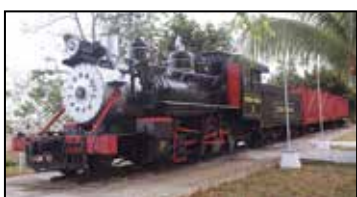
En perfecto estado se conserva la locomotora ubicada en el Complejo Histórico Comandante Camilo Cienfuegos.