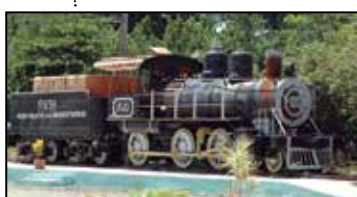
Otro de esos medios se resguarda en el central FNTA.