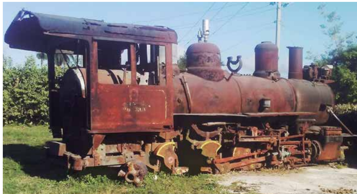
La locomotora fue construida en 1917 por Baldwin Locomotive Works, en Filadelfia, Estados Unidos.

De acuerdo con documentos históricos, por sus kilómetros de