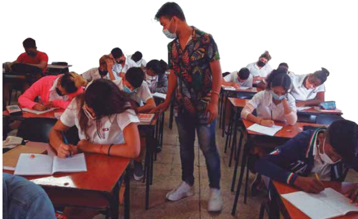
El maestro es esencial en la formación integral de las nuevas generaciones.

Por mis raíces —dice con absoluta convicción—. Mi familia es de revolucionarios; en particular mis tías, también educadoras, tuvieron una gran influencia sobre mí, debatíamos mucho sobre temas históricos en la casa y en la escuela. Hay hechos muy interesantes que pueden contextualizarse en los momentos actuales. Eso te permite como profesor trabajar los valores, el amor a la Patria. No debemos ol-