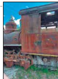
La locomotora que permanecía hasta hace algún tiempo en el central Uruguay ya no existe.