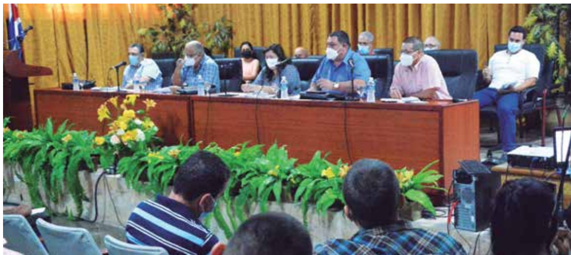
Entre los temas abordados figuró la entrega de tierra y semillas para producir alimentos.