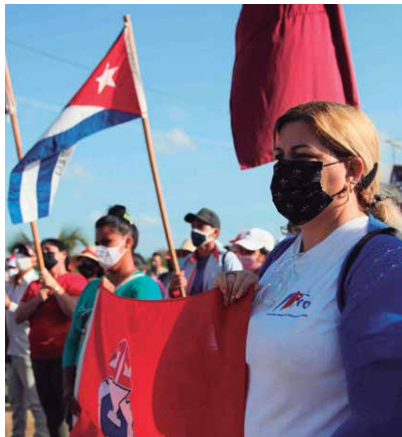
En el contexto de la celebración, los jóvenes del territorio desarrollan jornadas de trabajo productivo y otras iniciativas.