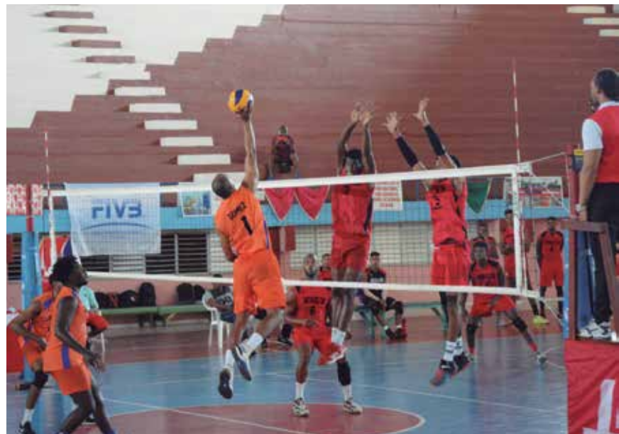
Mucha sangre joven se ha visto en esta ocasión sobre el tabloncillo.

Con medallas en eventos anteriores, los espirituarios al no contar con sus figuras principales, unos por contratos y otros por lesiones, terminaron en el último lugar de la clasificatoria con solo siete puntos, una victoria, seis reveses, siete sets a favor y 20 en contra. (E. R. R.)