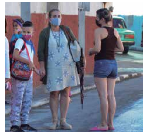
Pese a la disminución de la tasa de incidencia en los últimos días, el peligro no ha pasado.

De tanto andar cuqueando el virus deberíamos haber aprendido la lección: los números bajan, pero la covid persiste.