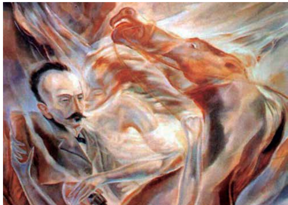
La muerte del Apóstol reflejada por el pintor cubano Carlos Enríquez.