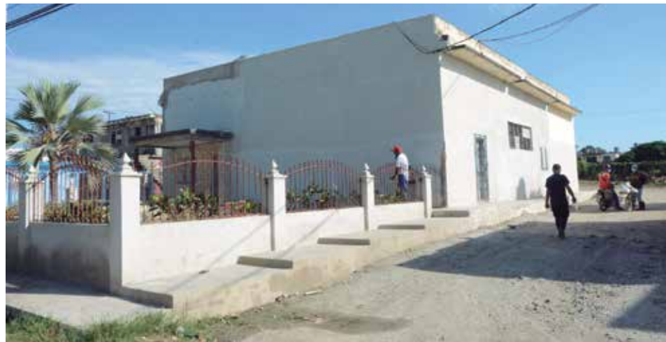
La panadería del Camino de La Habana fue completamente remodelada.

A la hora del recuento suman decenas los planteamientos resueltos como parte del movimiento transformador que se vive en la Zona de Desarrollo del Camino de La Habana, obras de índole social que aliviarán el día a día de quienes viven en ese barrio espirituario, gente que necesita de atención, pero también ha estado oxigenada a través de los años con beneficios que cambiaron para siempre la imagen de aquella tierra de lodo y polvo.