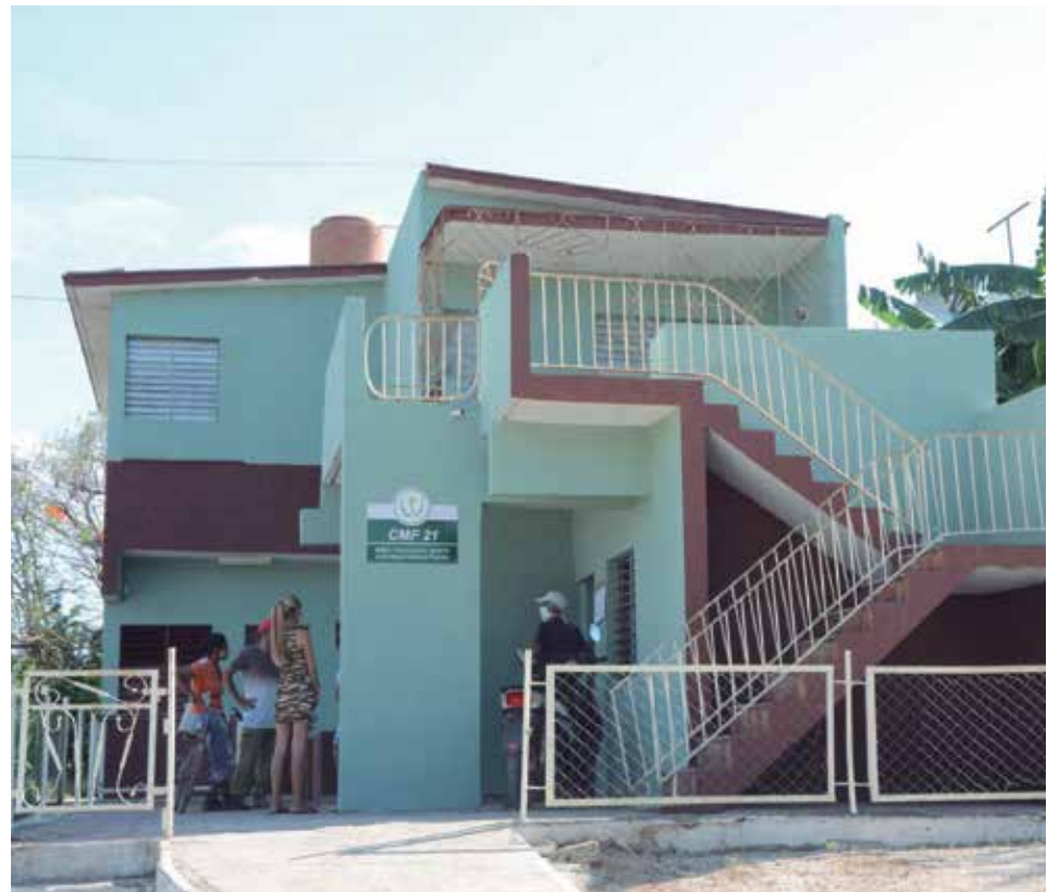
Quedaron totalmente rehabilitados los tres consultorios del médico de la familia enclavados en esa zona.