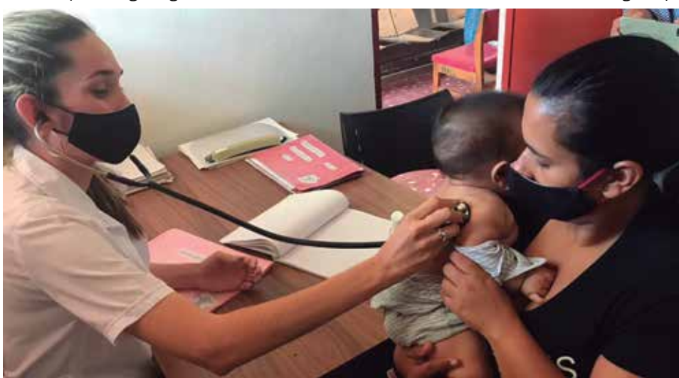
Ante cualquier sospecha, se recomienda evaluar las características clínicas de la enfermedad, descartar otros virus que causan hepatitis y realizar exámenes complementarios.

Es una enfermedad infecciosa, por lo que se puede evitar el contagio. Hay que conocer bien su vía de transmisión, para tomar las medidas precisas y evitar enfermarse. Se sugieren las mismas medidas de la covid por ser, posiblemente, la vía de contagio por contacto y respiratoria: el lavado de manos frecuente, cubrirse la boca al toser y estornudar, así como evitar el hacinamiento, mantener el distanciamiento físico y la correcta higiene de los alimentos.