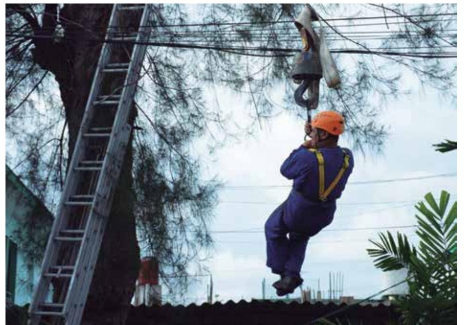
Las actividades del domingo incluirán acciones prácticas como la poda de árboles.

Como parte de las jornadas desarrolladas esta semana, resultaron positivos los talleres efectuados en comunidades vulnerables como Casilda, en Trinidad, y Vitoria, en Yaguajay, eventos que posibilitaron elevar la preparación de sus habitantes para enfrentar desastres, sobre todo de origen natural como los ciclones tropicales acompañados de fuertes vientos e intensas lluvias y penetraciones del mar.