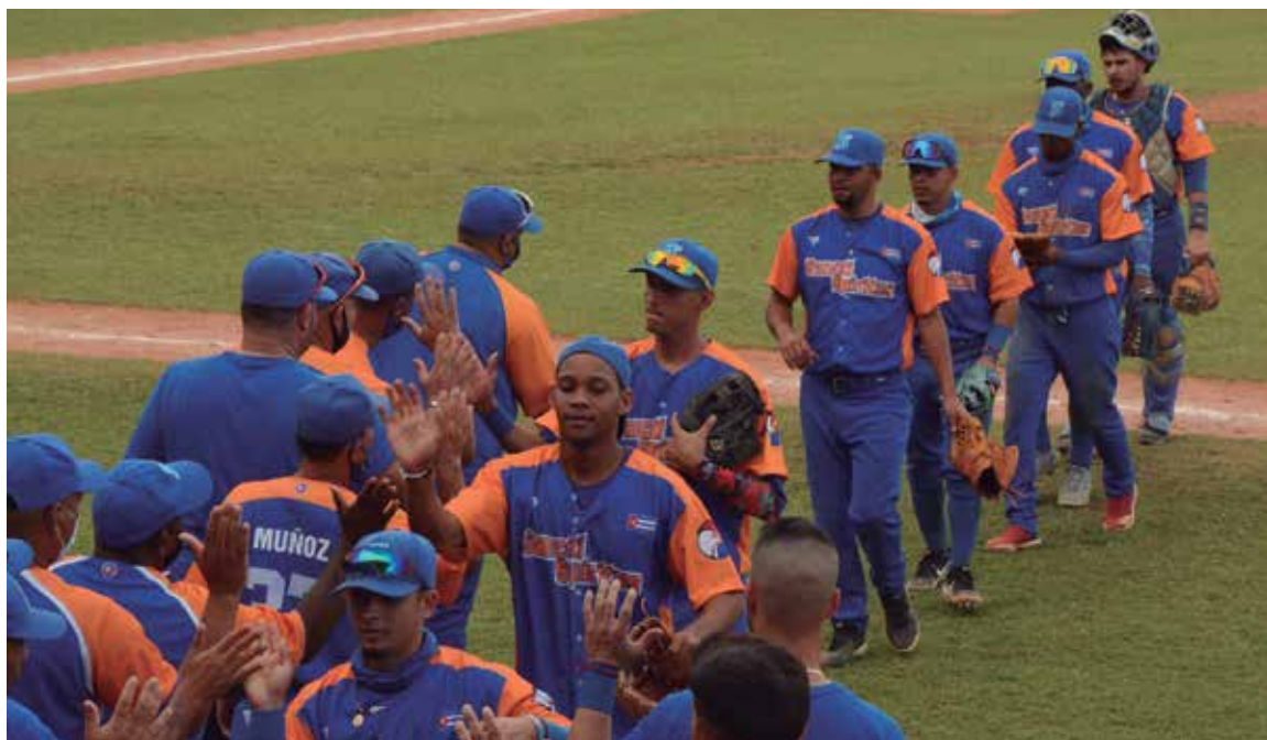
A partir de ahora comienza una no menos compleja travesía para el equipo.