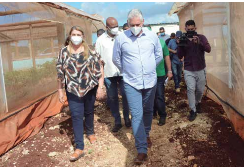
El Partido prioriza dos frentes de trabajo: el económico y el ideológico, asegura.

Por cierto, ¿usted considera que ha faltado sistematicidad en el combate a los acaparadores?