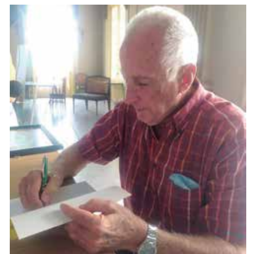
El Premio Nacional de Ciencias Sociales y Humanísticas y de Historia compartió con el público yayabero.

“He tenido alumnos de aquí que han mantenido una prolongada relación conmigo, primero como estudiantes, después en maestrías y ahora en el doctorado. Las direcciones de la universidad de la provincia, del Centro Provincial del Libro y de Cultura fueron las primeras en invitarme. No creí mucho algo que me habían comentado, pero ahora he constatado el carácter tan cultural de esta ciudad, de su población y de cómo asimila todos estos valores que enaltecen el espíritu”.