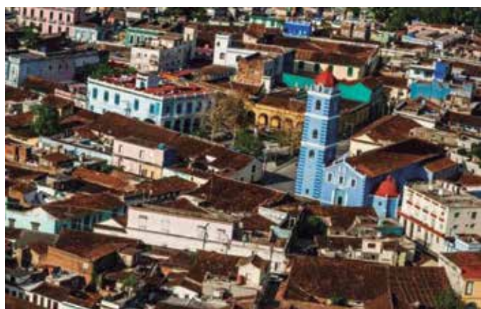
La villa del Yayabo celebrará el 4 de junio su cumpleaños 508.

En relación con la covid, el CIGB espiritano también ha estudiado recientemente el comportamiento en las mujeres embarazadas y lactantes de anticuerpos neutralizantes al virus en la leche materna.