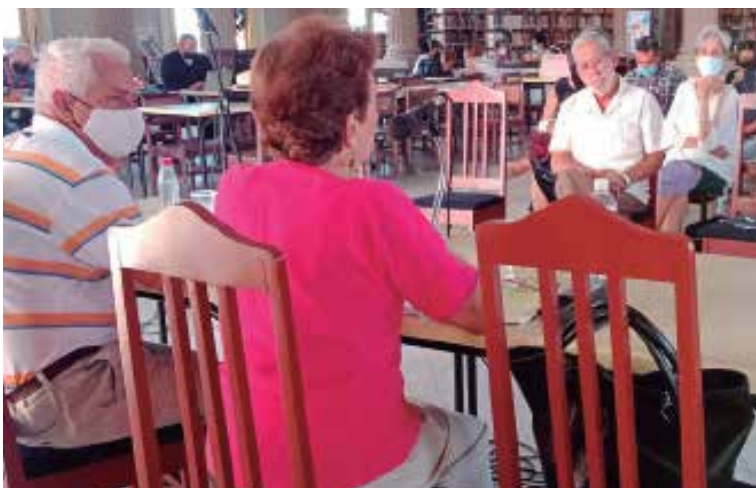
Participantes de cinco provincias se dieron cita en Sancti Spíritus.