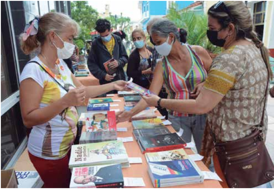
Alrededor de 400 títulos están a disposición de los lectores.