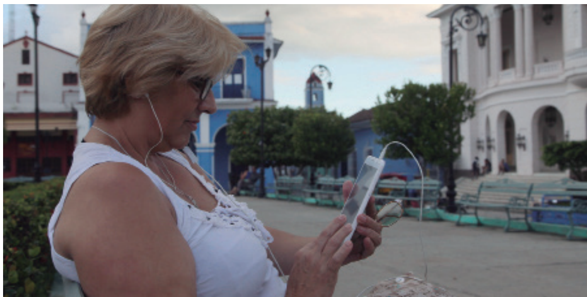
Sancti Spíritus ha mejorado su infraestructura durante los últimos años para ampliar el acceso a la red.

Como sucede con el resto de Cuba, la mayoría de los espirituanos ingresa al ciberespacio a través de celulares y, en menor cuantía, mediante computadoras.