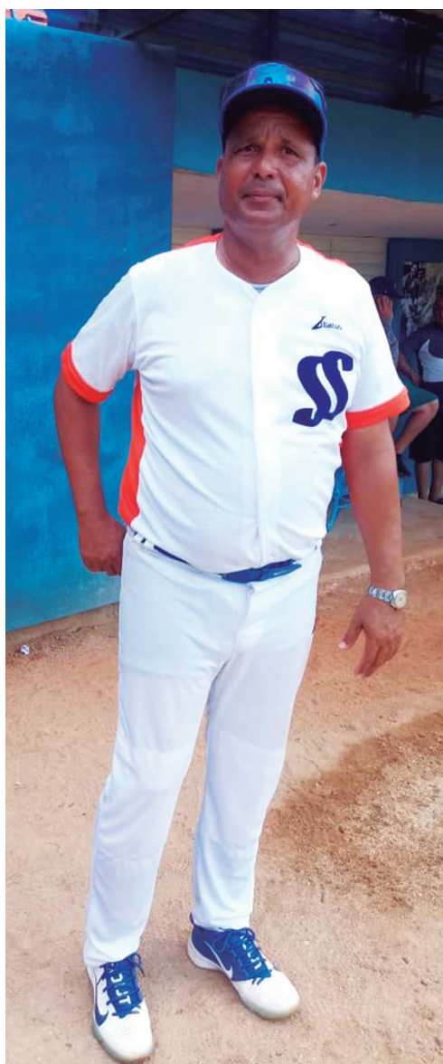
“Nunca vamos a estar conformes”, confiesa el mánager del Sub-23 espirituario.