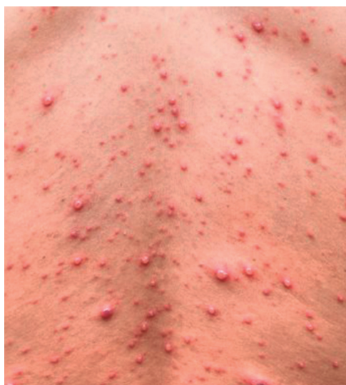
La erupción cutánea es un rasgo característico de esta enfermedad.

Dirija su correspondencia a: Periódico Escambray. Sección “Cartas de los lectores”. Adolfo del Castillo No. 10 e/. Tello Sánchez y Ave. de los Mártires. S. Spíritus Correo electrónico: correspondencia@escambray.cip.cu