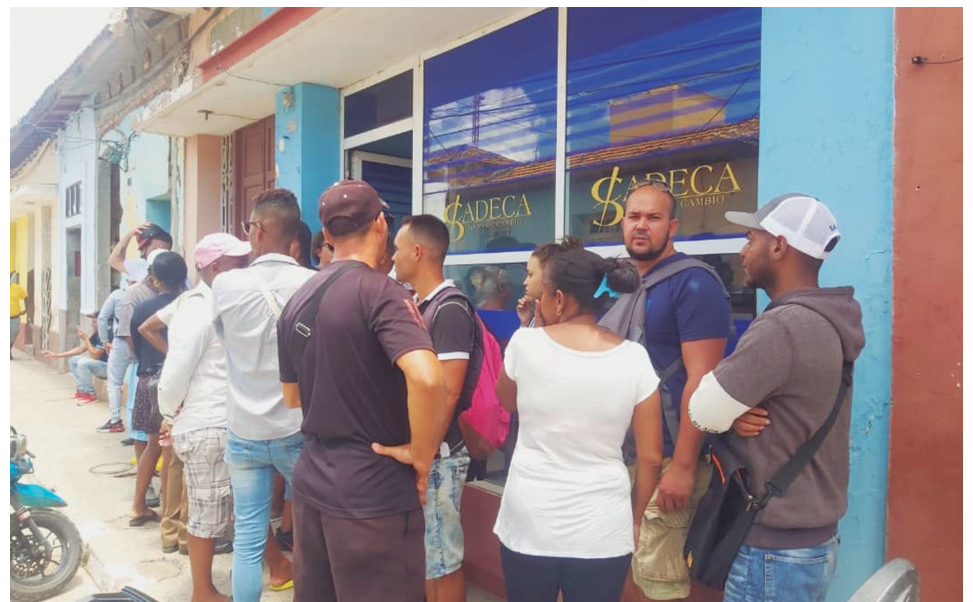
La mayoría de los espirotanos agradece la compraventa de divisas por el Estado.

En medio de todo ello, resulta cardinal estabilizar el tipo de cambio, espina dorsal de cualquier economía, por ser el precio de la divisa, cuestión clave del mercado cambiario, el cual garantiza el acceso legal a las divisas; transparencia y seguridad saludadas por la mayoría de los espirotanos.