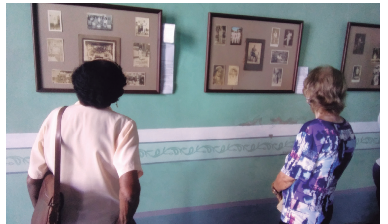
La exposición permanecerá durante un mes en la galería Espacio gráfico del Centro Provincial de Patrimonio.

Bodas, bautizos, cumpleaños, ceremonias religiosas... son los temas que más revelan las postales de diferentes tamaños y, en su