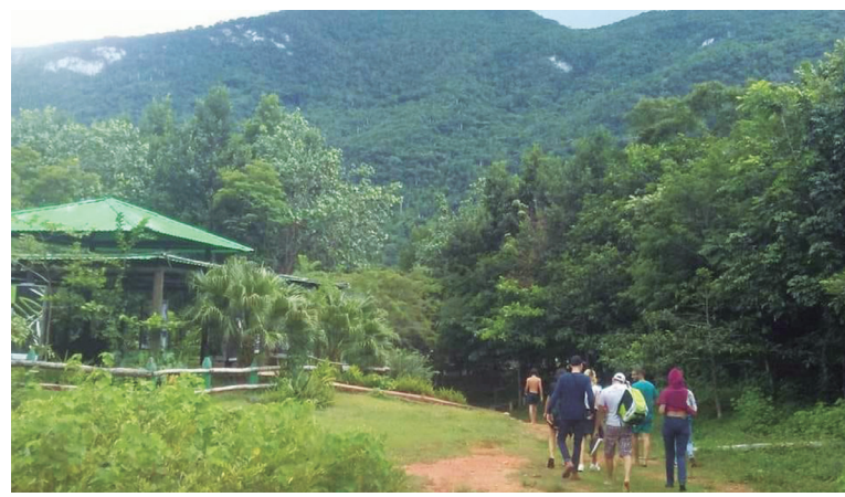
Los jóvenes disfrutaron de las riquezas naturales de la provincia.

El campamento de verano, luego de dos años sin poder realizarse por la fuerte presencia de la covid, volvió a demostrar que es una opción diferente en Sancti Spíritus para el goce pleno de jornadas donde coexisten la recreación y acciones de impacto para el beneficio colectivo.