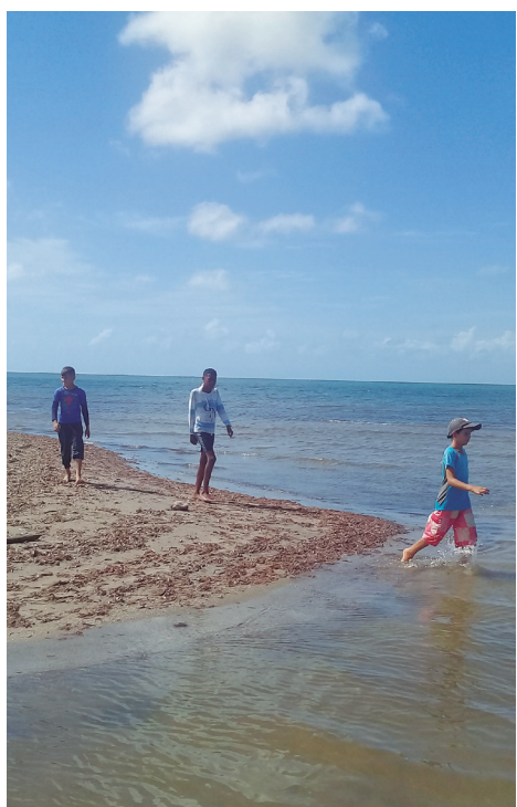
Desde comunidades cercanas llegan jóvenes a disfrutar de la playa este verano.