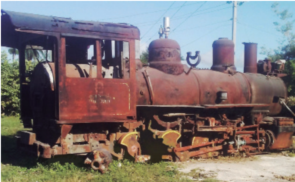
La locomotora pasó sus últimos días en la base de ómnibus de Jatibonico.