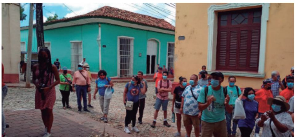
Durante los meses de julio y agosto se incrementa la presencia de turistas, especialmente en la ciudad de Trinidad.

Durante la etapa se han ejecutado mejoras en las habitaciones y servicios, además de la reanimación de la jardinería de la planta hotelera y áreas de playa. “Trabajamos de cara a la próxima temporada alta en la que se esperan resultados favorables a partir de la incorporación y estabilidad de los vuelos procedentes de Europa, con lo que se podrán sumar nuevas opciones y circuitos a las operaciones turísticas”, acotó Ferrer Espinosa.