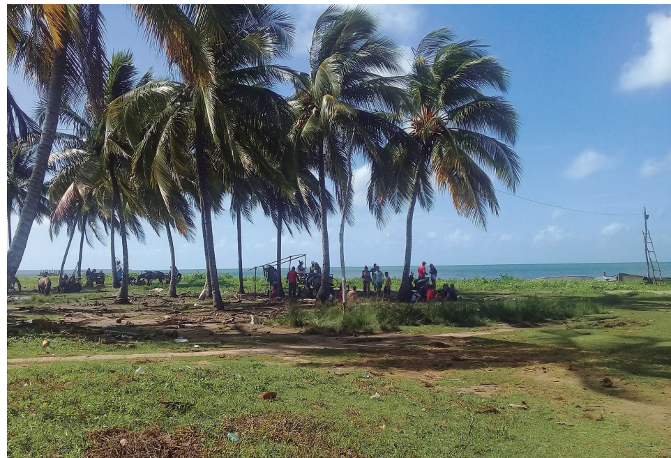
Con más de un kilómetro de área de baño, la playa no se explota en todas sus potencialidades.