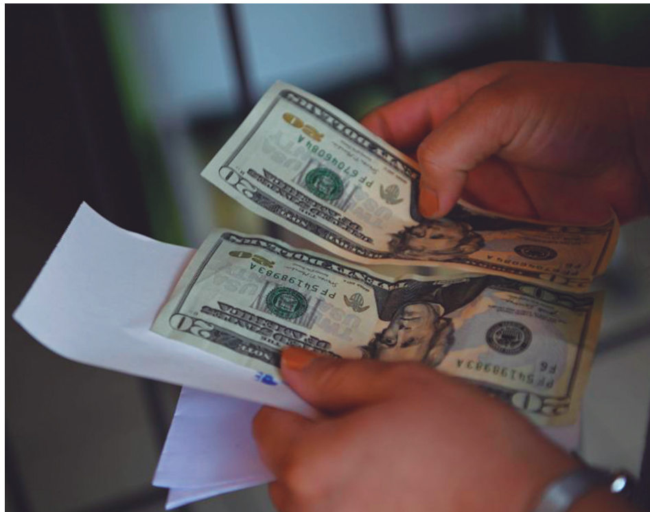
En el mercado informal se mueven cantidades significativas de divisas.

Como afirmó la dirección del BCC días atrás, las oficinas de Cadeca S. A. y con posterioridad los bancos, cuando estos se