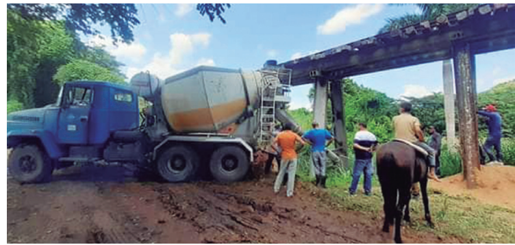
En el puente Vicentica concluyeron recientemente las labores de fundición de los nuevos apoyos metálicos.

“En este ramal no se ha dejado de trabajar, pero no está completa