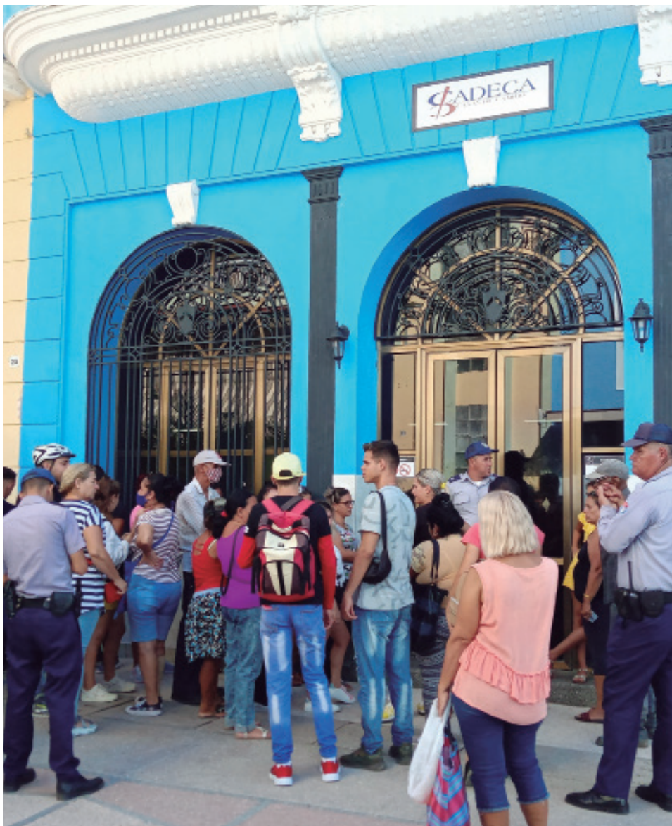
La medida generó gran expectativa en la población espirituanana.