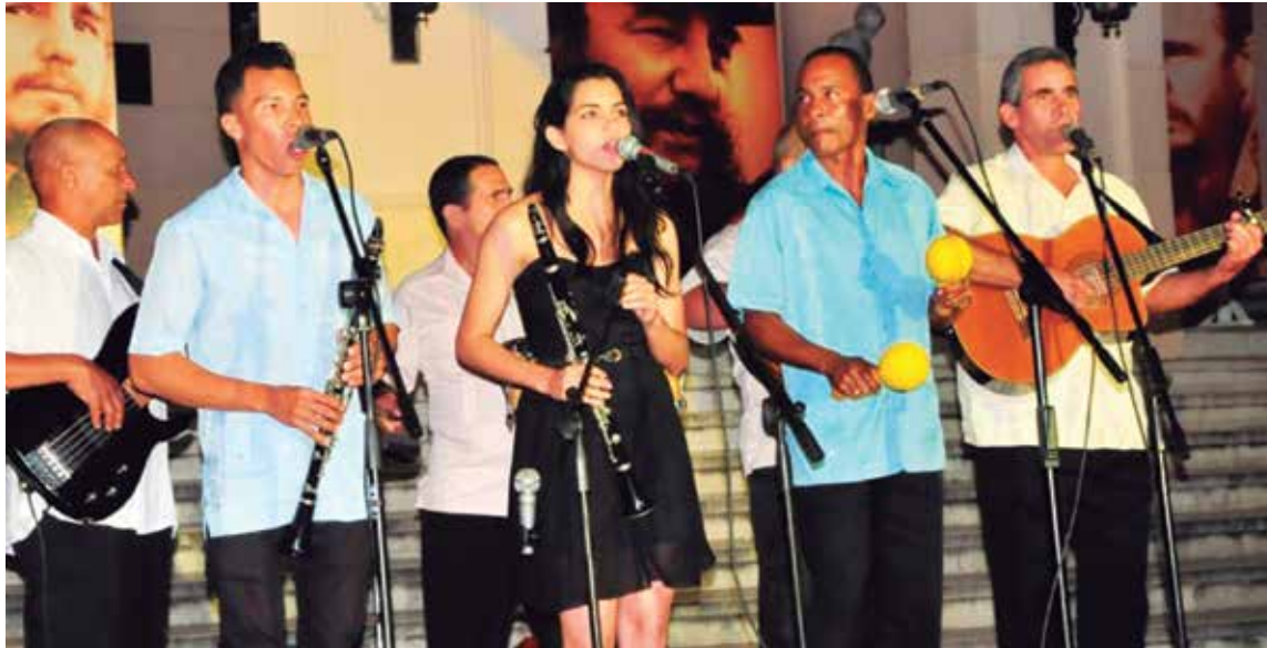
La falta de comercialización de las agrupaciones espiritvanas dio la estocada final a la empresa.

La actual situación de la empresa no es causa, sino consecuencia. Desde el 2011, cuando se pasó de Centro Provincial de la Música y los Espectáculos a empresa y el