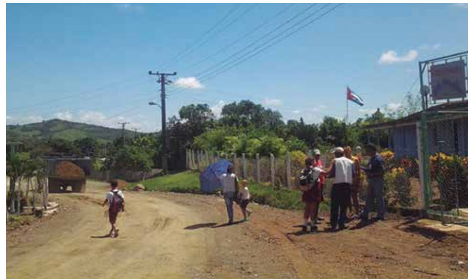
Vista del asentamiento desde la escuela Juan Abrantes.

La palabra sopimpa produjo derivados en su tiempo, aunque es probable que fueran creaciones ocasionales. En la edición del 19 de agosto de 1855, el diario santiaguero El Redactor discurre, en tono humorístico, sobre la sopimpitis , «una afección de carácter esencialmente nervioso, que ataca con frecuencia los plexos de toda la columna vertebral, y los tendones de los músculos, desde la región de los lomos, hasta el mismo tendón de Aquiles». Por otra parte, La sopimperera tituló el sevillano Isidoro Hernández (1847-1888) una de sus habaneras publicadas en 1871. El estribillo decía así: «Sopimperera soy tenaz, / la sopimpa es mi placer, / y aunque no quiera bailar, / tienen vértigo mis pies». Y El Sopimperero —afirma Ramón María de Araíztegui en Votos de un español — se llamó una «hoja política republicana», fechada el 16 de enero de 1869, que, como La Sopimpa y otros impresos que circularon gracias a la brevísima libertad de imprenta concedida ese mes por el capitán general Domingo Dulce, tenía un notorio carácter anticolonial.