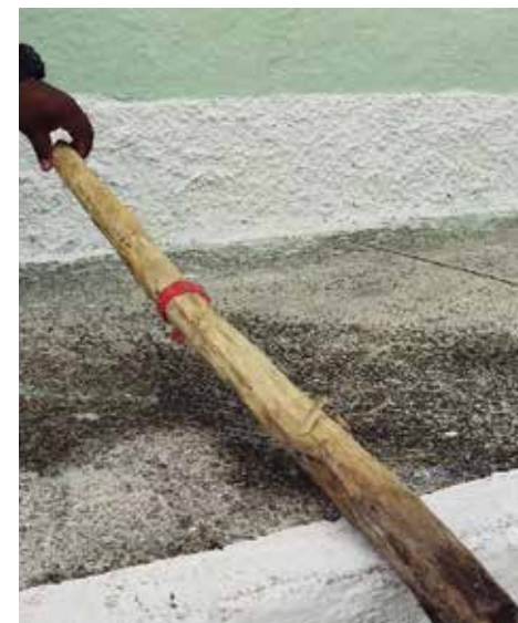
Objetos contundentes que funcionaron como armas homicidas.

gracias a lo cual se logró establecer el modus operandi utilizado por los mismos para darle muerte al ciudadano de 62 años.