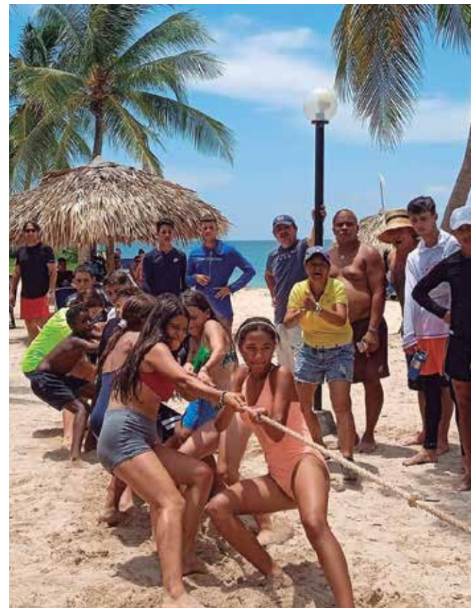
Varios proyectos diseñados para la etapa estival han tenido una favorable acogida.