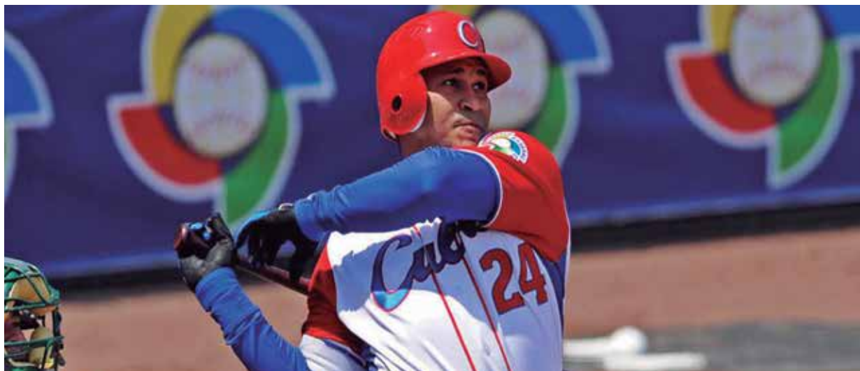
La MLB ha incluido a Cepeda en el dream team de todos los tiempos.