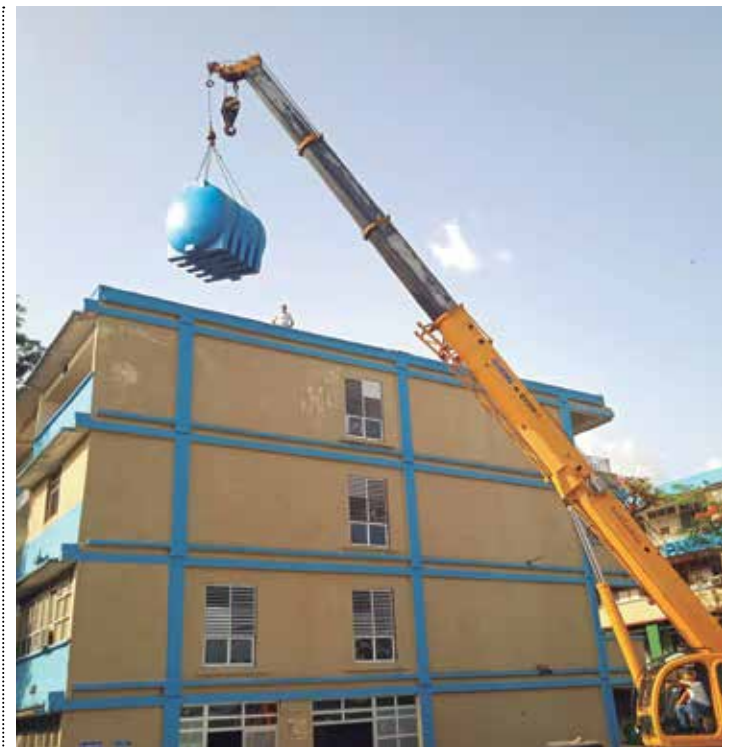
En el hospital se garantiza servicio de agua a la sala de Neonatología las 24 horas.

En los más de 4 kilómetros de arena blanca y fina sorprende la limpieza de toda la zona, donde esta vez no nadan los sargazos gracias a la constancia de las brigadas de la sucursal Emprestur. Pero los restos de comida y envases de todo tipo flotan en las aguas azul turquesa. El contraste duele. A todos nos toca cuidar este prodigio natural que invita a darse un chapuzón en verano.