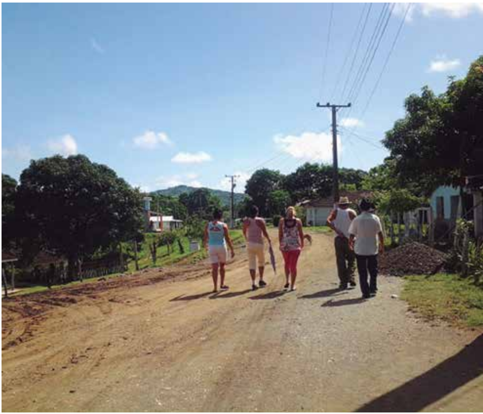
La comunidad de Sopimpa es la cabecera de uno de los consejos populares de Fomento.

La adjudicación de falsas etimologías a las palabras, incluidos los nombres geográficos, resulta un fenómeno corriente en la práctica comunicativa. Corresponde a la investigación científica la búsqueda y el restablecimiento de la verdad objetiva