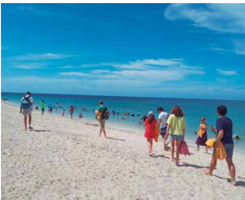
Playa Ancón, en la costa sur de Trinidad, cautiva por sus arenas blancas y el mar de color azul turquesa.

En la misma medida se han realizado acciones de reparación en más de 40 consultorios del médico de la familia en toda la provincia, en su mayoría ubicados en barrios considerados vulnerables, junto a otros objetos de obra como el mantenimiento de algunas de las salas en el Hospital Provincial.