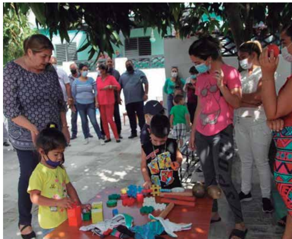
En el poblado espirituario de Banao, la Casa Infantil garantiza el cuidado de alrededor de 40 niños de madres trabajadoras.

Los amantes de las mascotas agradecen la transformación a que fue sometida la Clínica Veterinaria Provincial, a la cual se le modificó toda la estructura con la perspectiva de convertirla en un complejo asistencial para animales, el cual, si bien actualmente brinda prestaciones de cirugía mayor y menor, inyecciones, análisis clínico, varios tratamientos y consultas a domicilio, tiene proyectos para adquirir equipamiento moderno, competir con la venta de vacunas y productos, además de ofrecer charlas educativas sobre el cuidado de las mascotas.