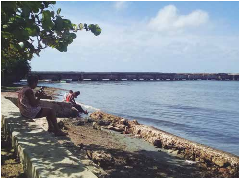
Sin ciclones ni intensas lluvias, Tunas de Zaza respira aire de mar y tranquilidad.

“Podemos decir que ahora hay mayor sabiduría y preparación de la Defensa Civil, las autoridades y la población para realizar la evacuación preventiva —señaló Pizat Santander—. La experiencia del ciclón Irma no la olvidaremos; había criterios divididos de si se evacuaba o no, algunos hasta decían: ‘¿Por qué, si viene por el norte, si aquí el agua que caiga nos la tomamos?’’. Pues se protegió a tiempo la población y los bienes en un almacén que se construyó con ese fin en un lugar alto; ha sido para mí el que más daño e inundación ha causado en Tunas de Zaza y El Médano”.