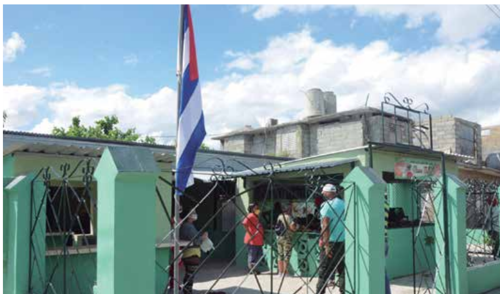
En la comunidad espiritana de Agramonte se realizaron varias acciones para su transformación.