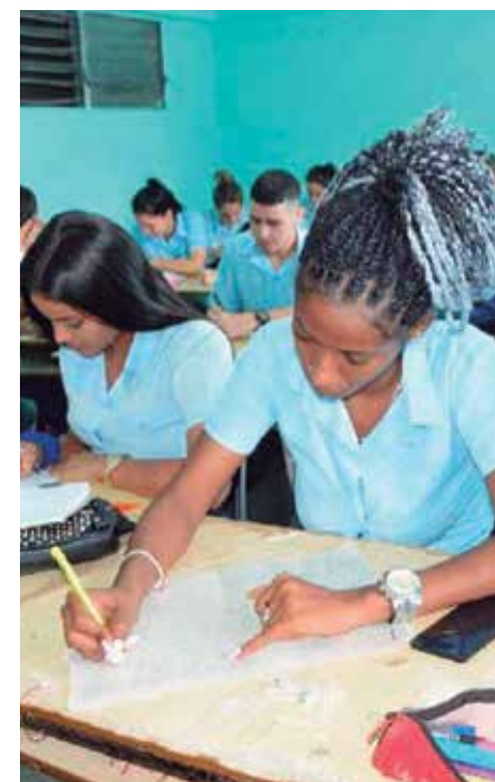
Los estudiantes de duodécimo grado han tenido una intensa preparación de cara a los exámenes.

La jefa de la Enseñanza Preuniversitaria en Sancti Spiritus señaló que la provincia se esfuerza por mantener los favorables resultados alcanzados en dichas pruebas y, de esta forma, posicionarse como en años anteriores entre los cuatro primeros territorios del país.