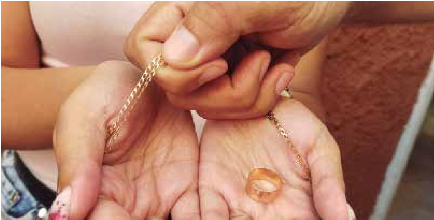
La estafas relacionadas con joyas resultan usuales en territorio espirituario.

Aunque muchos hablen de supuestos robos con violencia ocurridos en el bulevar de la ciudad de Sancti Spíritus, son las estafas el tipo de delito que predomina en este concurrido lugar