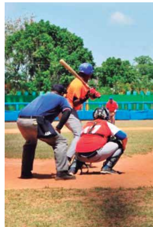
El calendario prevé doble juegos los sábados y sencillo los domingos.

Por disposiciones de la Comisión Provincial, cada colectivo debe incorporar en su alineación regular al menos un pelotero de la categoría menores de 23 años y los lanzadores tendrán el mismo reglamento que se aplica en la Serie Nacional. (E. R. R.)