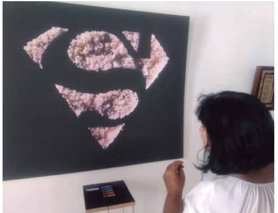
La instalación interactiva Temperamentum fue una de las tres piezas que le aseguraron el Premio del XXXV Salón Oscar Fernández Morera.

Quiero concentrarme en la serie Deadly fork y seguiré con El peso de la vida , que es ilimitada porque son con objetos cotidianos y los problemas que también están ahí a flor de piel.