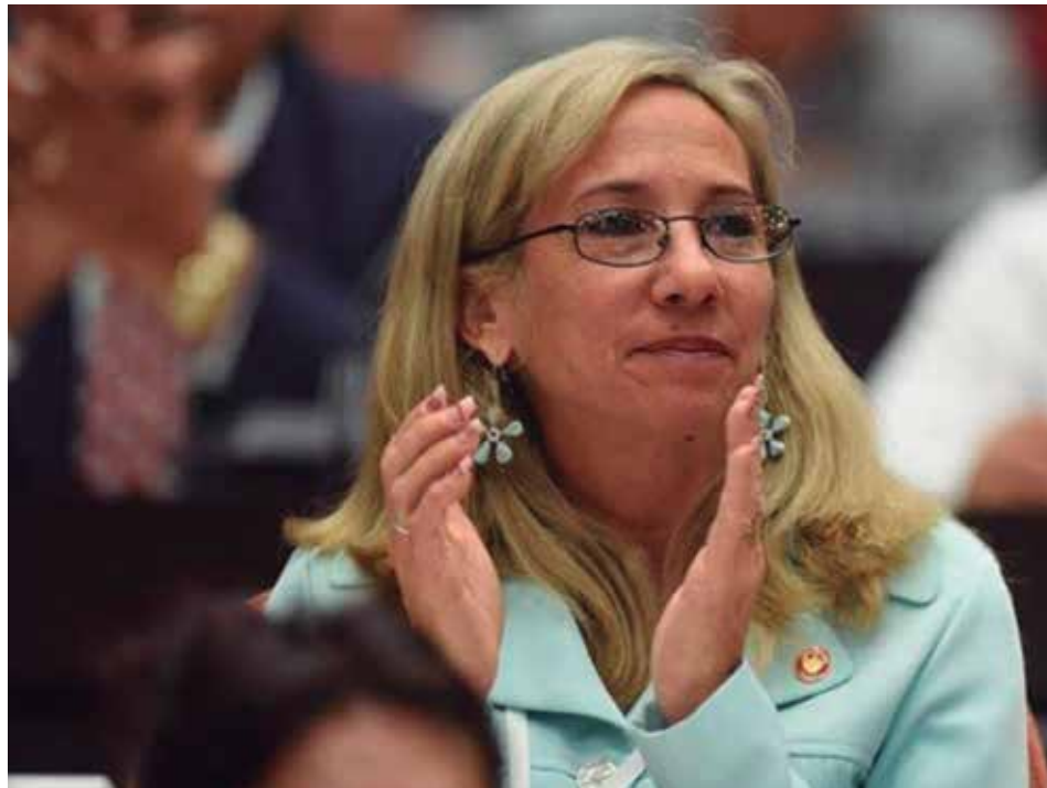
En el Parlamento aporta sus conocimientos como miembro de la Comisión de Atención a los Servicios.

“También recibí cursos de presupuesto comercial, porque hacemos el de toda la red para el año. Aquí además llevamos el directorio telefónico, mantenemos actualizada la base de datos para que el Centro de Atención Telefónica les ofrezca a los clientes la información que requieren y tuve que prepararme, ir a seminarios”.