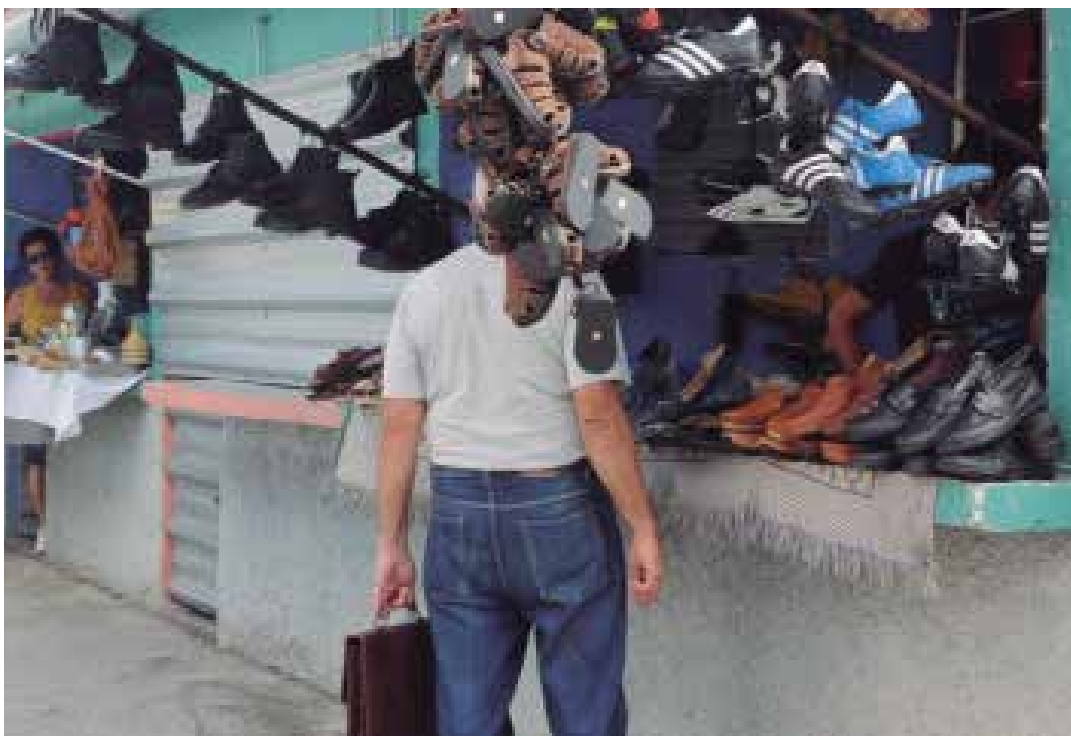
El aporte de los contribuyentes tiene un destino básicamente social.