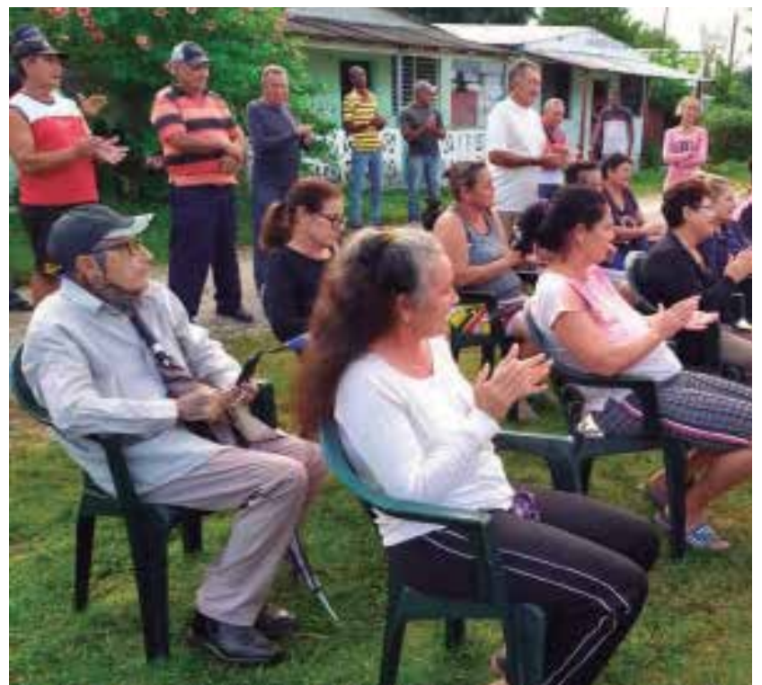
En Sancti Spíritus las asambleas de nominación se han desarrollado con calidad.

En días venideros, explicó Neisa, también se exhibirán en lugares públicos las biografías y fotos de los candidatos para que la población pueda conocer mejor a los futuros delegados.