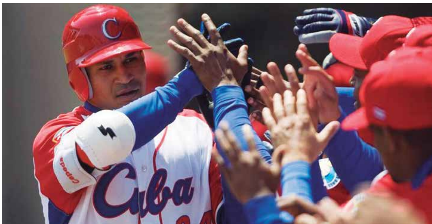
El béisbol es pasión y patrimonio de la nación cubana.