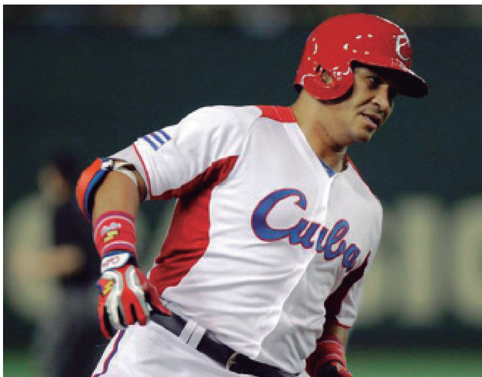
Frederich Cepeda, el cubano de mejor actuación en las cuatro ediciones de los Clásicos Mundiales.