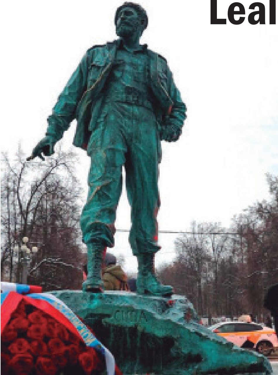
Monumento erigido en la plaza Fidel Castro, del distrito de Sókol del noroeste de Moscú.

Allá, aquí y en cualquier nación donde se luce por ideales de paz, justicia y soberanía plenas, estará siempre nuestro hidalgo, magnético y visionario líder, cuya vida no terminó la noche de aquel 25 de noviembre. Ni el llanto que siguió a esa fecha ni la nostalgia de no tenerlo entre nosotros podrán apagar su estrella de luminosidad incalculable.