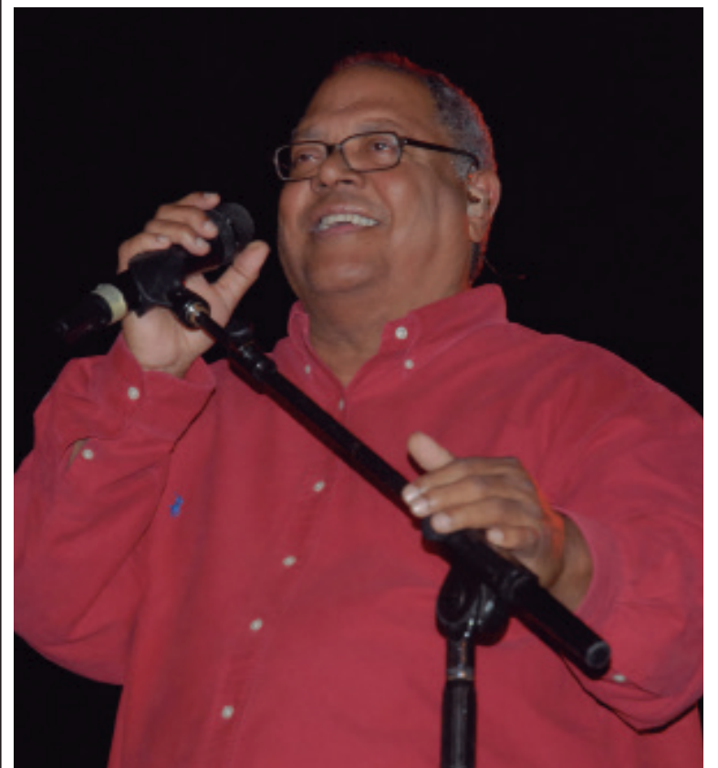
En enero del 2011 Pablo hechizó con su voz al público espiritano, que colmó la Plaza de la Revolución Mayor General Serafín Sánchez.