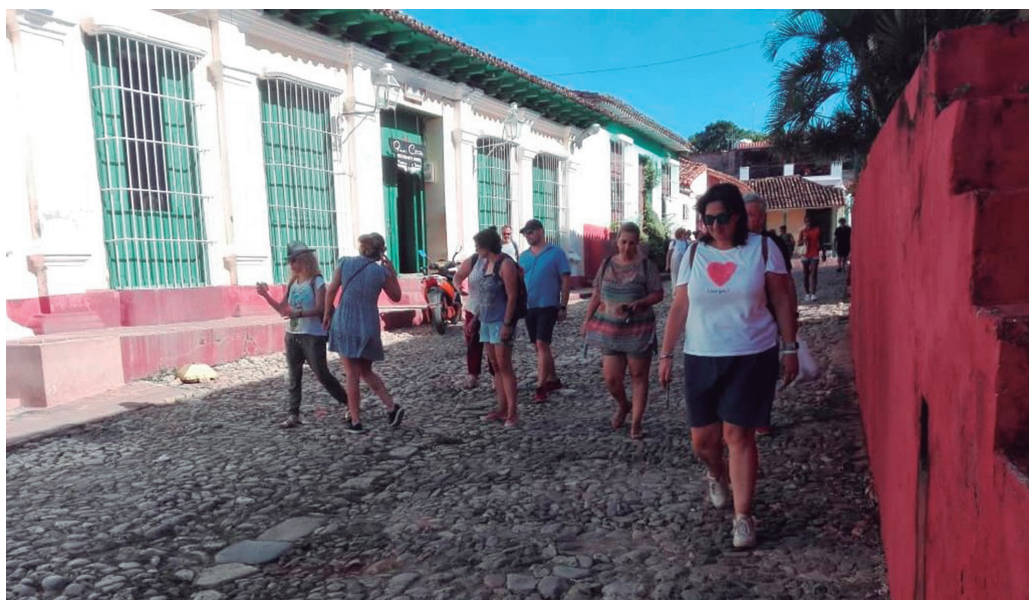
España figura entre los mercados de mayor crecimiento en los últimos años, según fuentes del Mintur en Sancti Spiritus.