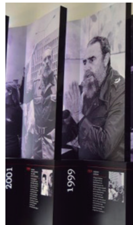
El montaje museográfico responde a los más modernos estándares internacionales.