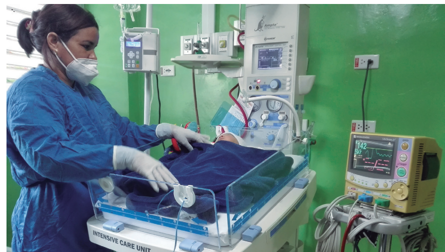
El tratamiento quirúrgico oportuno ha tributado a una mayor calidad de vida de estos niños.

La entrada en funcionamiento de un equipo de última generación para detectar cardiopatías congénitas en recién nacidos en la Sala de Neonatología del Camilo Cienfuegos facilita la realización de diagnósticos tempranos y la adopción de conductas quirúrgicas en los casos que así lo requieran, remitidos en su mayoría al Cardiocentro Pediátrico William Soler, de La Habana.