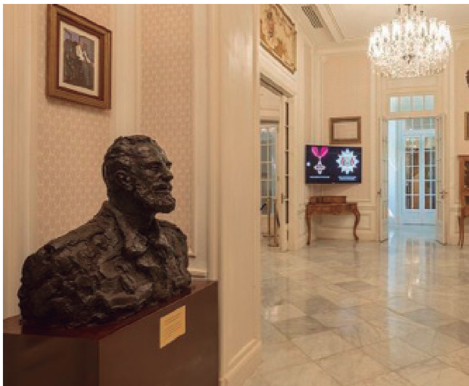
La instalación cuenta con nueve salas expositivas equipadas con diferentes soportes tecnológicos.

Mas 90 años de vida intensa no caben en paredes y espacios porque la energía de los titanes difícilmente pueda ser contenida. Ni en un millar de códices ni en cientos de ordenadores electrónicos se podría; sin embargo, en el Centro Fidel Castro Ruz tienen los hombres y mujeres de buena voluntad un espacio dedicado a aprender de quien los sabios consideran entre los más grandes pensadores del siglo XX.