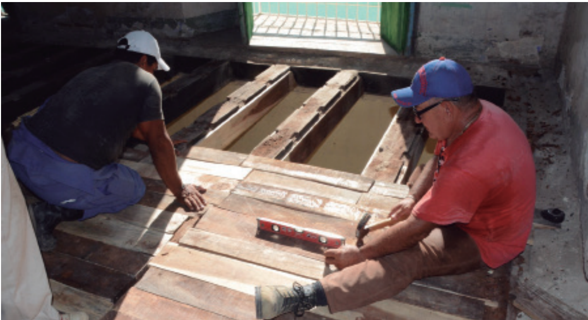
Fuerzas constructoras laboran en la planta alta de la Plaza del Mercado, emblemático inmueble de la villa del Yayabo.