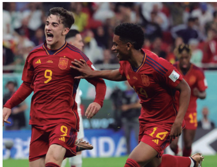
España apabulló a Costa Rica y dejó buena impresión en el debut.