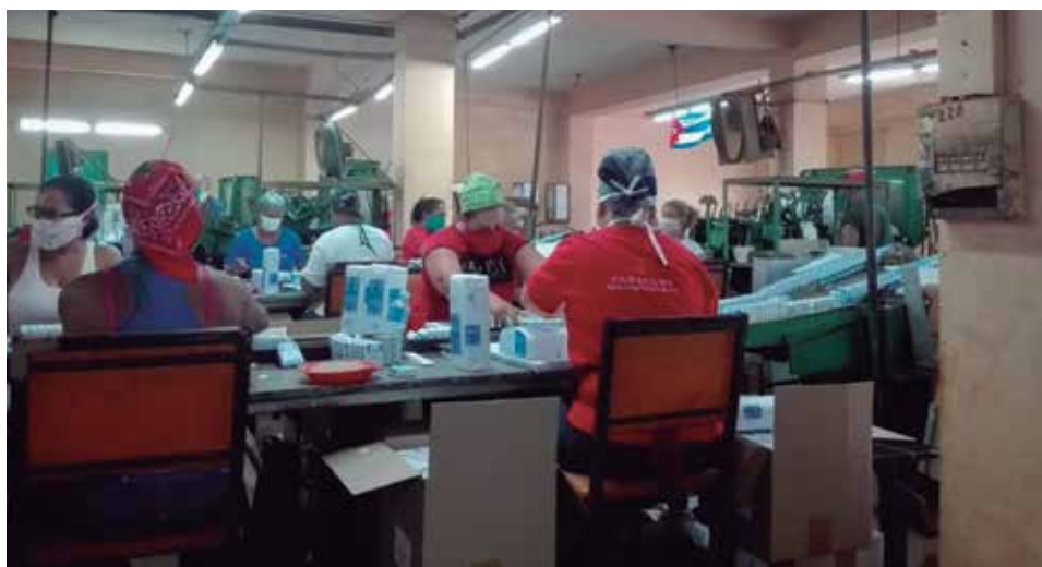
El colectivo ha donado sus vacaciones y laboró todos los sábados a fin de cumplir el plan de producción.