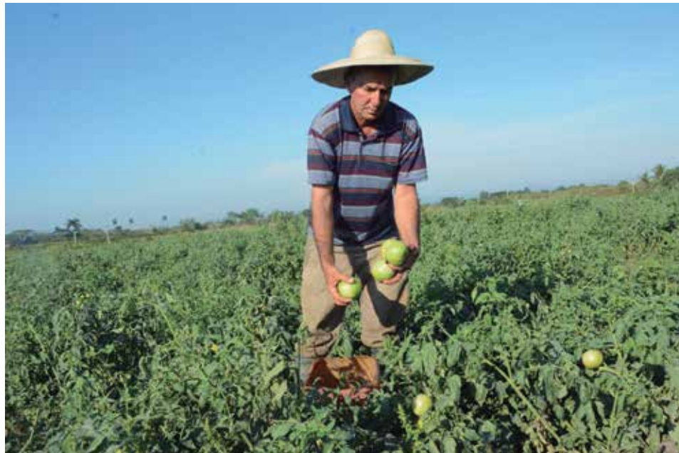
En la producción agrícola descansa el principal resultado del municipio.

razgo entre los cultivos, sobrevino la improductividad y se extinguió la CPA. Hoy se vive un rebrote de entrega de suelo y los cultivos varios, el tabaco y la ganadería empiezan a compartir los terrenos, muchos aún vacíos.