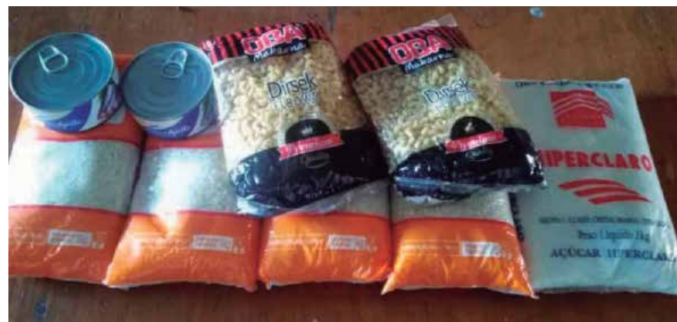
La entrega se realizará de forma gratuita.

De ahí que la insistencia del personal de la salud vuelva a ser la misma: usar nasobuco siempre que sea posible, mantener la higiene de las manos y acudir prontamente al médico.