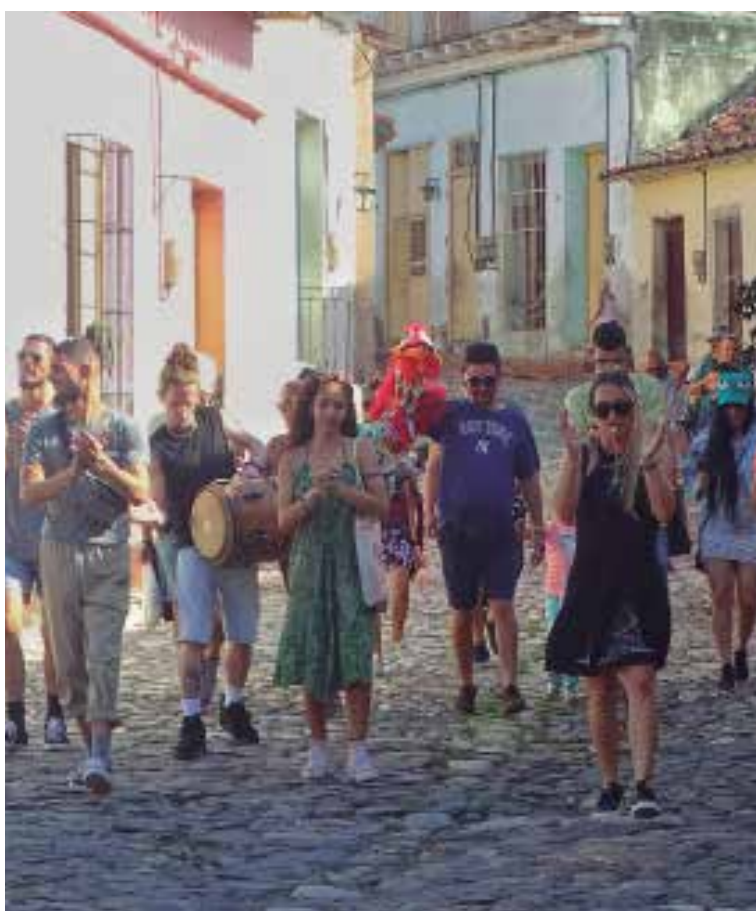
Lunas de Invierno convoca esencialmente al arte callejero.

Con la satisfacción del reconocimiento al multipremiado escritor se despidió la Jornada de Sancti Spíritus. Mas, su deuda arrastrada por años sigue en pie: repensar sus propuestas para generar un espacio más dinámico y de convocatoria tanto entre poetas del país como de públicos. Un verdadero reto en tiempos complejos, en que por nada del mundo se debe dejar de venerar la poesía, siempre en el altar de la humanidad.