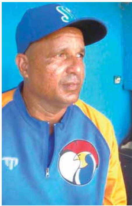
La Liga Élite le ha dejado a Huelga experiencias para próximos eventos.