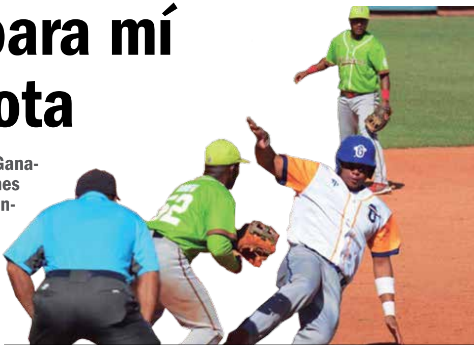
El equipo fue de más a menos en el torneo.

Siempre tuvimos problemas ofensivos, con poca producción de carreras, increíble-