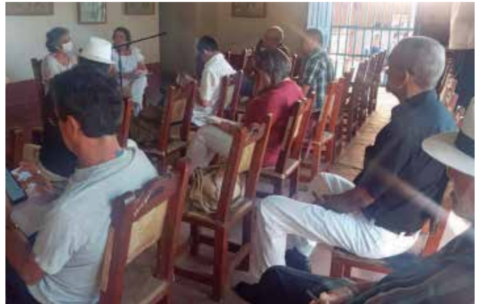
Aunque con menor capacidad de convocatoria, la jornada sigue siendo un importante espacio cultural.

Pero ese y el resto de los otros eventos precisan —además de la necesaria gestión organizativa— extender sus propuestas a un mayor número de público, a partir del diseño y materialización de opciones tentadoras,