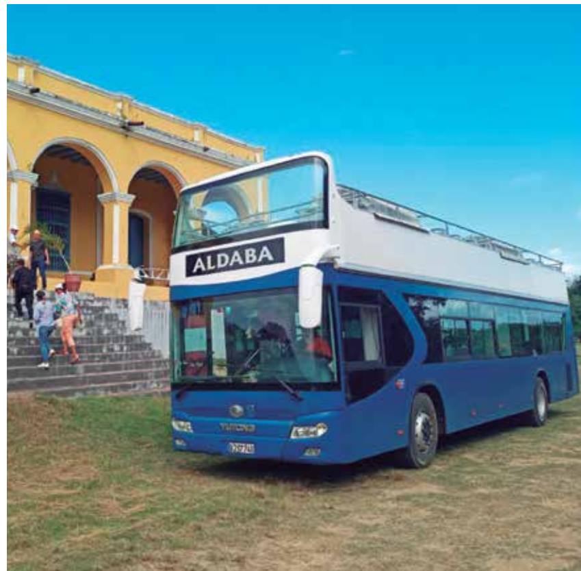
El recorrido en bus panorámico por el Valle de los Ingenios es el nuevo producto que estrena Trinidad con el sello de Aldaba.

De esta manera, Aldaba apuesta por un producto concebido no solo para generar ingresos a esta empresa estatal, sino también contribuir a la promoción de un sitio que, al decir de los estudiosos, constituye un monumento arqueológico a la industria azucarera cubana.