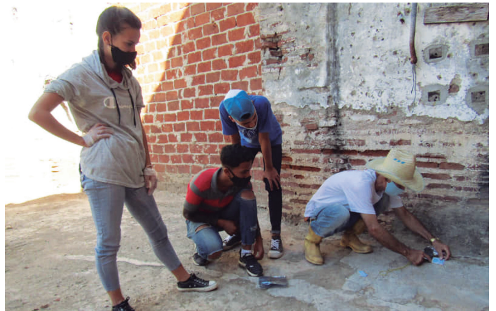
La formación de futuros arqueólogos desvela a este cabaiguanense.

“Eusebio Leal nos enseñó que era importante la formación de los futuros profesionales, porque son el relevo para seguir dándole respuesta a quiénes somos y de dónde venimos. Por suerte, con la aprobación de la Oficina del Conservador en Sancti Spíritus se abren muchas perspectivas al respecto, para que la arqueología se enraíce aquí”.