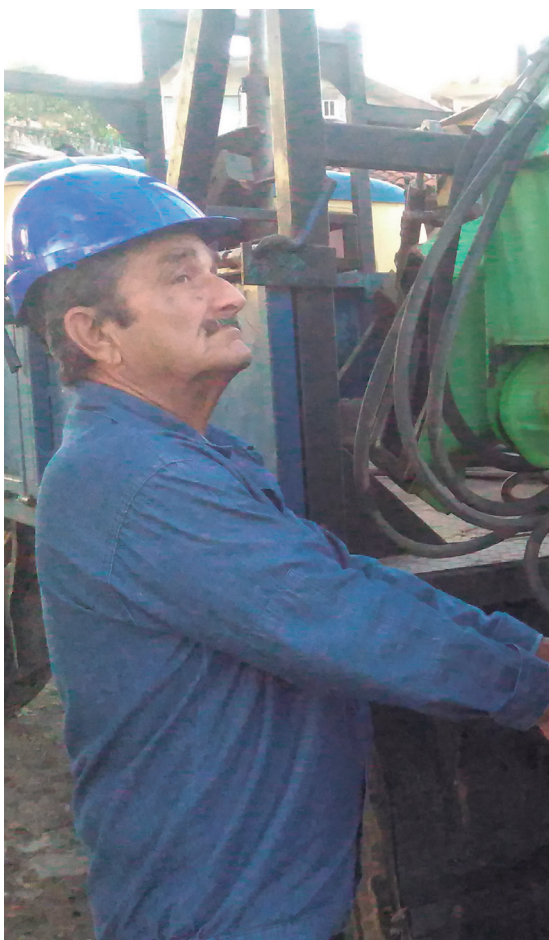
"Hasta que me jubilé, fui a todas las provincias por donde pasaron ciclones", afirma con orgullo.

Esta espirituana sobrepuesta a prejuicios pudo haber hecho muchas cosas, "porque oportunidades he tenido en cursos que me han ofrecido, pero qué le voy a hacer, me gusta este trabajo y gracias a esto soy una mujer multipropósito, lo mismo limpio que hago gestiones de cobro para recoger las deudas, así dejé tres de las rutas en cero. Sin ningún reparo, a manguera limpia desempolvo el frente, hago la guardia obrera y la nocturna una vez al mes o cuido la puerta si el custodio tiene un problema. Hay que cuidar lo nuestro y esta siempre ha sido mi casa".