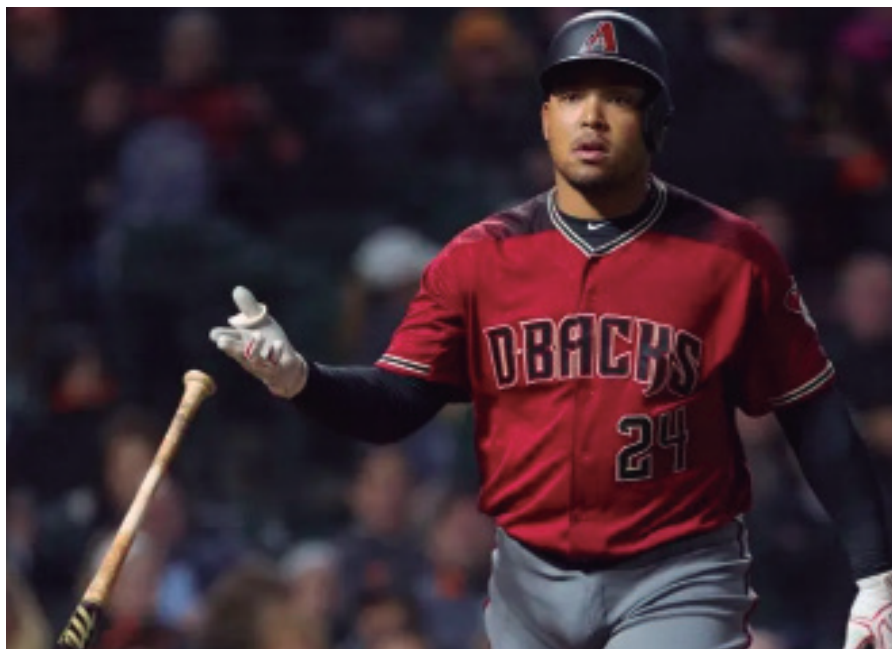
Una de las decisiones más debatidas ha sido la exclusión de Yasmany Tomás.