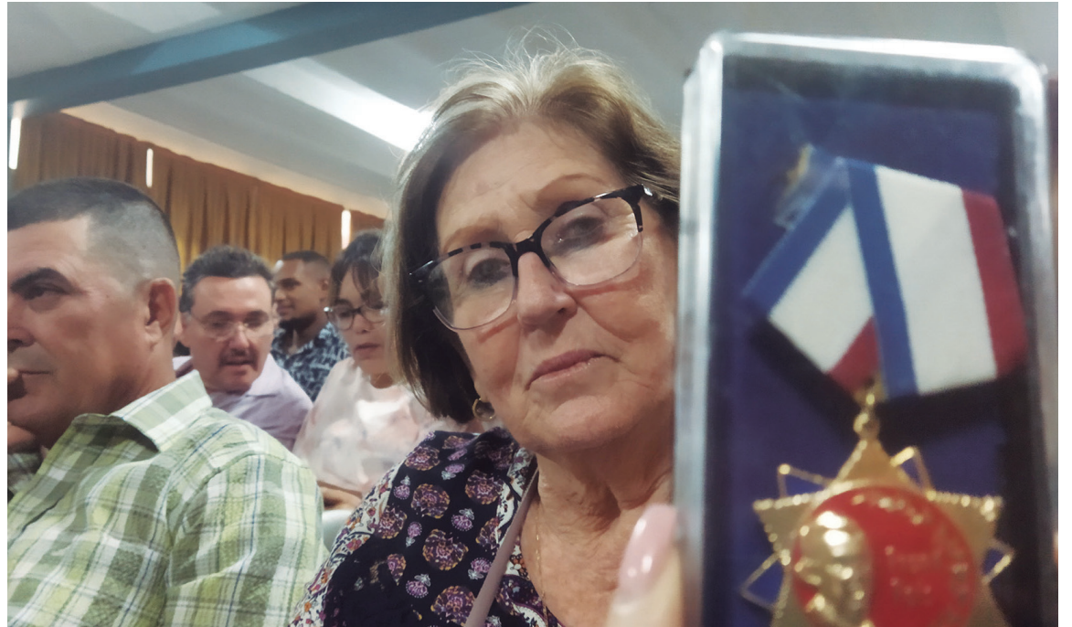
“Para mí lo más importante es el reconocimiento del consejo de dirección de mi universidad, el agasajo y las muestras de cariño que toda la comunidad universitaria ha mostrado con este logro”, apunta.

“Mi mayor mérito como rectora fue lograr un excelente equipo de trabajo, porque todos éramos rectores de una actividad. Los cuatro vicerrectores, los decanos, los jefes de departamento... estuvimos muy unidos. De esta forma, conseguimos que nuestra universidad estuviera siempre dentro de