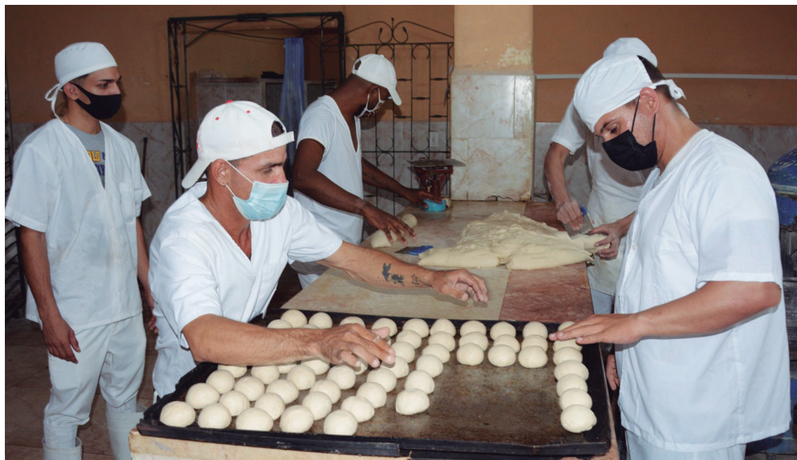
En la calidad del producto influyen también la elaboración y el estado técnico de los hornos.

Tampoco tiene nada que ver una cosa con la otra. Los porcentajes de extensores cuando se agregan a una formulación se hacen de forma tal que no se pueden utilizar con harinas que no tengan más del 25 por ciento de gluten. A una harina que tenga un 28 o un 30 por ciento de gluten, se le agrega un 7 por