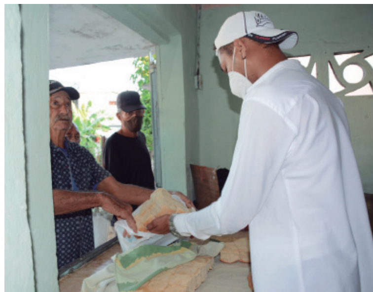
La población no siempre queda satisfecha con el producto que recibe.