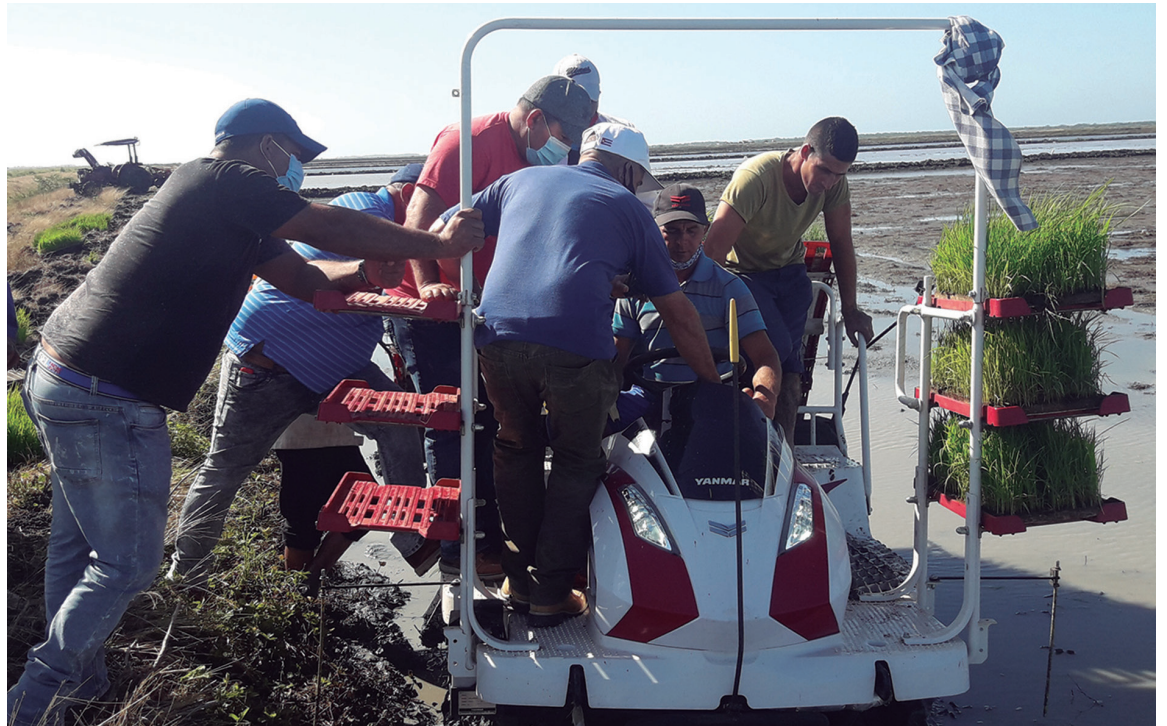
La aplicación de la ciencia en la producción de alimentos alcanza resultados destacados en la provincia.

“En estos resultados ha sido fundamental la organización desde el Gobierno provincial del sistema de ciencia e innovación tecnológica