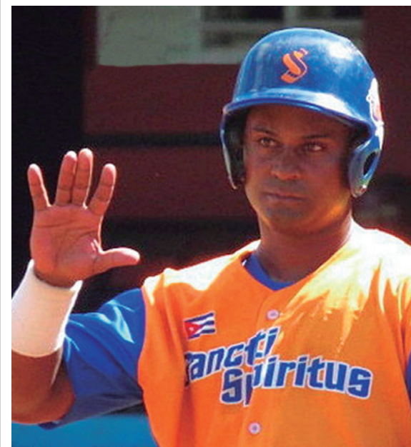
Jóvenes y consagrados lucirán el uniforme de los Gallos.