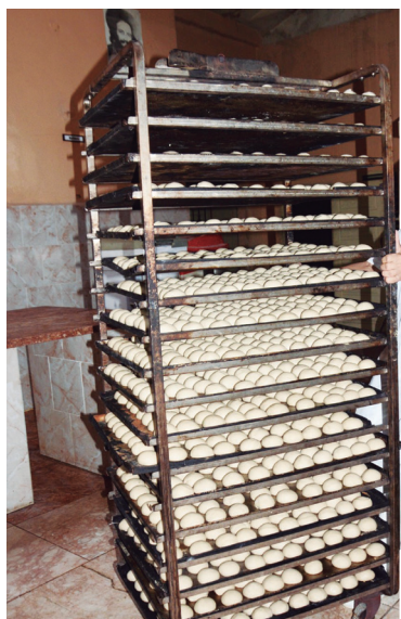
El tiempo de cocción resulta fundamental en el proceso.