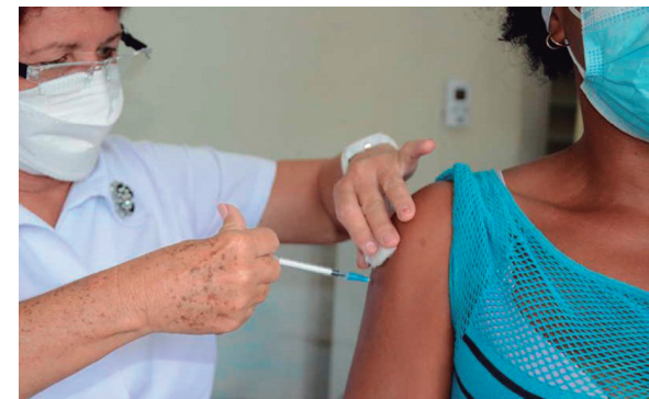
Están garantizados los recursos necesarios para realizar la vacunación.

Para recibir esta tercera dosis de refuerzo, que se administrará en las áreas de salud, los consultorios médicos de la familia y las instituciones hospitalarias, deberán haber transcurrido seis meses de la aplicación de la segunda dosis de refuerzo, no presentar enfermedades agudas en el momento de la vacunación, ni patologías crónicas descompensadas.