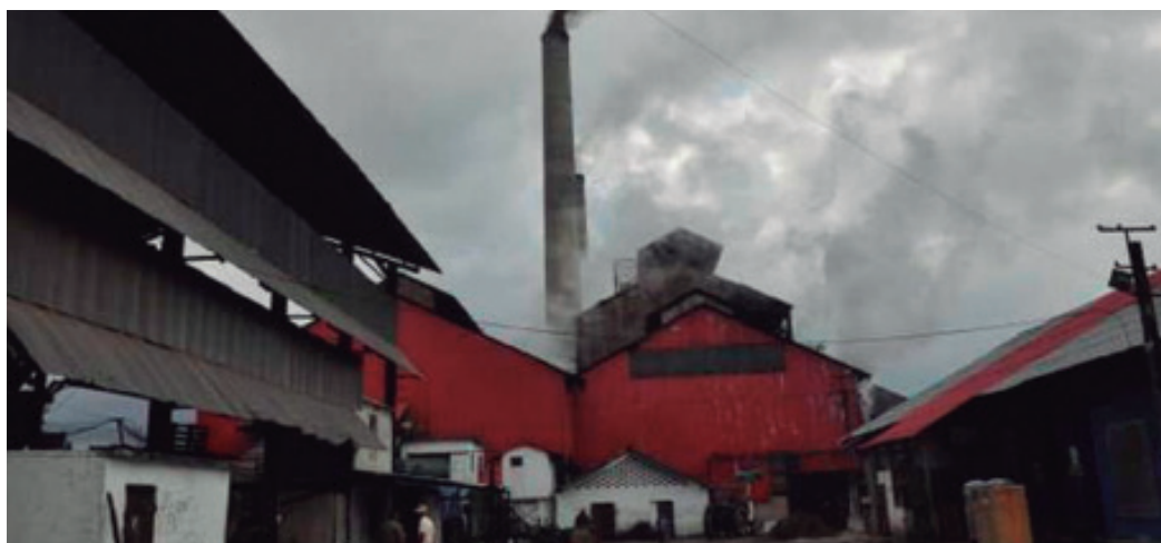
El Melanio Hernández cumplió las primeras fases de fabricar meladura para alcohol y el azúcar de la zafra chica.