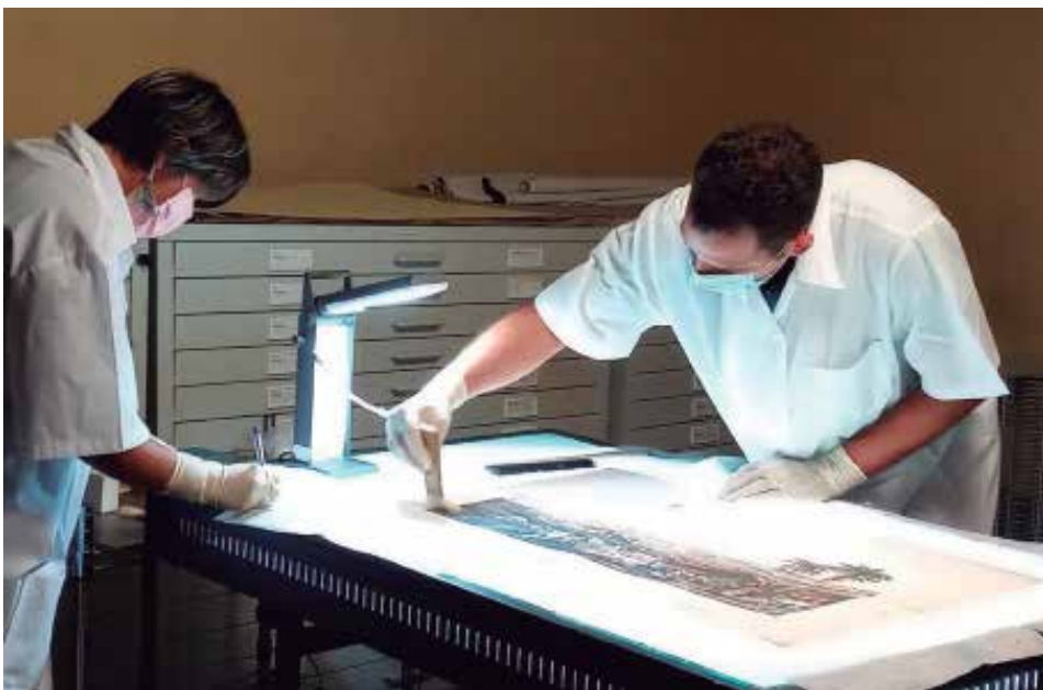
A partir de la ficha técnica, los restauradores realizan cada paso del proceso de intervención de la obra de arte.