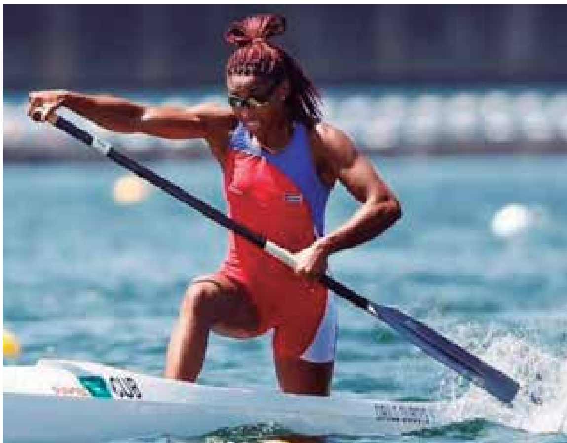
El canotaje figura entre los deportes con posibilidades de medallas en las citas regionales de San Salvador y Santiago de Chile.

Según información publicada en el Grupo Team Manigüeros, los propios participantes, tal como ocurrió en la primera convocatoria, autofinancian la competencia con toda su logística, en la que tienen una participación varios organismos como el Inder, Gaviota, Islazul, Campismo, la Empresa de Transporte Escolar, la Policía Nacional Revolucionaria y el SIUM, entre otros. (E. R. R.)