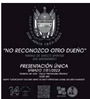
Cartel que promueve la presentación de la obra.

El grupo Catorceavos ya ha marcado la diferencia en sus propuestas al crear la pieza interactiva, única y de gran convocatoria de pueblo Carnaval conceptual , propuesta que representó a Sancti Spíritus en la 14 Bial de La Habana, en diciembre del 2021. (L. G. G.)