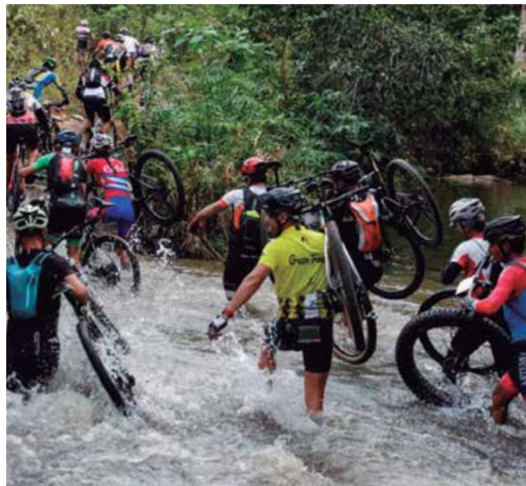
El torneo contará con cuatro etapas de competencia.

O sea, que no habrá tiempo para respirar, mucho menos para una armada que, contrario a lo que sucede en varios países, tendrá que repetir asistencia y capacidad competitiva en los eventos múltiples mencionados en pos de medir la real estatura del deporte cubano en un año muy duro.