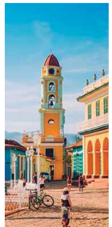
Trinidad a las puertas de su cumpleaños 509.

Se retocaron además numerosos espacios públicos y algunas arterias principales de la ciudad que luce presumida sus encantos de más de cinco siglos.