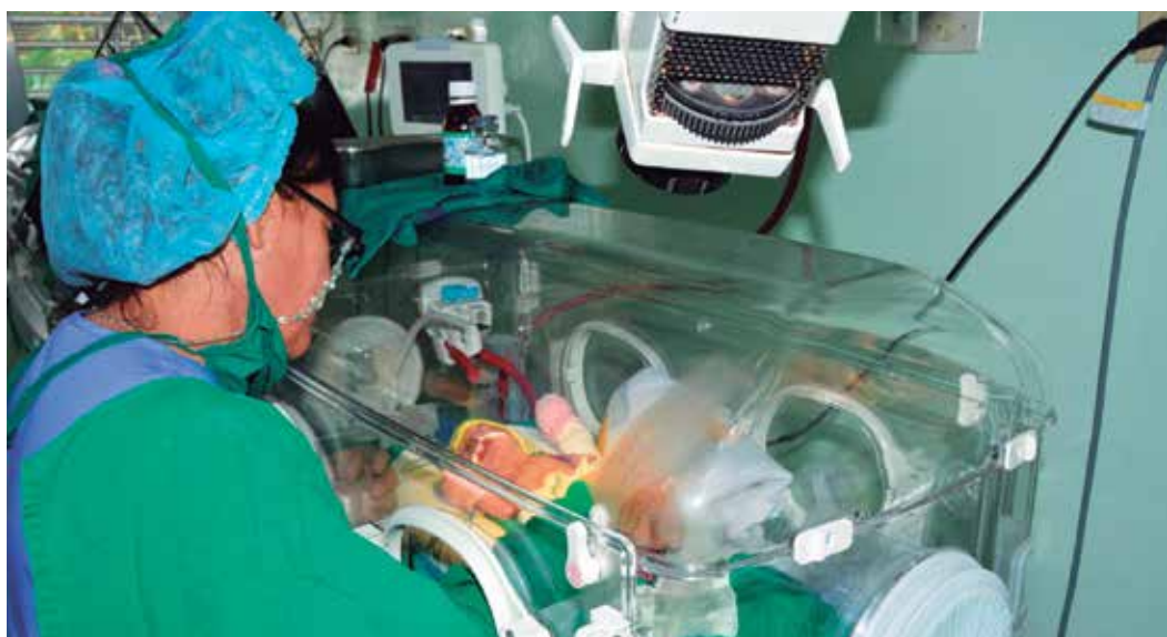
Uno de los talones de Aquiles de la provincia es la disminución de la natalidad.