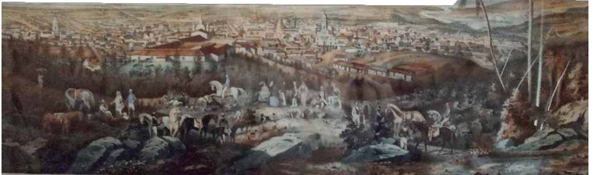
El dibujante y grabador español Leonardo Barañano se inspiró en un cuadro de Eduardo Laplante para realizar esta vista de Trinidad.

Una de las obras con valor excepcional que atesora el Museo de Arquitectura Colonial de Trinidad recupera su integridad estética e histórica gracias al talento de dos jóvenes restauradores