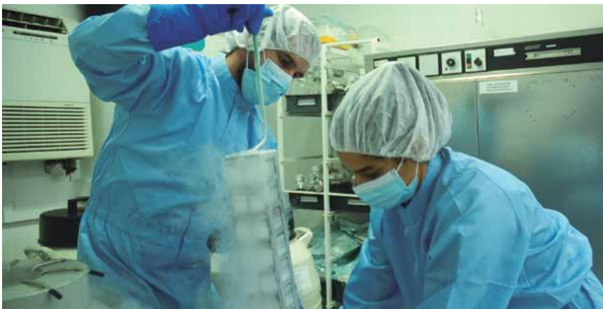
Jóvenes y experimentados científicos conforman un colectivo de excelencia en el CIGB de Sancti Spíritus.