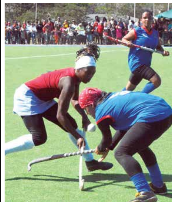
Las espirituanas han ocupado puestos cimeros nueve veces en las últimas dos décadas.

Desde el 2003 hasta la fecha, el hockey femenino espirituario ha alcanzado un título en el 2011, además de tres medallas de plata, cinco de bronce y dos cuartos lugares. (E. R. R.)