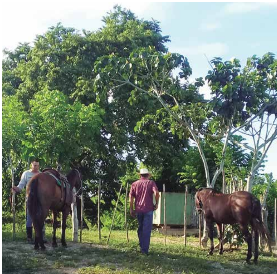
La disminución en los inventarios de equinos es más evidente en el último quinquenio.

La crianza de caballos, mulos y asnos en Sancti Spíritus retrocedió en más de 10 000 cabezas, si se compara con lo cuantificado hace cinco años. El hurto y sacrificio ilegal supera los 19 000 caballos en el último quinquenio