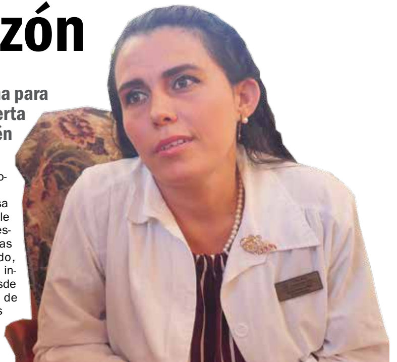
Valia no deja de superarse e indagar sobre cada padecimiento.

“En el 2021 tuve dos diagnósticos que cambiaron mi vida. Uno fue el de una amiga de Medicina, que me llamó para que la viera porque estaba llenándose de forúnculos y cuando me empezó a explicar le dije: Vamos a ver a un hematólogo, porque cuando me