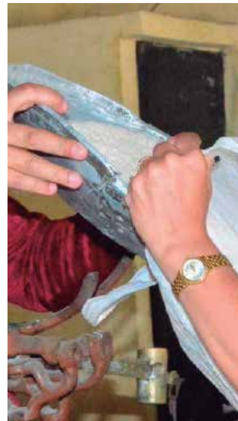
El arroz de la canasta básica está asegurado, incluida una libra adicional.

Por último, aclaró que lo que sí se asegurará por parte del país, hasta ahora, es el arroz destinado a la canasta familiar, que este mes, por ejemplo, incluye una libra adicional y gratuita por cada consumidor. (X. A. M.)