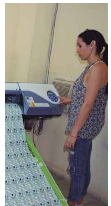
Además de asegurar los actos y eventos, la unidad incursiona en otros servicios.

“Aunque el Partido sigue siendo nuestro cliente principal, brindamos servicios a todas las instituciones, la población, las mipymes, logramos encadenamiento con varias entidades y actores económicos, lo cual permite también hacer producciones e incrementar las líneas de ingresos”, detalló la propia fuente.