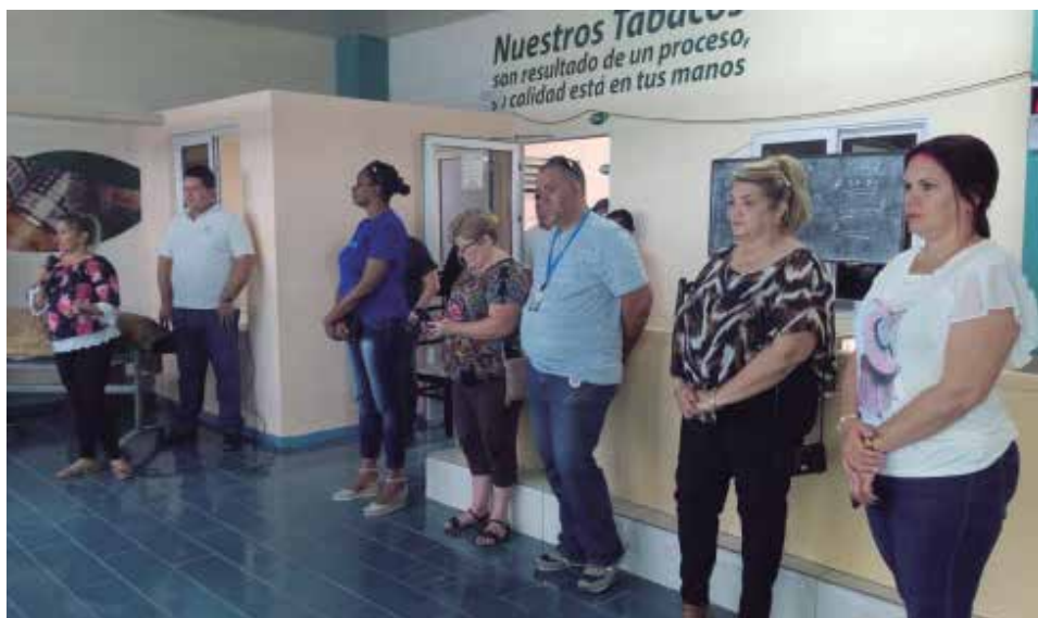
Los candidatos espirituanos recorren diversos centros económicos y sociales del territorio.