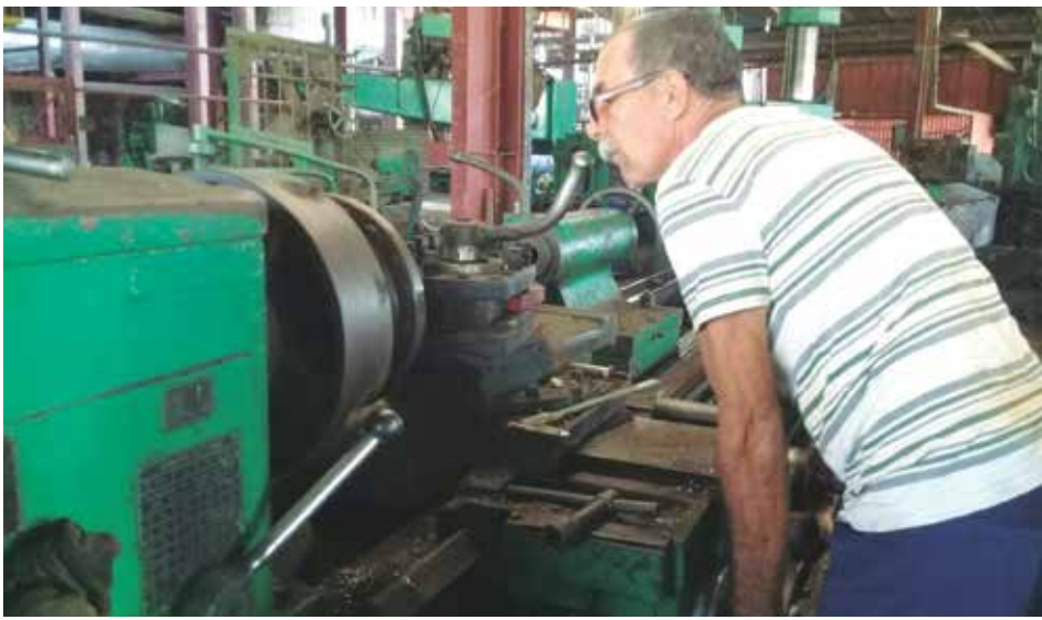
La pausa productiva del central ha desatado la potencialidad innovadora y de recuperación en el colectivo del taller.