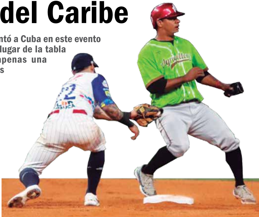
Las estrategias del equipo esta vez tampoco funcionaron.

También por la deficiente defensa, el mal corrido de bases, incluido el conservadurismo de detener a Viñales tras un fly a los jardines, dos outs en la pizarra vs. Vaqueros de Montería, de Colombia, y con el posible empate en tercera a la