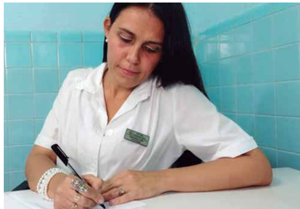
La Inmunología te permite implicarte en la vida de todos los pacientes, asegura la doctora espiritana.

Yo me entrego a la consulta, a mí se me puede olvidar dónde pongo las llaves de mi casa, pero no se me puede olvidar el tratamiento, lo que les vi a las personas que atiendo. Mis consultas no las hago corriendo, aunque tenga dos niños y mi mamá esté operada y le cueste trabajo, yo me entrego y trato de palpar, de examinar y de dar lo mejor de mí, si algo sale mal yo hice todo lo mejor posible para que no saliera. No es nada tal vez especial, pero yo me entrego de corazón.