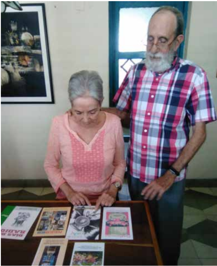
Lichi y Yero mantienen vivas la pasión y la entrega para seguir juntos en los complejos caminos de la vida y la creación.