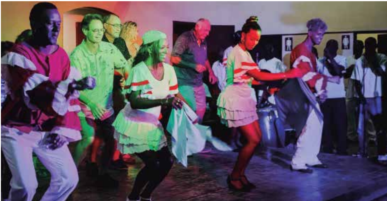
El conjunto trinitario sostiene raíces únicas.