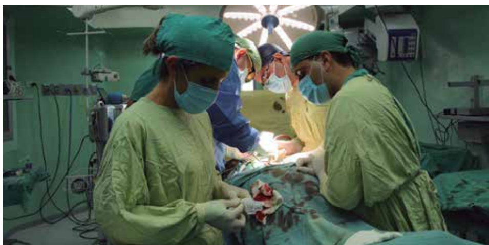
El proceder quirúrgico fue realizado por un grupo de expertos de La Habana y de la provincia.