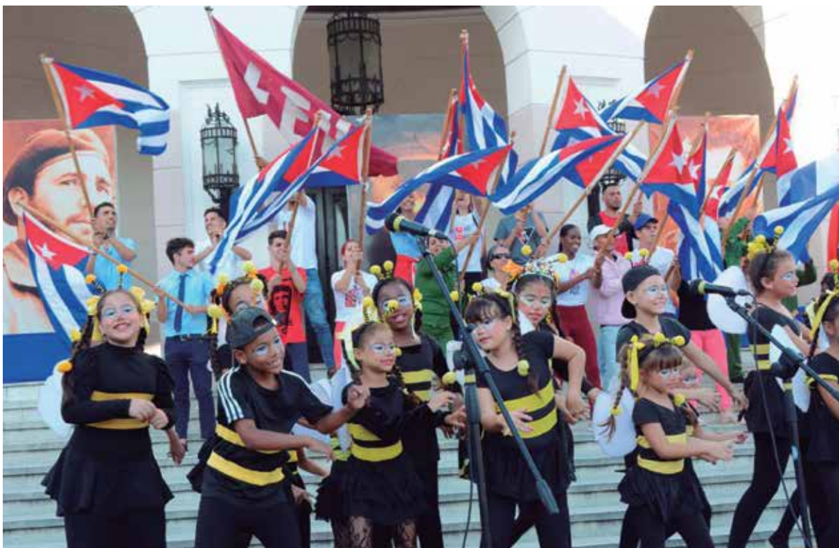
Niños y jóvenes de la provincia contarán con diversas opciones para celebrar la fecha.