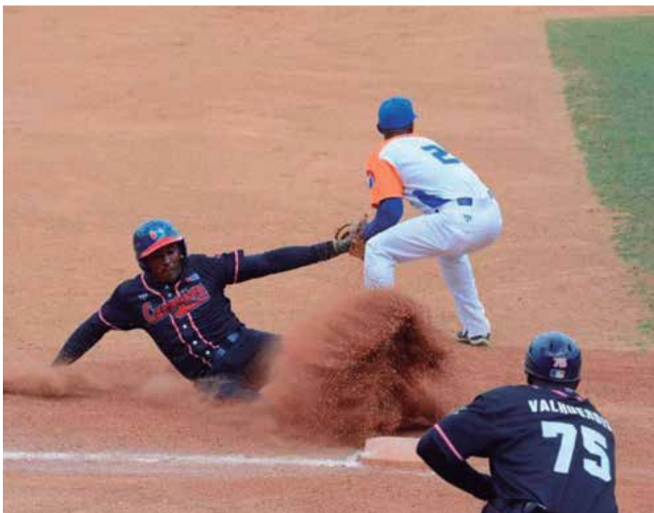
La Serie Nacional debe contar con mayores incentivos para los jugadores.