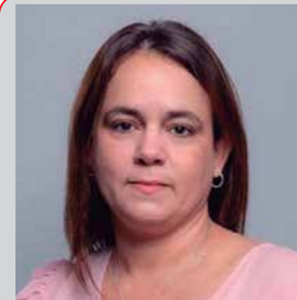
Ailyn Febles Estrada Municipio: Sancti Spíritus Edad: 48 años Ocupación: Presidenta nacional de la Unión de Informáticos de Cuba