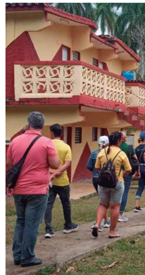
Representantes de varias agencias de viaje de la provincia recorrieron las instalaciones para incluirlas en sus ofertas.

“El Campismo Popular se mantiene entre las opciones recreativas más económicas a las que puede acceder el turismo nacional. Una habitación para cuatro personas oscila en alrededor de 200 pesos por noche. Los precios más altos están en la gastronomía y las bebidas, porque los proveedores aumentan también el importe de sus productos, pero siempre será la posibilidad más asequible”, añadió.