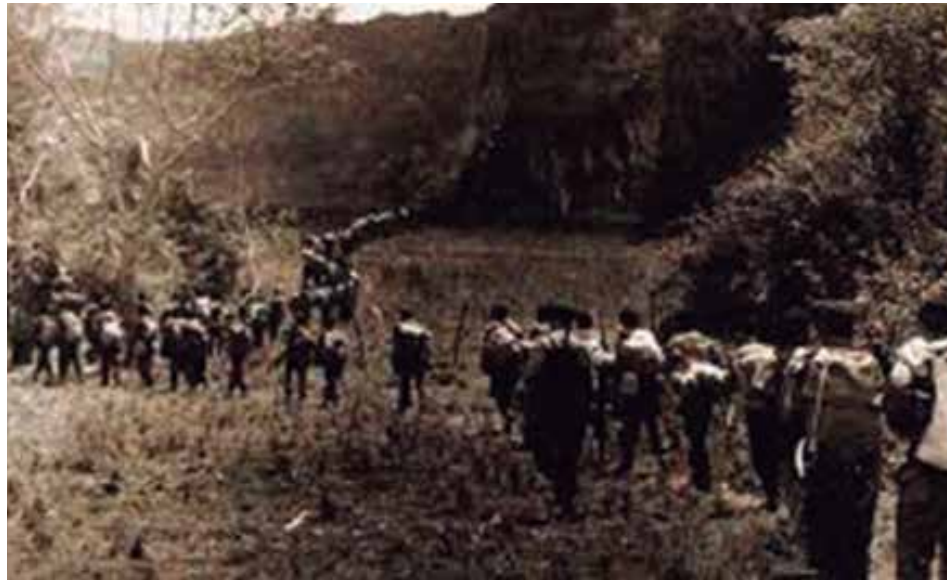
Gracias a la labor de muchos agentes de la Seguridad de Estado fue posible aniquilar las bandas de alzados en el Escambray.