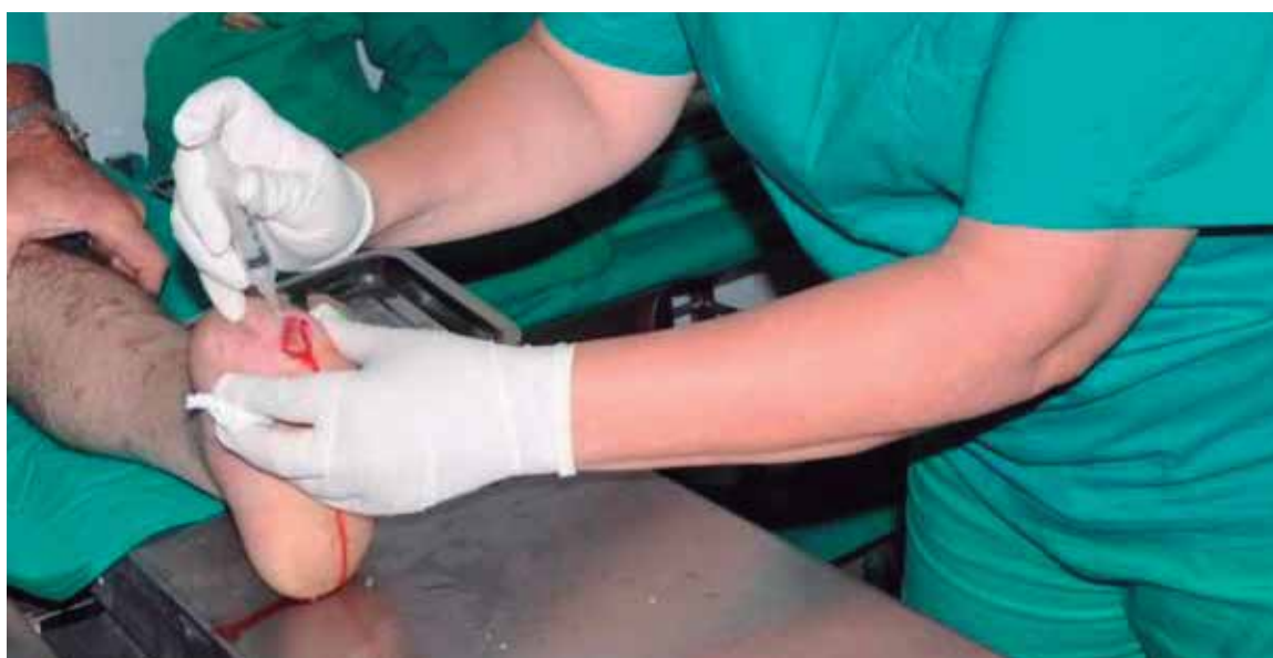
Los pacientes beneficiados con Heberprot-P en estadios tempranos tienen una curación más rápida y mayor sobrevida.