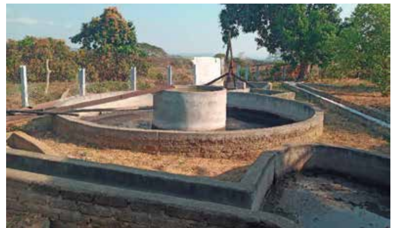
La utilización del biogás y otras fuentes renovables de energía figura entre los objetivos esenciales del programa.

Dueñas Boggiano añadió que, como parte del estudio de campo, se identificaron alrededor de 20 productores líderes, con resultados en la actividad agropecuaria y que