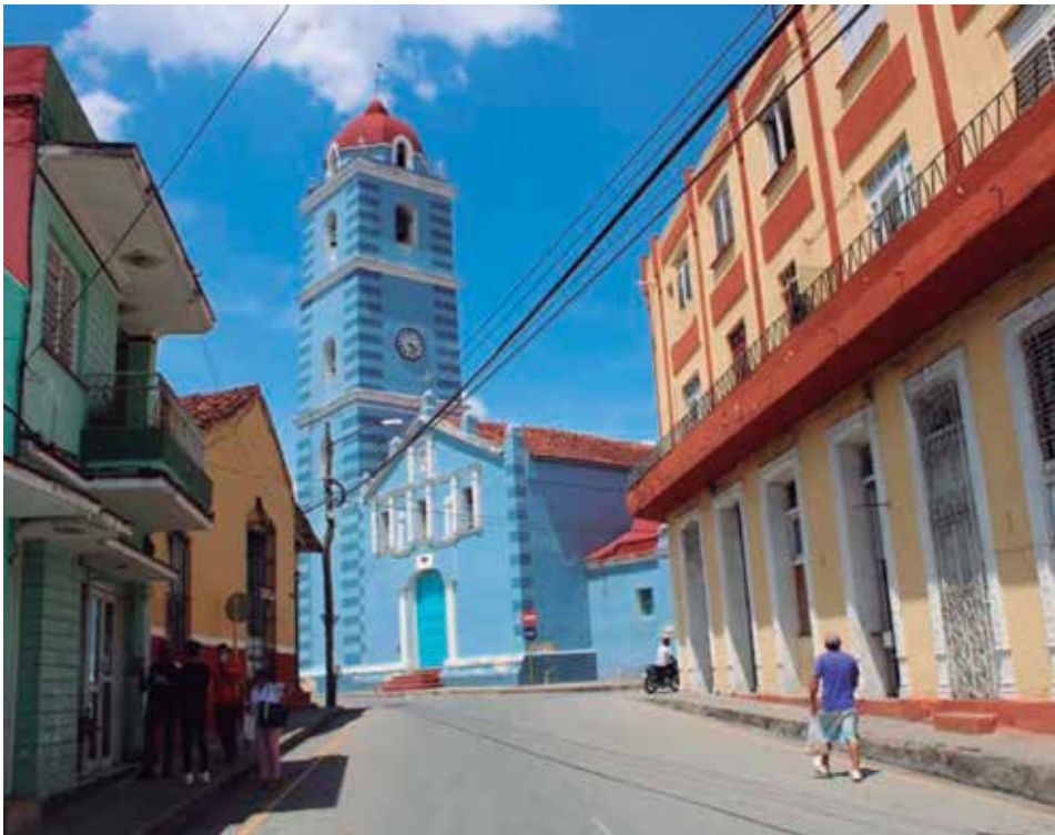
El Premio de la Ciudad se convoca cada año en saludo al cumpleaños de la villa.