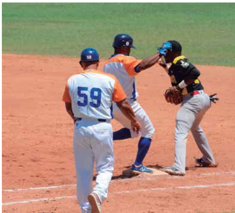
Pese a las notables ausencias, el equipo ha logrado mantenerse en la avanzada durante la serie.