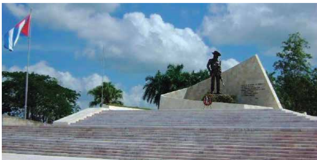
El acto provincial tendrá lugar el 23 de julio a las 7:00 a.m. en la Plaza de la Revolución Comandante Camilo Cienfuegos.