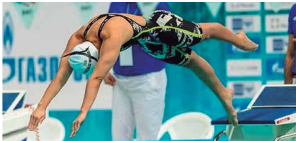
En la natación descansan esperanzas de medallas para Cuba.

Mas, para los amantes del deporte, la cita centroamericana, que concluye el 8 de julio, puede ser una buena opción de disfrute en este verano. (E. R. R.)