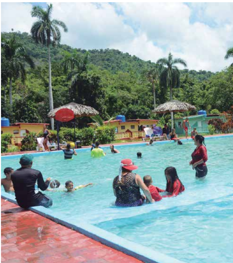
Las seis instalaciones de Campismo Popular abrirán sus puertas con una imagen renovada.