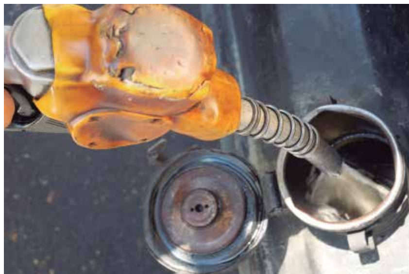
La venta por Ticket ha sustituido las colas físicas en los servicentros.

La cola virtual, aunque no marcha al ritmo deseado y necesitado, además de ser tan incierta y desesperante como la física, es hoy una alternativa que contribuye a la venta organizada y equitativa de combustible.