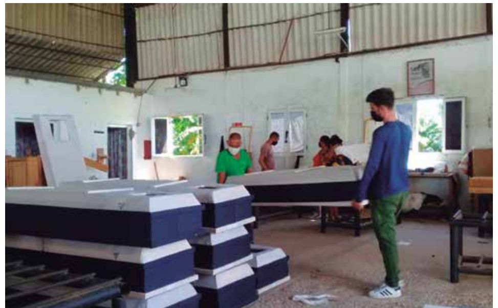
Aunque se ofrecerán nuevas prestaciones, se garantizará la entrega gratuita del ataúd tradicional.