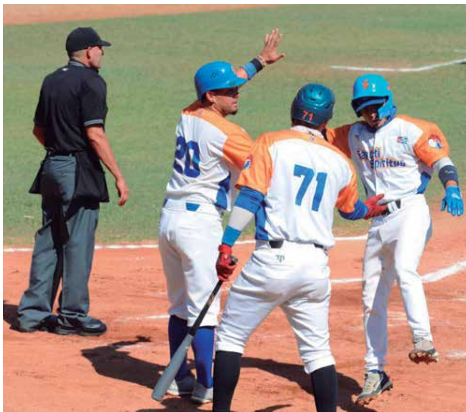
Los Gallos se han visto forzados a mover sus estrategias en las últimas presentaciones.