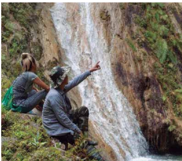
Una extraordinaria belleza natural se muestra en Lomas de Banao.