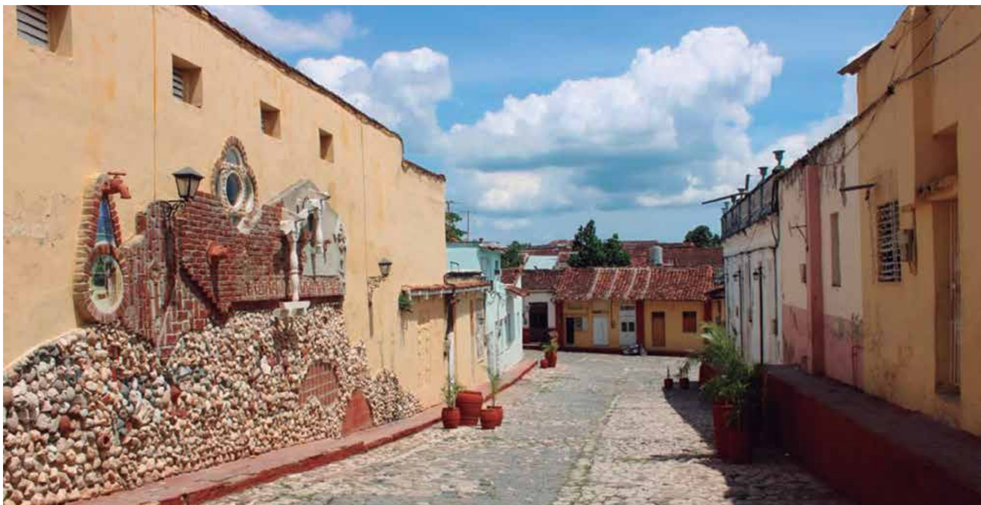
La villa espirituana mantiene su encanto colonial y sus valores arquitectónicos.