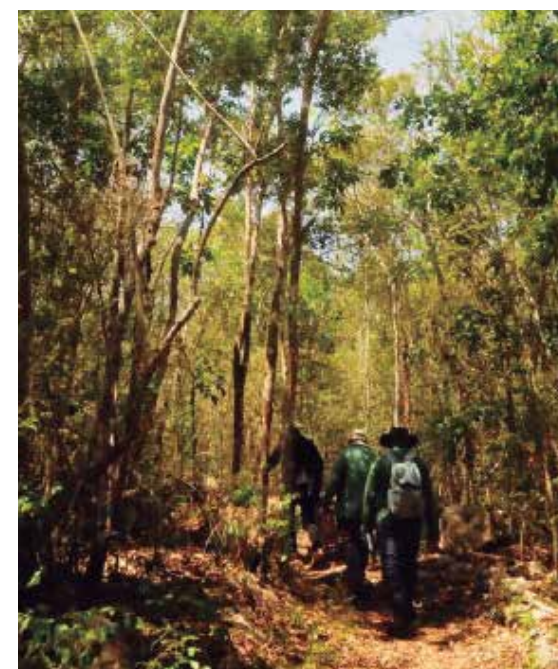
El senderismo gana cada vez más adeptos.