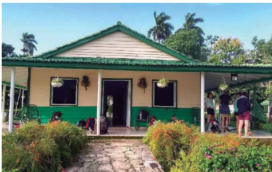
La Finca Agroturística Los Álamos, perteneciente a la Empresa Flora y Fauna Sancti Spíritus, se convierte en una atractiva opción para clientes nacionales y extranjeros.