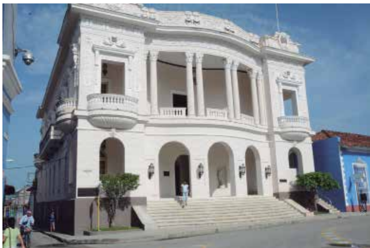
En la Biblioteca Provincial Rubén Martínez Villena radica la sede de la Cátedra de Estudios Bibliotecológicos Segundo Marín, de la filial espirituana de la Ascubi.