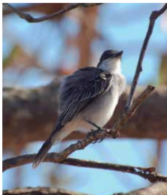
La conservación de la fauna es una prioridad.