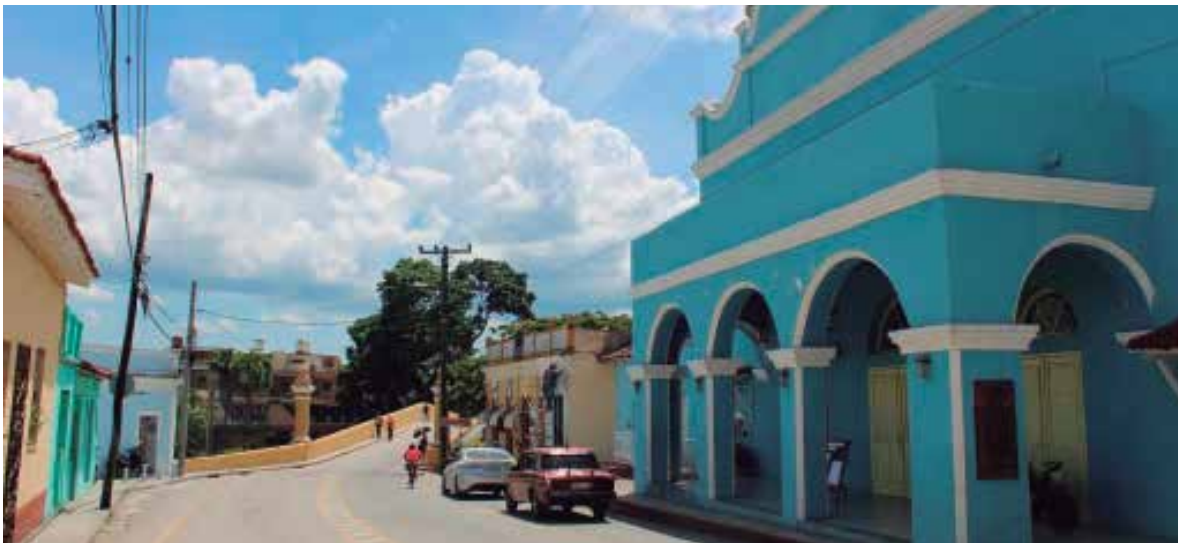
La Sesión Solemne tendrá lugar este sábado a las diez de la mañana en el Teatro Principal.