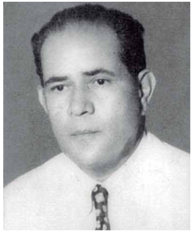
Este defensor del patrimonio espirituano nació el 18 de febrero de 1897.

Justamente, a la máxima autoridad municipal —recuerda la presidencia de la filial espirituana de la Asociación Cubana de Bibliotecarios (Ascubi)— envió una carta el 7 de mayo de 1933, confirmatoria de sus preocupaciones