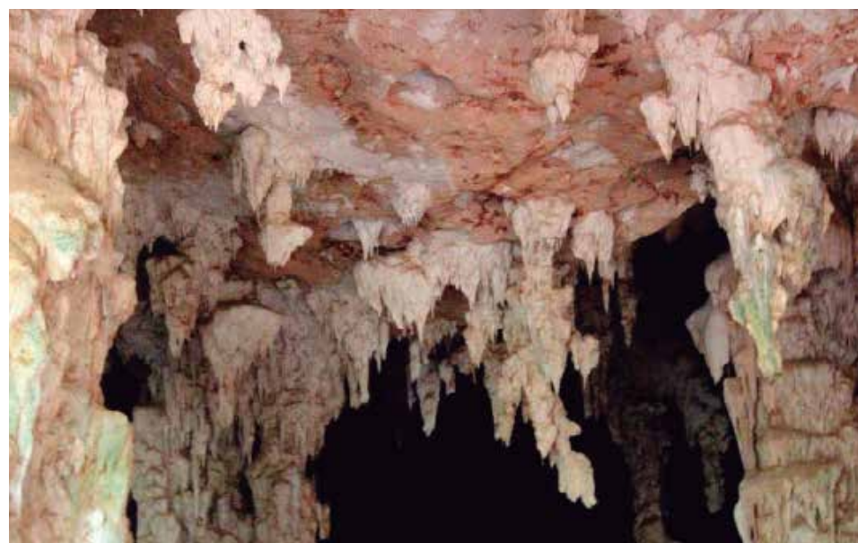
Cuevas y cavernas de singular belleza figuran entre las propuestas turísticas que ofrece el paisaje del norte espirituario.