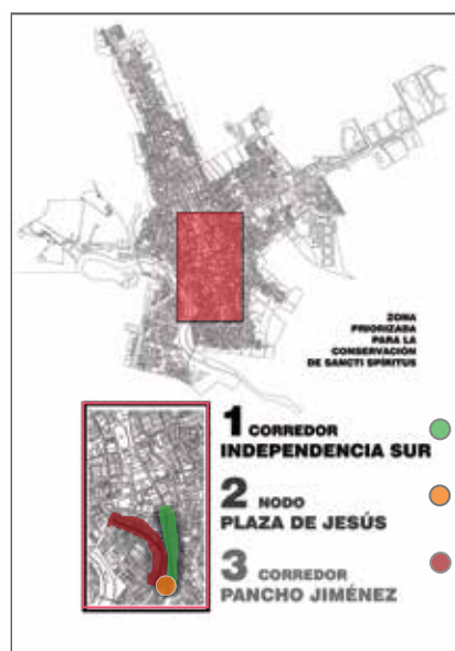
Zona donde se hará la intervención integral.

“Los expertos realizarán estudios para conocer la fecha de su creación. Al no haber ocurrido con anterioridad una intervención integral a Sancti Spíritus nunca se la había hecho la arqueología de la ciudad. Por ello, serán varios