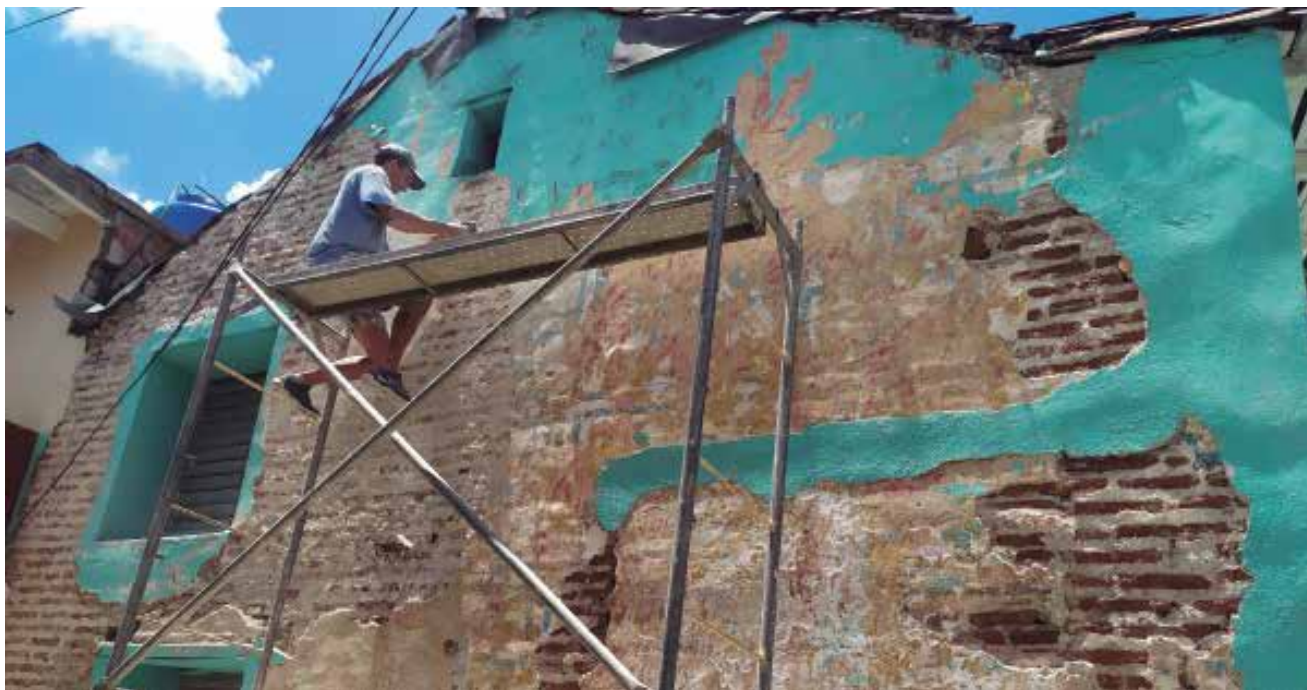
Al decapar la fachada en la vivienda ubicada en el conocido boquete Popular y la calle Independencia sur se encontró una pintura mural.