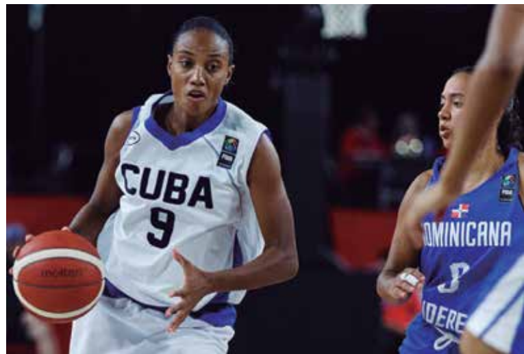
La basketbolista Yamara Amargo prestigia la delegación espirituario.

A la cita, programada del 23 de junio al 8 de julio próximos con sede compartida con República Dominicana, Cuba debe asistir con cerca de 500 deportistas distribuidos en 26 disciplinas. (E. R. R.)