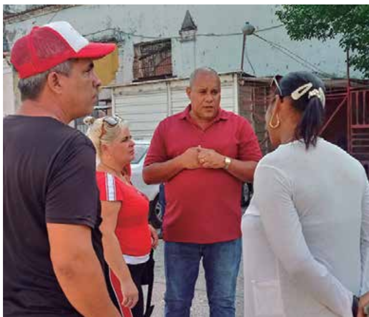
"Un directivo de gobierno tiene que saber escuchar, visitar e intercambiar mucho con el pueblo", asegura.

Otro serio problema son los precios, hemos ido buscando en cada lugar cómo entre todos podemos seguir ayudando. Tenemos que seguir llamando a volcarnos hacia la tierra, a seguir sembrando para aprovechar las potencialidades que tenemos porque únicamente así, con lo que podemos hacer entre nosotros, lograremos contribuir para que la población se sienta mejor.