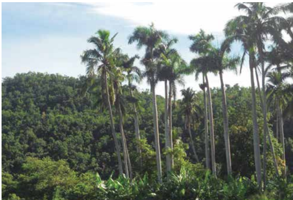
En Lomas de Tasajera se han registrado valiosas especies de plantas.

En ocasión del Día Mundial del Medio Ambiente, Escambray regala imágenes de la riqueza natural que distingue a este territorio, donde además se realizan acciones diversas para conservar ese patrimonio