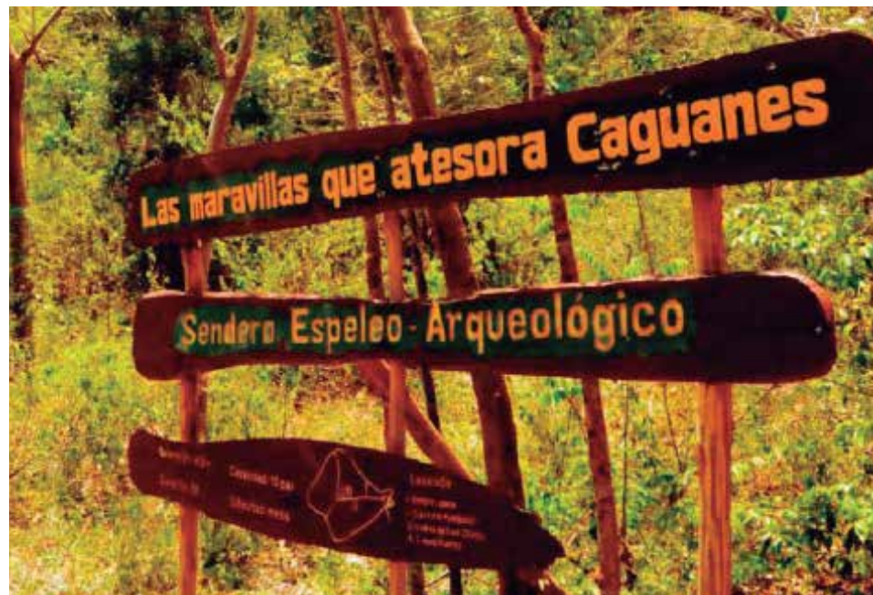
Atractivas opciones brinda a los visitantes el Parque Nacional Caguanes.