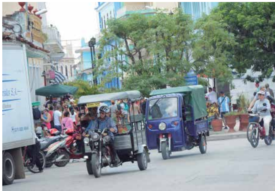
Estos equipos requieren Licencia Operativa de Transporte para trasladar pasajeros.

“Los triciclos eléctricos se han vuelto un