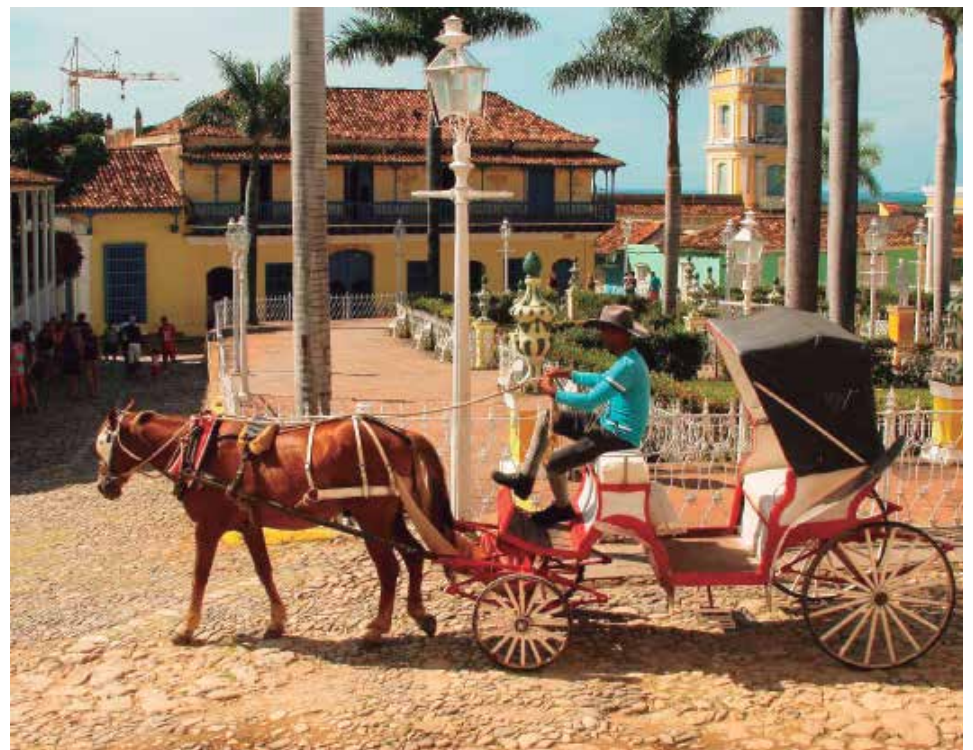
El Centro Histórico de la ciudad y sus instalaciones devienen ofertas muy atractivas.