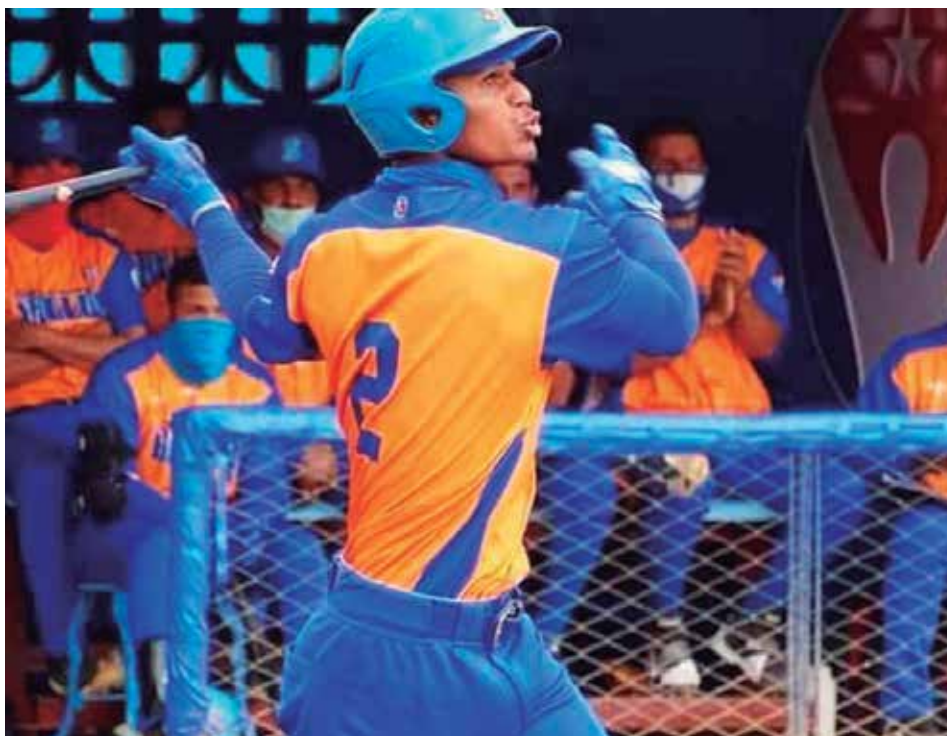
El espirituario integrará el equipo que participará en la Liga de Campeones del Béisbol de las Américas.

Esa necesidad, la de utility, lo llevó a emplearse muy a fondo. Tanto que jugó en 74 de los 75 partidos de su elenco para acumular 311 comparecencias (quinto de