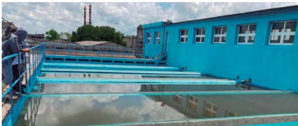
La planta debe abastecer, en un primer momento, a los habitantes de la cabecera municipal.