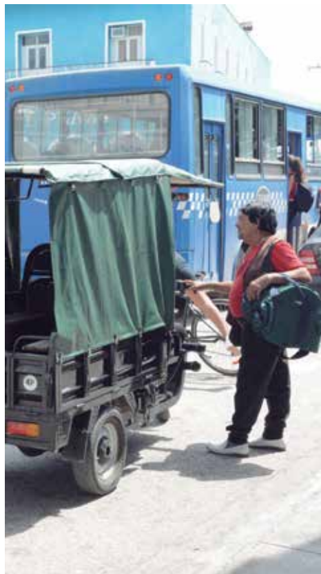
La población considera muy exagerados los precios de la mayoría de los triciclos.