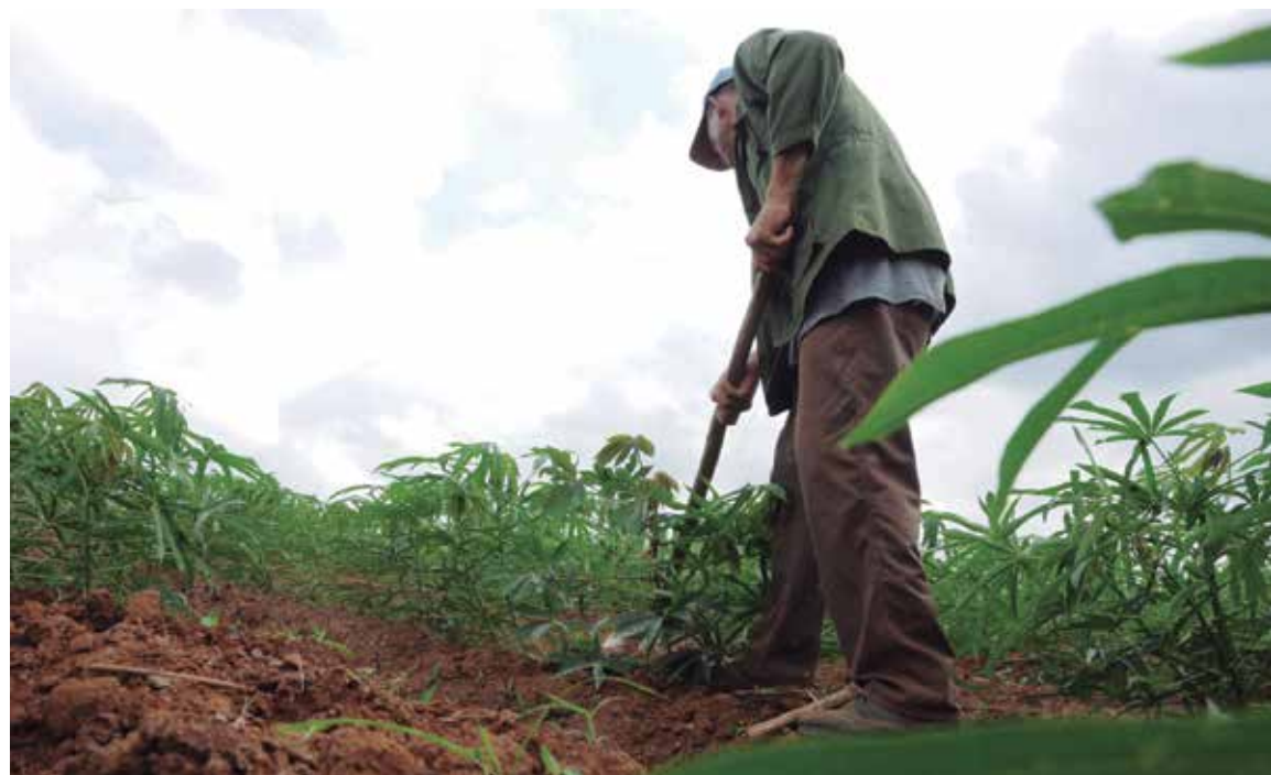
Incorporar áreas a la producción es una de las maneras de mejorar la disponibilidad de alimentos.