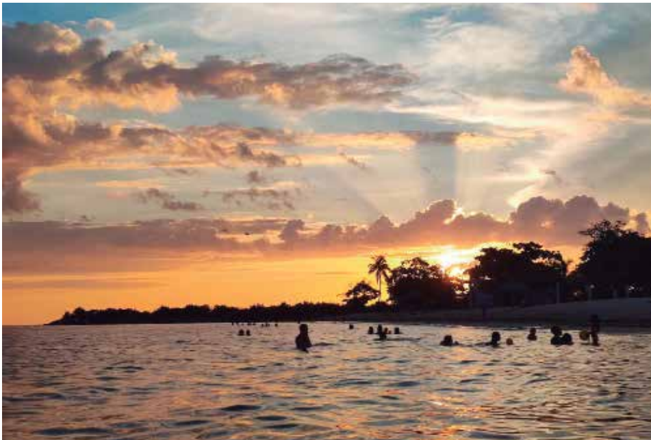
Las áreas de playa invitan a visitantes de varios sitios de la isla y del mundo.

Lo cierto es que esta ciudad patrimonial y turística pone al alcance de los vacacionistas ríos, cascadas, parques naturales, viajes a la playa, recorridos por museos y galerías, la posibilidad de disfrutar cocteles en cafés y paladares, trasnochar en discotecas... Todo un lienzo multicolor que luce Trinidad en el verano.