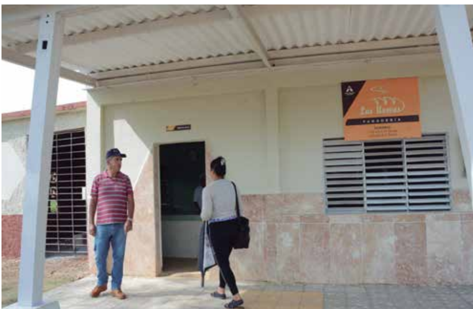
Los pobladores de Las Nuevas cuentan con una panadería ampliamente mejorada.

“ Los problemas eran muchos, pero se ve la mejoría en relación con épocas anteriores, lo principal es acabar con las secuelas del vertimiento de albañales de la comunidad, que no son tan graves ahora como cuando se acumulaban en medio de la calle, pero hay que preservar la salud de la gente ”