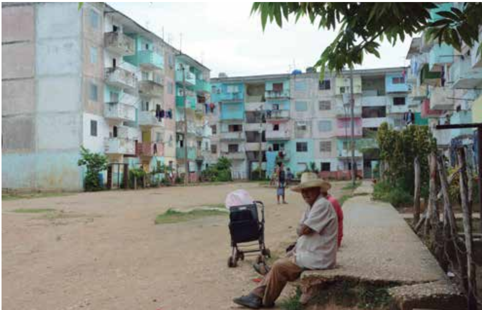
Las Nuevas es un asentamiento que cobró vida con la construcción de edificios multifamiliares y otras instalaciones en la década del 80.