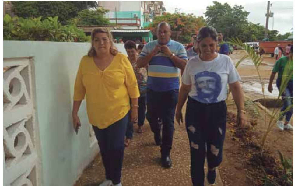
El apoyo de las autoridades del Partido y del Gobierno en el territorio ha sido decisivo para la transformación de la comunidad.