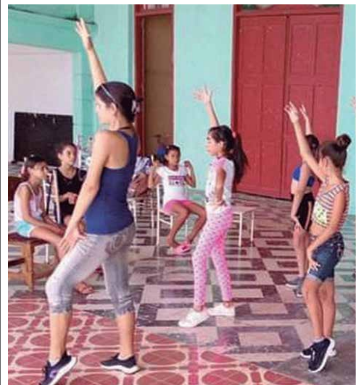
Los instructores de arte del sistema de Casas de Cultura han trabajado con los diferentes grupos etarios.

En octubre, el sistema de Casas de Cultura retoma la participación de sus talleres, una opción de aprendizaje para quienes disfrutan descubrir el maravilloso mundo del arte.