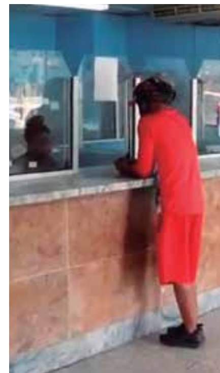
Muchos espirituanos acuden a las unidades de Correos en busca de sellos digitales.

Por último, señaló que actualmente la empresa también se encuentra en cadena para prestar el servicio de transportación puerta a puerta con las tiendas online Tuambia y Katapultk.