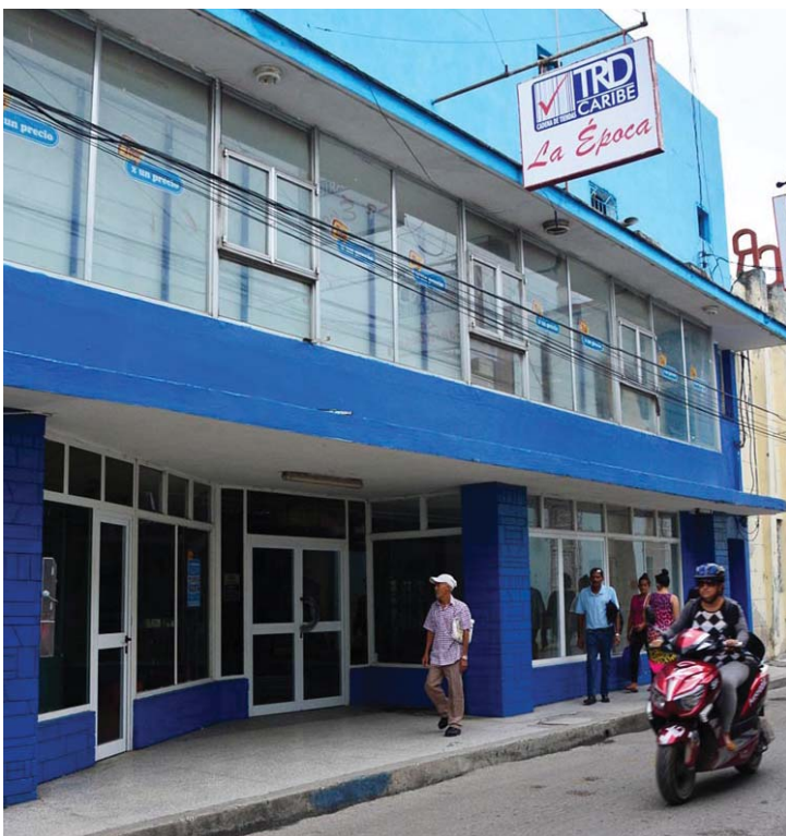
La Época, uno de los centros destinados a la venta, ha sido objeto de un amplio mantenimiento constructivo.

Las tres unidades que en la provincia comercializarán productos para su venta en Moneda Libremente Convertible (MLC) se hallan estructuralmente listas para abrir y en espera de las mercancías