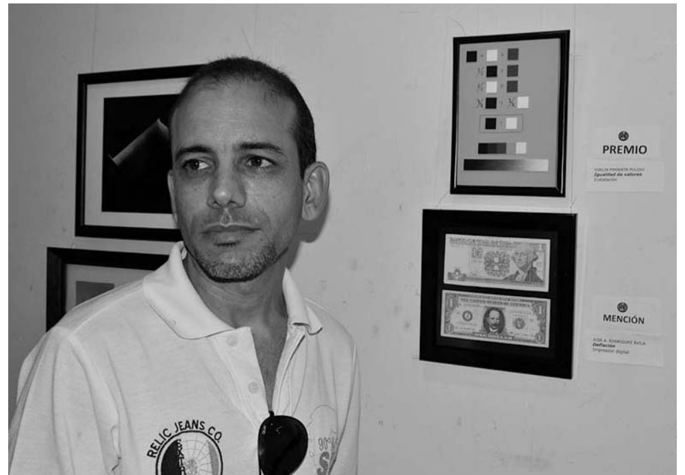
La instalación Igualdad de valores mereció uno de los premios de la I Bienal de Pequeño Formato Amelia Peláez del Casal.

Uno de los más recientes éxitos tuvo lugar en La Habana en la muestra Piedras de río , donde creadores del patio llenaron de una punta a la otra el Centro de Desarrollo de las