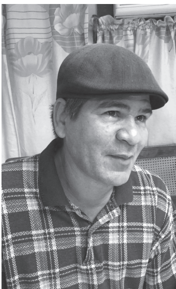
Reinol se alzó con el primer premio del III Certamen de Soneto.