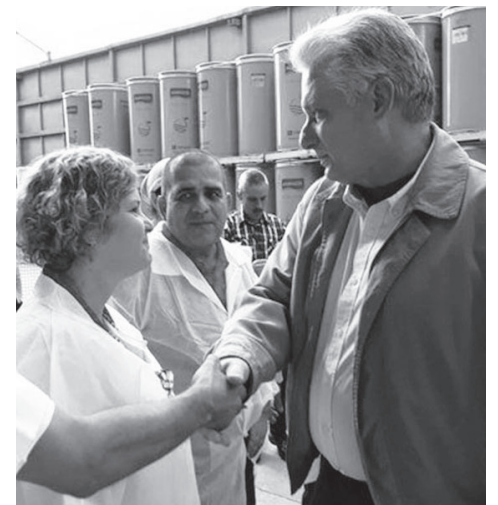
El Presidente intercambió con trabajadores de la UEB No. 3 La Estancia.

Radicada en áreas del antiguo combinado Río Zaza y atendida solo por 170 trabajadores, esta unidad y la de Jagüey Grande (UEB No. 2) son las únicas del país que envasan sus producciones con tecnología Tetra Pak aséptica, “un privilegio”, que por sus ventajas y por lo difícil que resulta adquirir la lata en el exterior, el Presidente sugirió extender a otras industrias del país.