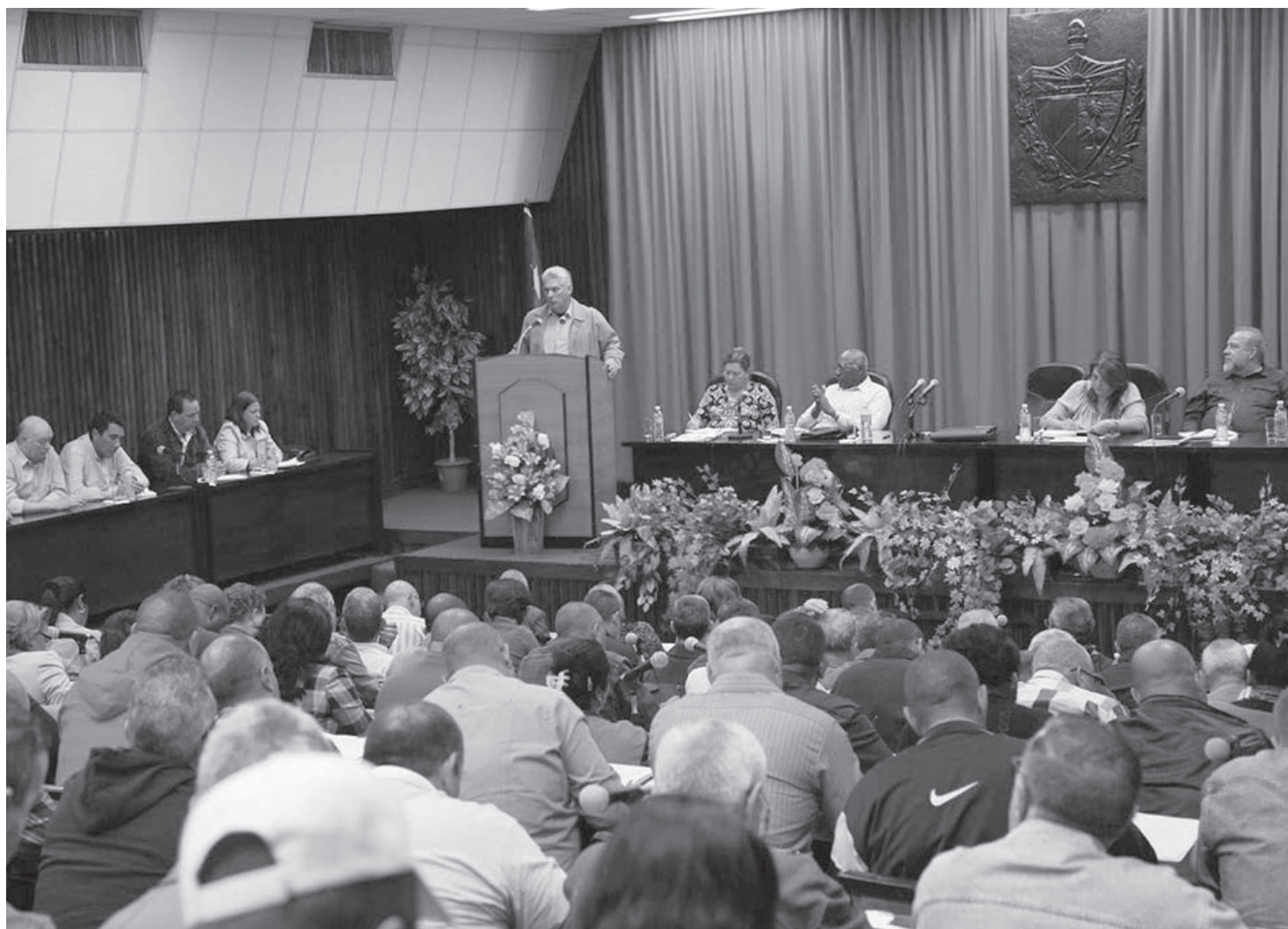
En las conclusiones de la visita, Díaz-Canel se refirió a las potencialidades del territorio para seguir avanzando en la batalla económica.

Las 25 viviendas autofinanciadas que prevé construir este año la Empresa Agroindustrial de Granos Sur del Jíbaro con su propia