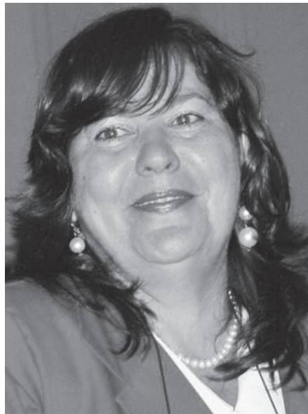
Teresita Romero Rodríguez, gobernadora.

Asimismo, ha aplicado métodos y estilos de trabajo que le han permitido avanzar en los diferentes programas que por su cargo le corresponde impulsar. Su desempeño ha permitido el desarrollo socioeconómico de la provincia, un mejor funcionamiento de la Asamblea Provincial del Poder Popular y el logro de una estrategia comunicacional acorde con las indicaciones emitidas por la Asamblea Nacional.