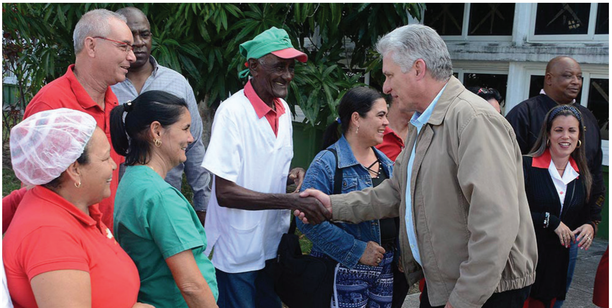
Díaz-Canel intercambió con los trabajadores de varias entidades y con el pueblo de Sancti Spíritus.