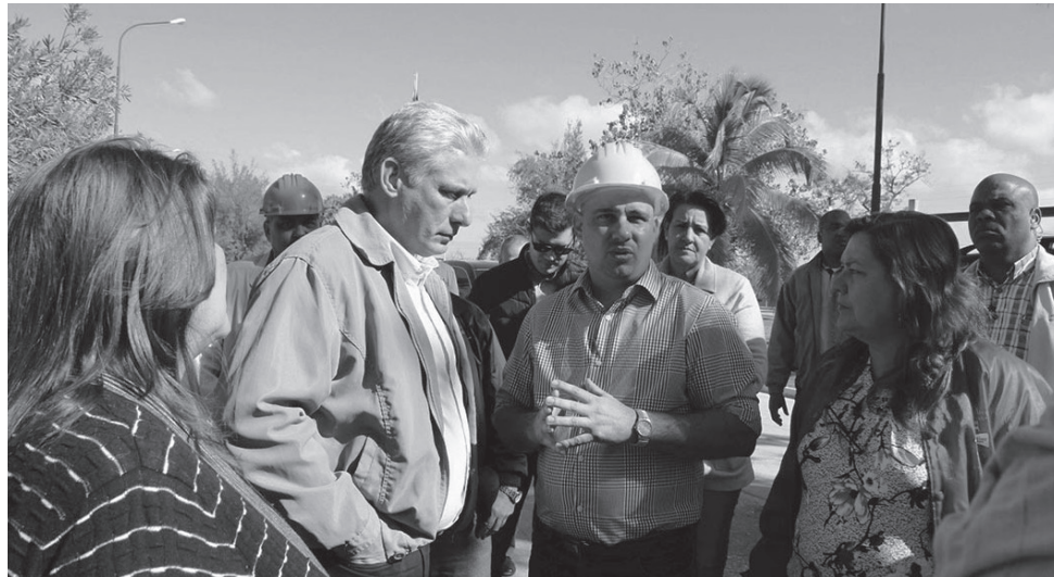
En la Empresa de Cemento Siguaney Díaz-Canel conoció sobre el proceso de modernización de la planta.