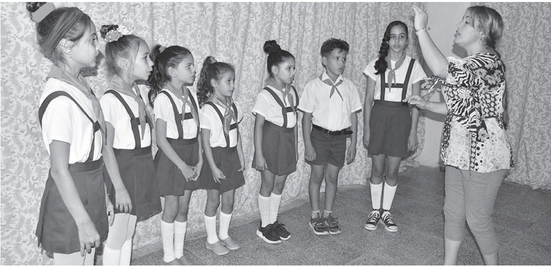
El coro Voces del mañana obtuvo el segundo lugar en el festival provincial ¡Cuba, qué linda es Cuba!