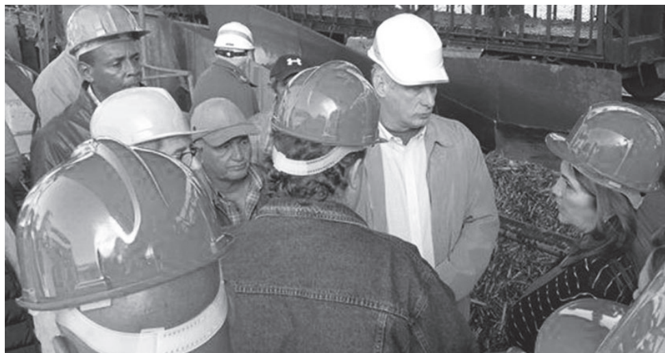
El recorrido incluyó el central Uruguay, comprometido con lograr una zafra eficiente.

Al término de su segunda visita al centro, el Presidente reconoció que los problemas estructurales de la institución crean situaciones de hacinamiento al personal y sugirió adelantar estudios, proyectos o valorar otro posible local para, cuando las circunstancias lo permitan, acometer una inversión que termine con ese impedimento.