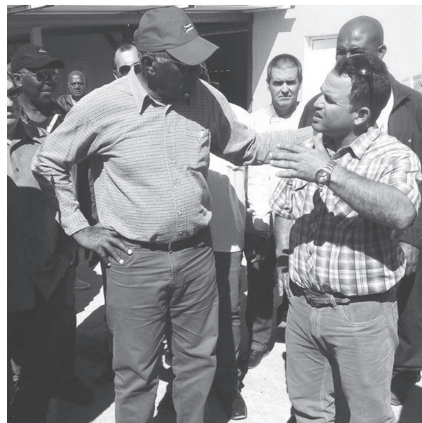
Valdés Mesa sostuvo un amplio diálogo con pescadores de Casilda.

Tenemos que desarrollar proyectos que aporten a la economía, la producción y la sustitución de importaciones a partir de las posibilidades internas del país sin tener que esperar por el financiamiento exterior, resaltó Valdés Mesa.