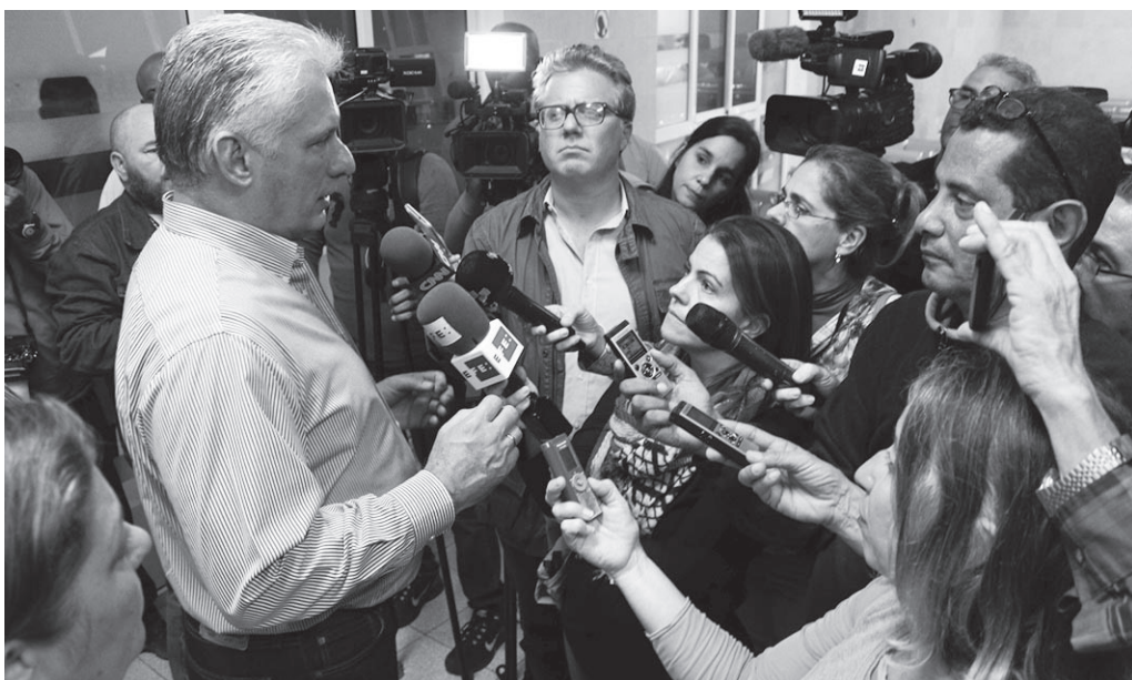
Díaz-Canel aseguró que el país está preparado para enfrentar momentos difíciles.