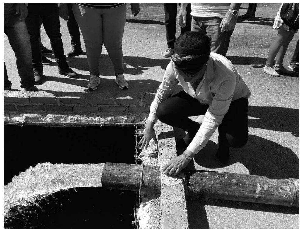
La Viceprimera ministra llamó a seguir avanzando en las obras de abasto de agua en la villa trinitaria por su importancia para la población y el desarrollo del turismo.

En la Dirección Provincial del Instituto de Planificación Física, Chapman le pidió al colectivo trabajar más para eliminar la demora y el peloteo de los trámites solicitados por la población, pues al cierre de diciembre sumaban más de 400 procesos fuera de término.