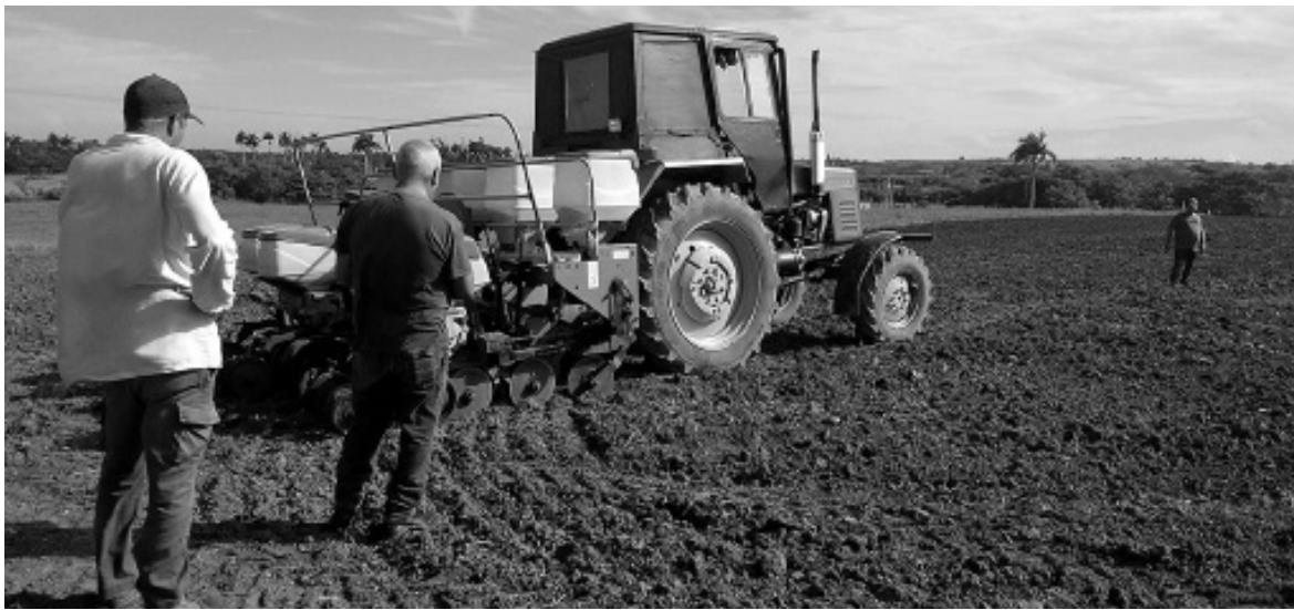
Los campesinos de Jarahueca desarrollan la siembra del maíz y la soya transgénicos con sus propios equipos y recursos.