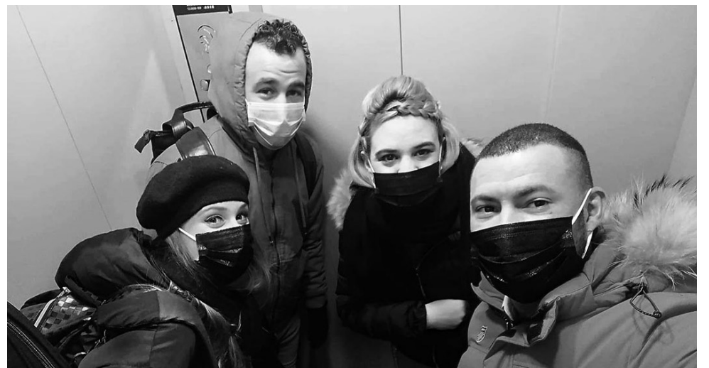
Los cubanos que laboran en China siguen estrictamente las medidas orientadas.

Mientras tanto, otra noticia circula ahora mismo en las redes digitales: China confirma la muerte del médico que alertó sobre el coronavirus.