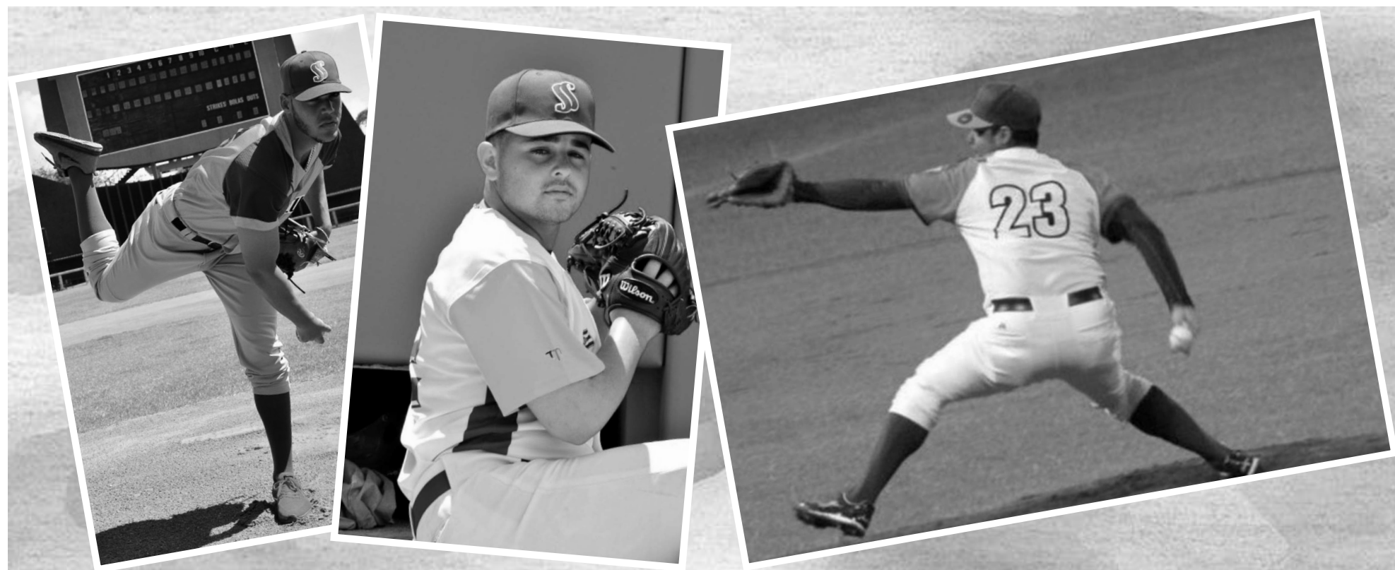
Las lesiones han hecho mella en el staff espirituario desde hace varios años.