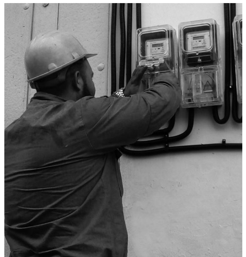
La mayor potencialidad para el ahorro está en el horario pico.

El director de la Onure señaló que las medidas de ahorro implementadas con anterioridad en el sector estatal han propiciado enmarcar los gastos en las partidas fijadas y, el hecho de que actualmente todas las actividades están incorporadas a la producción y los servicios, es indicativo de la vitalidad económica del país, pero resulta necesario evitar sobregastos de electricidad.