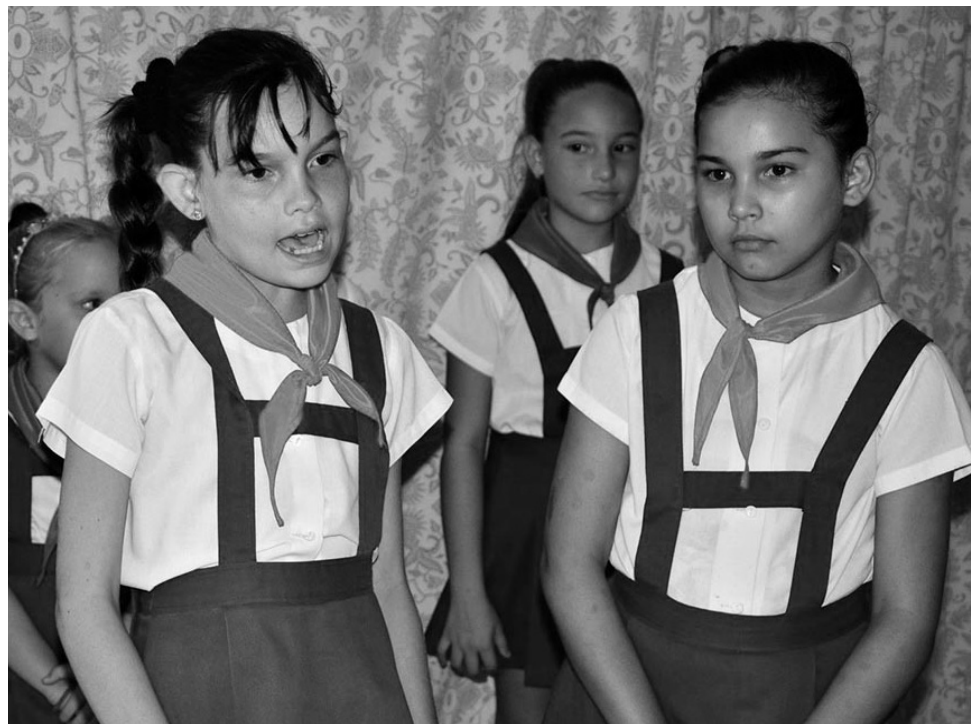
Algunos de los niños que integran los talleres se convierten luego en estudiantes de las escuelas de arte.

Según reza en su misión, las Casas de Cultura son instituciones encargadas de generar de manera permanente procesos de desarrollo cultural, destinado a la preservación, transmisión y fomento de las muestras artísticas y culturales propias de la comunidad. Valga apuntar que de recuperar el funcionamiento de los talleres de repentismo en la provincia también depende que las Casas de Cultura sigan cumpliendo no algunos, sino todos sus objetivos fundacionales en pos de las tradiciones y la identidad cultural, puntales que marcan destinos sensibles de la nación cubana.