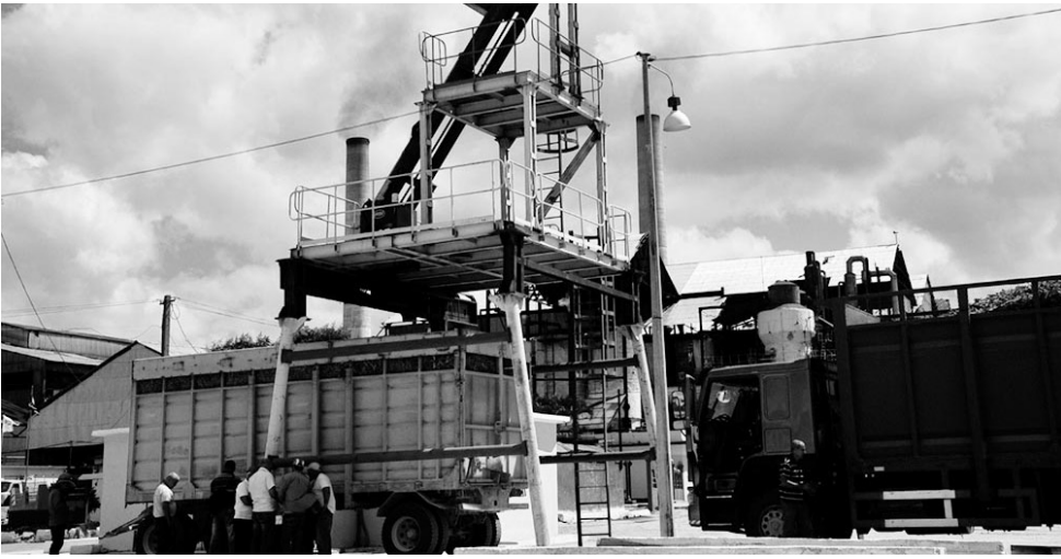
El central Uruguay logró producir el azúcar planificado para el mes de enero.