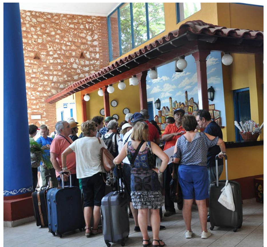
El arribo de turistas extranjeros creció el pasado año en Sancti Spiritus.

A ello se suma la rehabilitación de una de las piscinas del Memories Trinidad del Mar, la mejoría de las áreas de playa y sus puntos náuticos con la restitución o la asignación de nuevos medios propios de estos servicios, y la reparación de las embarcaciones de la Marina Marlin Trinidad.