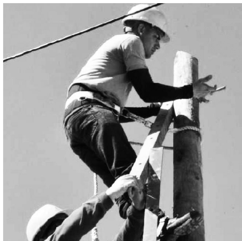
Importantes inversiones han beneficiado a los espirotuanos con nuevas prestaciones telefónicas.

Olivos I Olivos II Olivos III Camino de La Habana Empresa de Materias Primas (salida hacia Trinidad) Jobo Gordo 23 de Diciembre Banao Reparto Toyo Reparto Escribano El Rastro Mayajigua Venegas