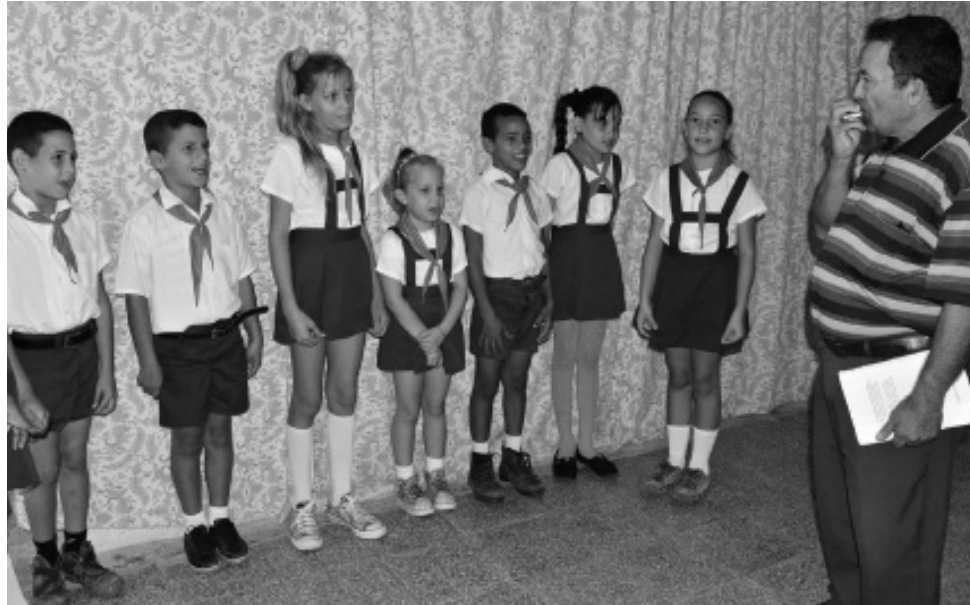
El taller especializado de repentismo infantil de La Sierpe carece de un instrumento de cuerdas que acompañe su repertorio.

Él describe la planificación de sus clases con pleno dominio, mas, también expresa la valía de los libros Método Pimienta y Teoría de la improvisación poética , del escritor y repentista Alexis Díaz-Pimienta; ejemplares que recibieron los asistentes al taller para profesores que sesionó en Sancti Spíritus