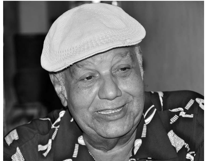
Llanes se convierte en el segundo escritor espirituable que conquista este importante premio.

La curadora de Los sueños de la razón quiere trabajar conmigo en dos series que tengo en proyecto. La más terminada es sobre quinceañeras y la otra sobre contraluces, pero con personas. Por ahí andaré en este 2020, sin abandonar jamás la idea de un regreso a la galería espirituable.