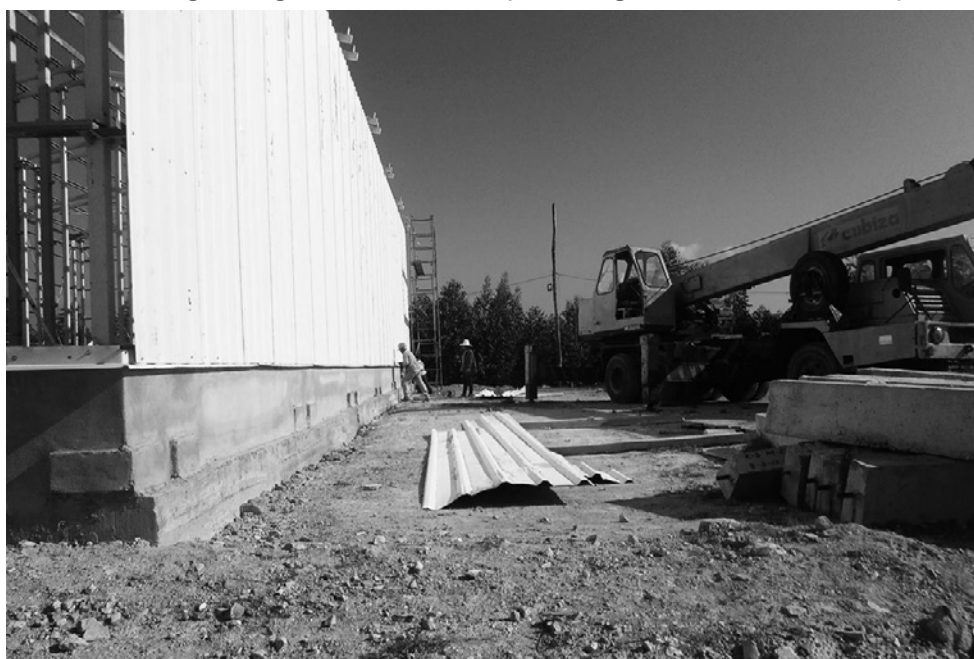
Constructores se encuentran en la fase de montaje de las estructuras metálicas de tres de las naves de la escogida de Jíquima.

En este caso se trata de no permitir que alguien intente torcer el tabaco antes de que llegue al despalillo y darle valor de uso a una inversión que mucho reportaría a la economía para la siguiente recolección de tabaco tapado, modalidad en la que Sancti Spiritus se codea, al igual que en la de sol en palo, entre las principales productoras del país y que podrá aportar en una campaña unas 300 toneladas de tabaco con una calidad inmejorable. Al mismo tiempo, representa una valiosa fuente de empleo para alrededor de 250 personas, muchas de ellas mujeres.