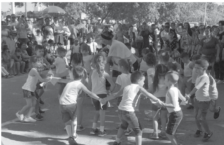
Actividades diversas se desarrollarán en este contexto.

El escenario será propicio para reconocer la labor de quienes se