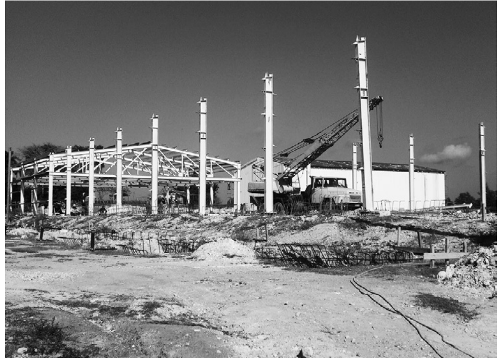
La falta de grúa para el izaje en algunas ocasiones ha limitado el avance de la obra.

A frota limpia los hombres de la Brigada No. 1 del Micons dan los puntos finales al piso de cemento de una de las naves de cura y de escogida que tendrá el complejo dedi-