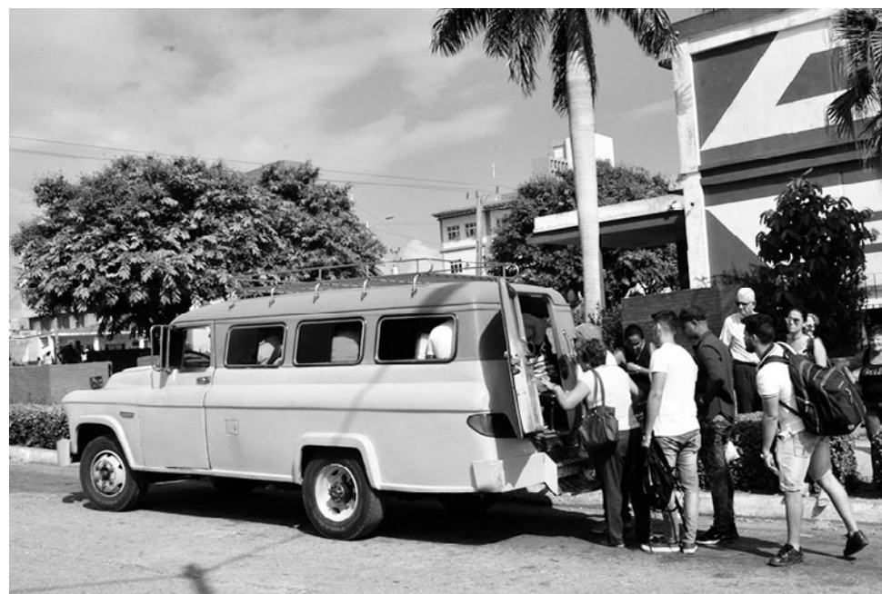
Los autos particulares contribuyen de manera significativa al traslado de pasajeros.