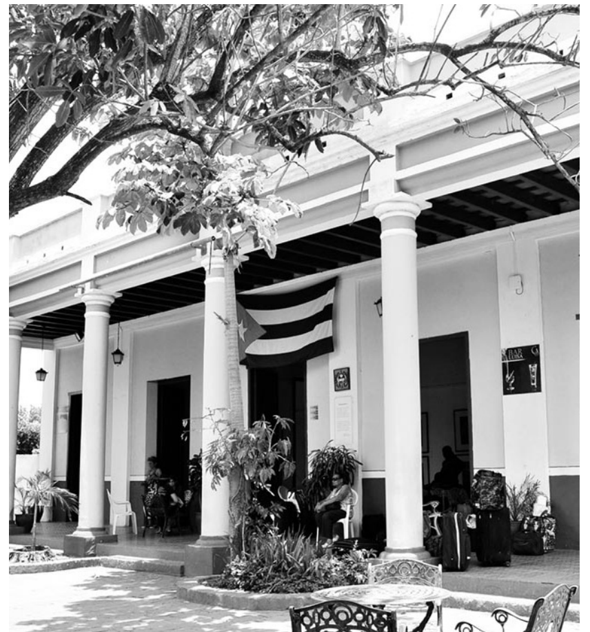
Este reconocimiento enaltece el quehacer de la Casa de la Guayabera a favor del desarrollo sociocultural del territorio.