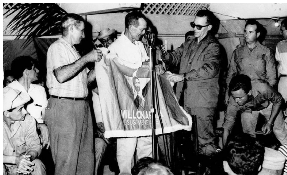
El dirigente estaba atento a los resultados en cada frente de trabajo.

“Era muy dado a oír a las personas —acotó Arbey Pérez—, incluso daba la oportunidad de discrepar, pero trataba de convencerse con argumentos, eran métodos muy valiosos para el trabajo del Partido. Por su forma de actuar, de tratar a las personas, se ganó al pueblo completo, para mí Faustino fue una escuela”.