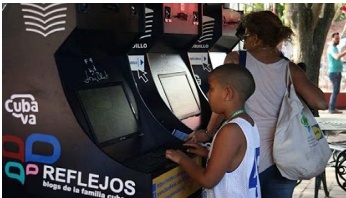
La Feria Tecnológica La Guayabera 5.0 pretende convertirse en un encuentro para socializar experiencias que funden las comunicaciones y la cultura.

Así definió Fidel al Comandante Faustino Pérez Hernández, espirituario cabal, quien asumiera importantes misiones desde el Granma hasta la clandestinidad. Su capacidad para relacionarse con el pueblo, su vocación por el trabajo, su integridad y sus profundas convicciones lo llevarían más tarde a cumplir otras tareas de primer orden después del triunfo