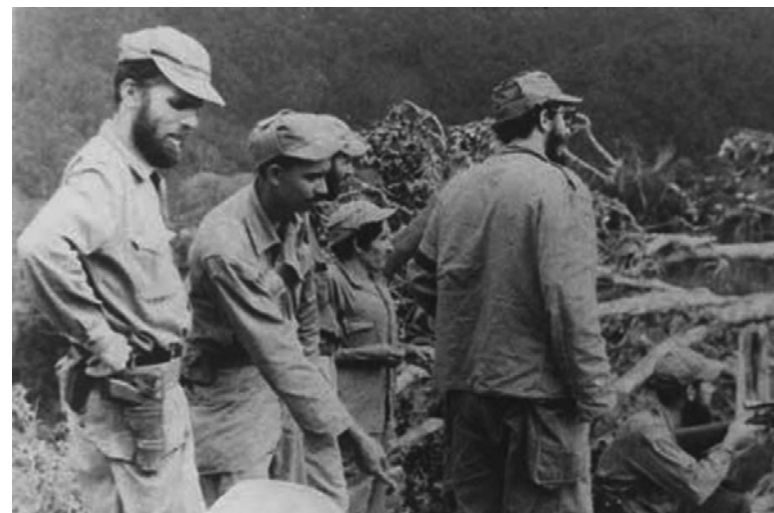
En la Sierra Maestra junto a Fidel y otros combatientes.