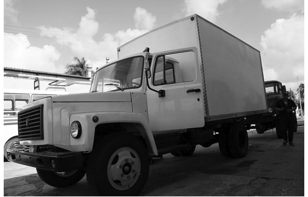
Como este furgón, salido de la unidad Fabricación de Equipos de Carga y Personal y óptimo para el traslado de productos secos, hay en proceso más de una decena.