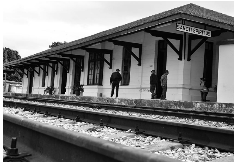
Varios trabajos deben ejecutarse en la estación espirituaña antes de la salida del nuevo tren.

“A fin de darle seguridad al movimiento del tren —refirió— hay que reparar el tramo ferroviario entre Guayos y Sancti Spíritus, que está en muy mal estado; existe un levantamiento de lo que se necesita realizar y se nos va a apoyar con brigadas del sector de otras provincias; asimismo, hay que desbrozar la maleza que invade la vía férrea entre el Combinado Lácteo y Tuinucú, y lo más complicado a resolver son las ilegalidades constructivas en la ciudad alrededor de la vía y el