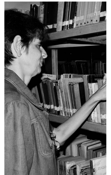
La Ascubi desarrolla una importante labor a favor de la lectura.

reconocieron varias delegaciones de base del territorio y la Biblioteca Provincial Rubén Martínez Villena entregó al proyecto Alas por la vida , de la Biblioteca Pública de La Sierpe, el Premio Salvador Bueno, lauro que confiere anualmente la Biblioteca Nacional de Cuba José Martí y el Programa Nacional por la Lectura y la Cultura a la mejor actividad, proyecto o espacio de Promoción de Lectura.