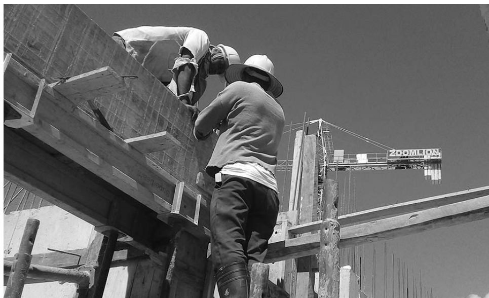
El proceso inversionista ha mostrado atrasos en varias obras del Turismo.

En el caso del Hospital General Provincial, para el 2019 se destinaron 1 800 000 pesos con destino a la cocina-comedor, de ello solo