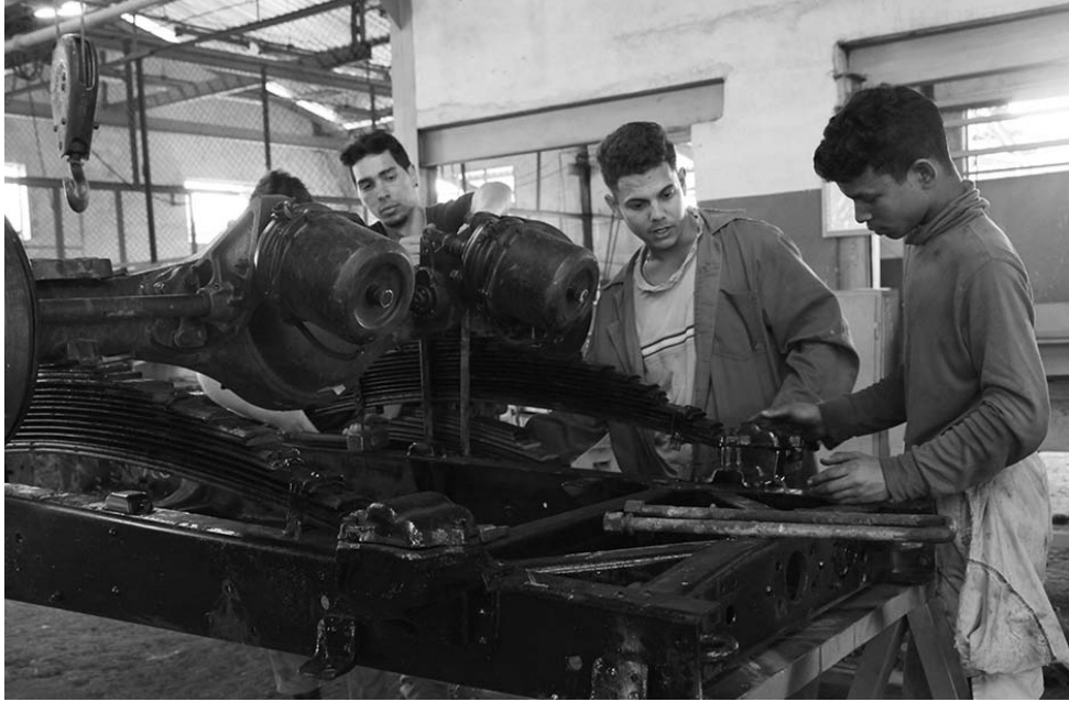
Personal mayormente joven acomete labores de reparación general, modernización, remotorización y servicios técnicos a vehículos.

Ejemplo de perseverancia, la Empresa Militar Industrial espirituana motivó al mandatario cubano, en su reciente visita a la provincia, a asegurar que en Cuba es posible lograr cualquier propósito