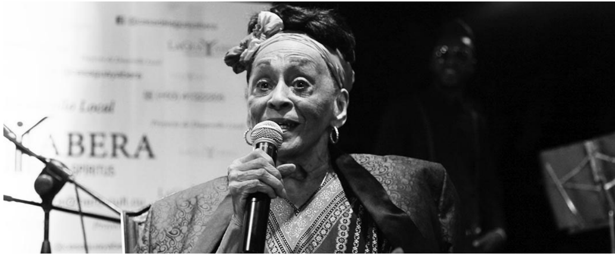
La prestigiosa cantante deleitó a los espirituanos en la Casa de la Guayabera.