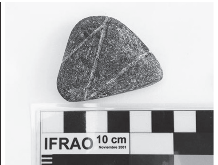
Muestras de las piedras halladas en el sitio conocido como Laguna de Cantarrana II, de La Sierpe.