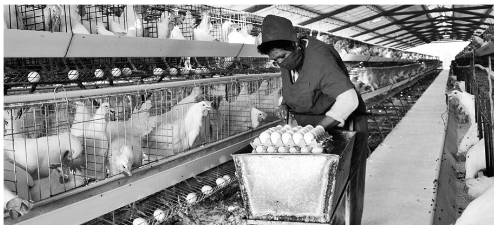
Más de 72 700 espirituanas se vinculan a labores económicas diversas.