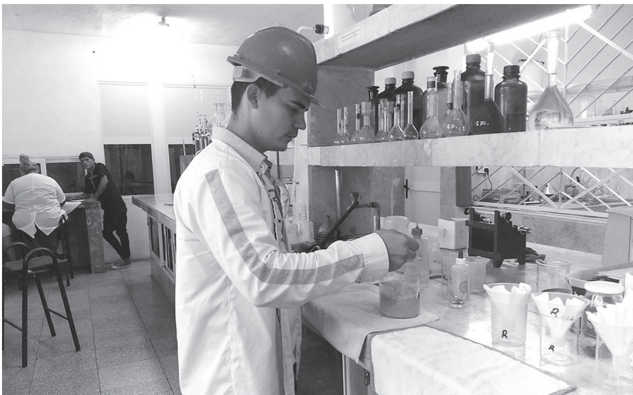
El joven se desempeña como jefe de turno integral en el coloso jatiboniquense.

Las muestras encontradas en cada uno de los descubrimientos arqueológicos en Sancti Spiritus, tras su identificación, estudio y clasificación, son avaladas por el Gabinete Arqueológico de la Oficina del Historiador de La Habana para formar parte de las colecciones de los museos en nuestro territorio.