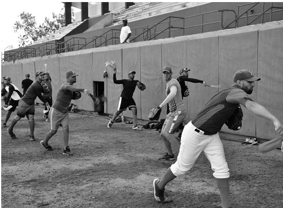
El entrenamiento sistemático constituye una de las claves de la preparación.

Y aunque se manifestaron opiniones discrepantes como extender la cantidad de partidos de la segunda etapa, hacer coincidir la Sub-23 con la Serie Nacional y que se decida un campeón de los primeros 75 partidos, y..., al final todos levantaron la mano para aprobar por unanimidad la nueva propuesta.