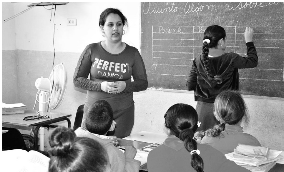
El impacto del incremento de salario ha sido apreciable en el sector educacional.

Ello equivale al 22.4 por ciento de la fuerza ocupada del territorio y se han beneficiado todos: los trabajadores de los Organismos de la Administración Central del Estado, de los Órganos Locales del Poder Popular, de las