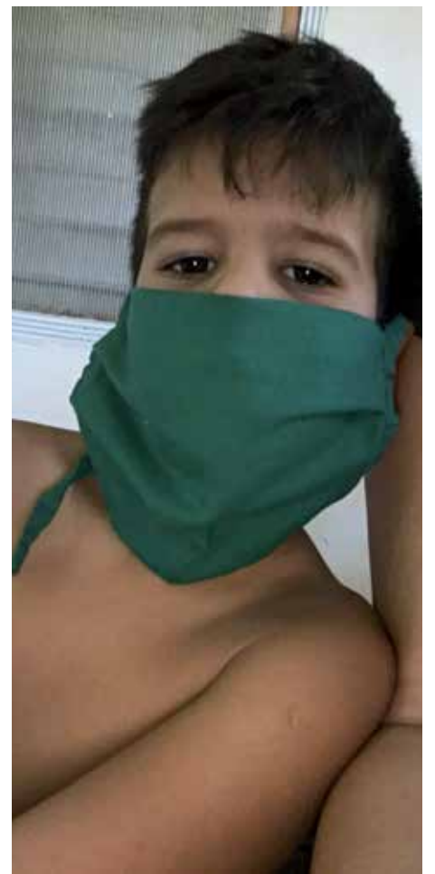
En el ingreso Yerik también aprendió a llevar el incómodo nasobuco.

Lo asumió sin titubeos desde que le dijeron que debía cambiar de trabajo: del servicio de Urgencias del Hospital Pediátrico Provincial José Martí Pérez al Hospital Provincial de Rehabilitación. Y lo único que le preocupó entonces fue cómo ganarse al pequeño que al principio apenas hablaba al verlos forrados de verde; fue un reto y para eso, tal vez, buscó aliados insospechados.