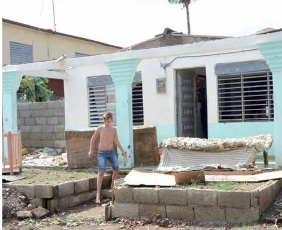
Al día siguiente los pobladores aprovecharon el sol para orear colchones, libros y efectos electrodomésticos que se empaparon con la lluvia.

Ya el diluvio se cernía sobre los cerca de 400 domicilios, que acogen a unas 1 220 personas. Según los últimos reportes, 112 de las moradas resultaron dañadas en sus techos; seis de ellas de forma total.