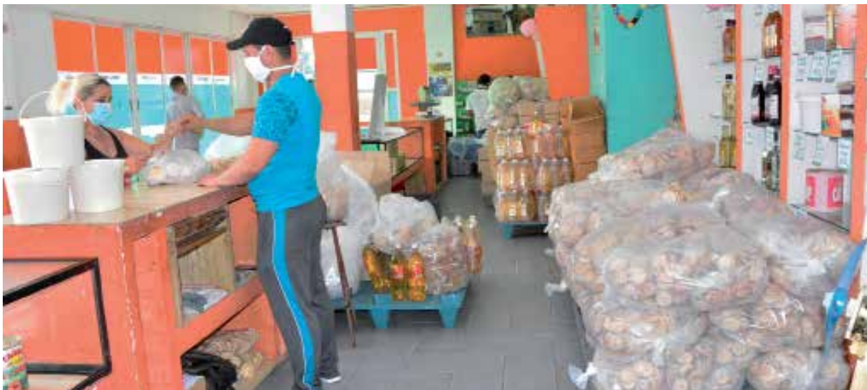
La Casiguaya pone en práctica medidas para la comercialización equitativa de los productos.

En cuanto a los trabajadores por cuenta propia, tampoco se encuentran desprotegidos, pues, además de recibir beneficios tributarios, tienen la posibilidad de presentarse en las direcciones de Trabajo a solicitar nuevos empleos o la protección de la Seguridad Social si sus ingresos resultan insuficientes.