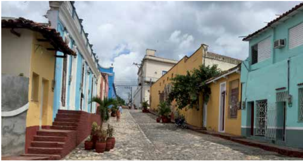
Con motivo del cumpleaños, se ejecutan acciones de conservación en el Centro Histórico.