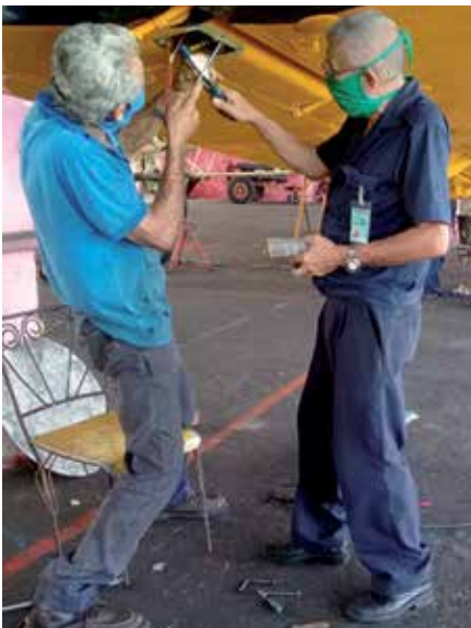
Cuando concluyan todos los trabajos, la flota aérea estará en mejores condiciones técnicas.

El bajo almacenamiento de agua en la presa Zaza no solo impacta negativamente en la producción de arroz, sino que también deja su desfavorable huella en la flota espirituana perteneciente a la Empresa Nacional de Servicios Aéreos (ENSA), con la reducción a la mitad de las horas de vuelo este año en función de su principal cliente, toda vez que la aviación agrícola interviene en más del 90 por ciento de las labores en el cultivo del cereal.