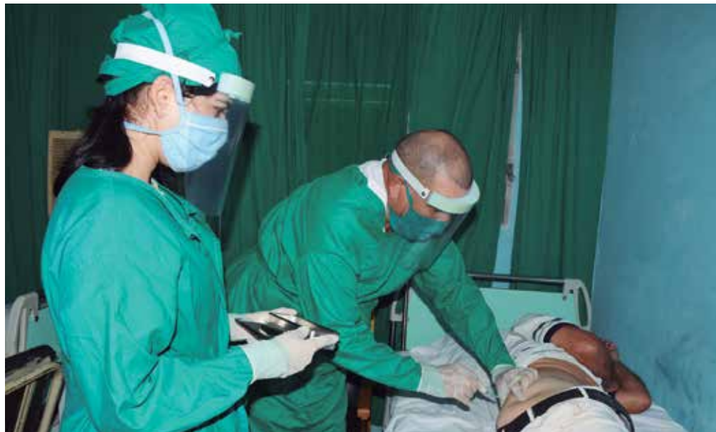
Este medicamento ayuda a elevar las defensas del organismo.

También se ha acondicionado en cada una de las instalaciones sociales de la provincia una sala aislada para aquellos internos que presenten manifestaciones respiratorias y quienes lo requieran se trasladan hacia el Hospital General Provincial Camilo Cienfuegos, donde existe una sala destinada para los casos respiratorios.