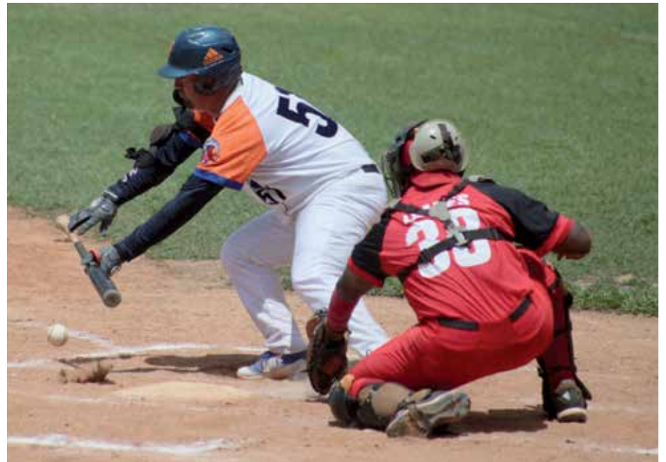
La fecha del comienzo del clásico nacional aún está por definirse, pero pudiera repensarse la variante de regresarla a noviembre.