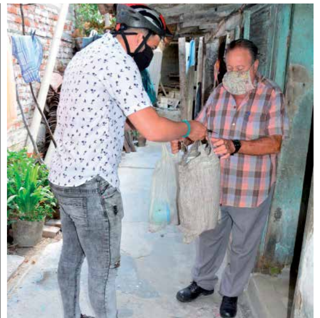
Trabajadores del municipio espirituario han sido reubicados como mensajeros para ayudar a los más vulnerables.

El caso es que en cualquier municipio espirituario los comerciantes de una u otra rama de Comercio se mantienen activos llueva, truene o relampaguee, para garantizar que la leche, el pan, el café o cualquier otro surtido llegue oportunamente al consumidor. Quizás los aplausos de cada noche también puedan extenderse a los trabajadores de este sector, esos que pasan horas y horas detrás de un mostrador.