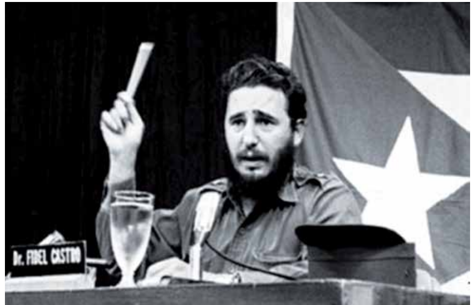
El líder de la Revolución cubana en los días de sus Palabras a los intelectuales .

De la intervención del Comandante en Jefe, raras veces suele citarse otra expresión: "La Revolución solo debe renunciar a aquellos que sean incorregiblemente reaccionarios,