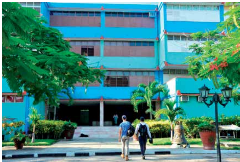
La disposición del centro será válida para todas las modalidades de estudio.

Por otra parte, la Uniss ha modelado sus procesos en función de evitar, una vez reiniciado el curso escolar, las aglomeraciones de estudiantes y profesores en cada uno de sus espacios.