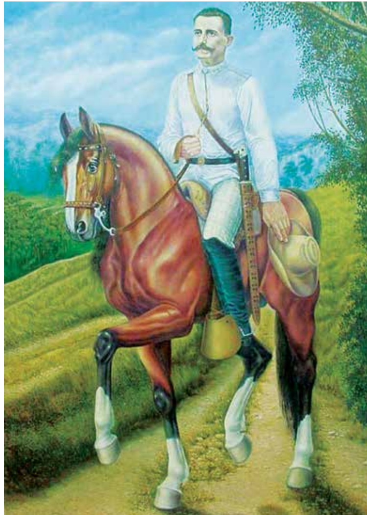
Sus coterráneos lo imaginan a caballo, como cuando formó parte de la tropa de Agramonte.

de un fiero combate en ver vivo al inigualable Ignacio Agramonte, de quien ganó plena estimación y confianza; haber participado junto al excepcional dominicano en la primera invasión a Las Villas, en 1875, y permanecer al margen de las manifestaciones de regionalis-