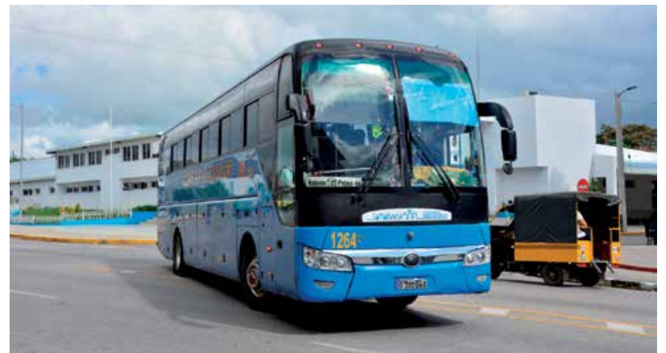
Varias rutas de Ómnibus Nacionales se reanudarán a partir del próximo miércoles.

Los ómnibus viajarán a plena capacidad, sin recogida en tramos intermedios y cumpliendo el protocolo sanitario previsto. La Terminal de Sancti Spíritus estará abierta solo para los que posean reservación, no habrá lista de espera y a partir de este viernes comenzará también la venta de pasajes online, a través de la aplicación VIAJANDO. En dicha instalación se realizará el pesquaje a quienes arriben de otras provincias.