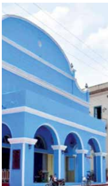
En todas las instituciones culturales se mantendrán las medidas higiénico-sanitarias.

"Ni en esta segunda fase ni en la siguiente se han previsto propuestas de gran convocatoria, por ello se suspendieron las fiestas populares y solo podremos visitar aquellos centros donde se pueda regular la entrada de público", insistió finalmente el directivo.