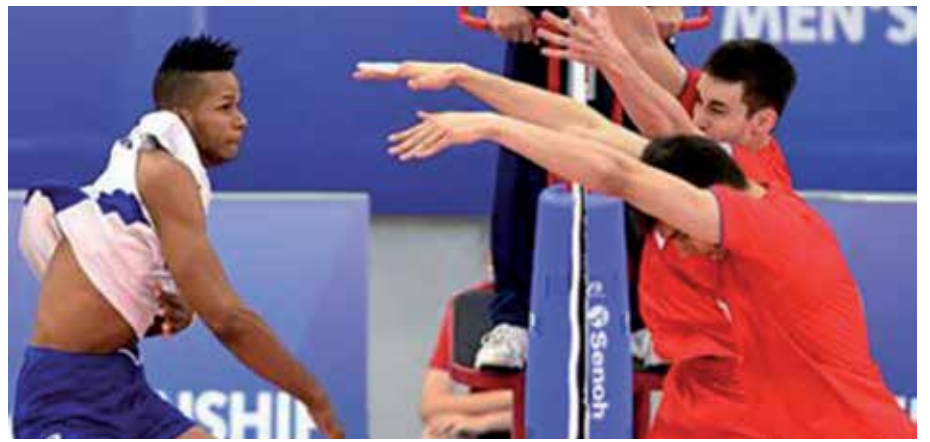
Melgarejo forma parte de la veintena de contratos que concilia el voli nacional este año.

Queda en su estadio, en su estatua que bien merece recobrar sus colores a la altura del hombre que quebrantó la quietud de la madrugada del 4 de julio de 1974.