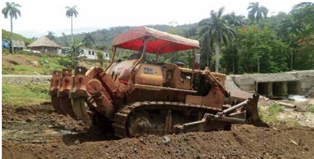
En el Charcón se ejecuta un desvío para no interrumpir el paso de los pobladores con la fundición de una nueva losa.