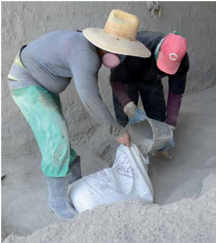
Desde este primero de julio se estableció que el pago de materiales en los puntos de venta se realiza solo con tarjeta magnética.