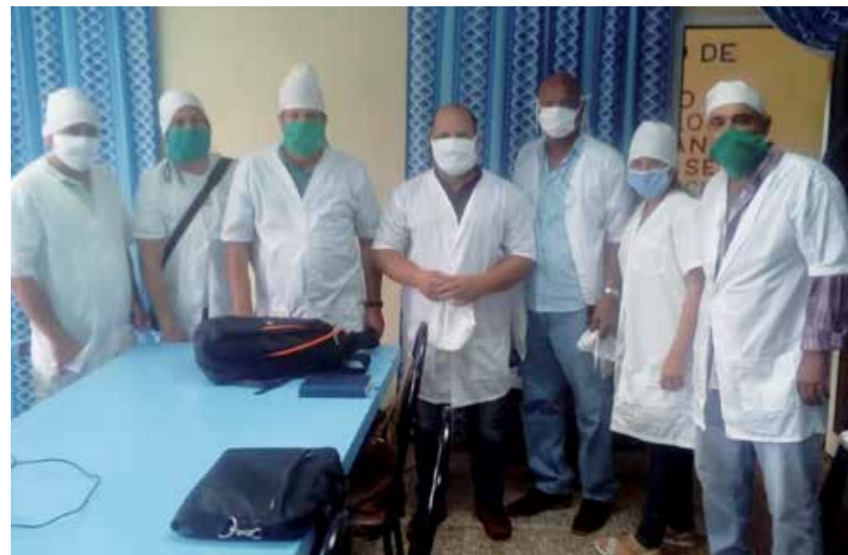
Equipo quirúrgico que asistió a la paciente en el Hospital Arnaldo Milián, de Villa Clara.