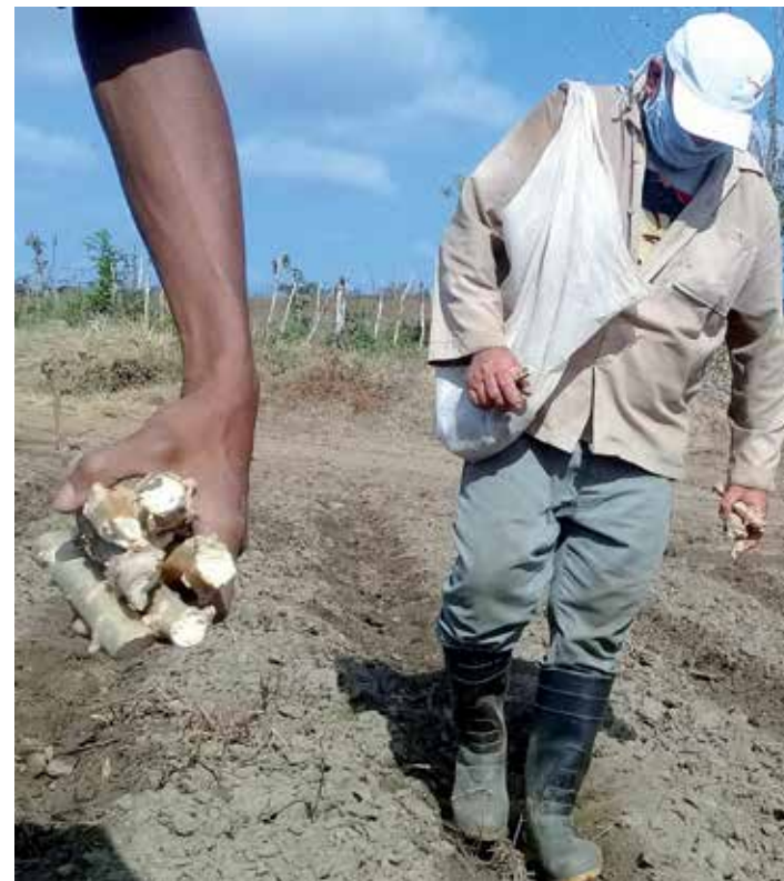
La calidad de la semilla, el uso de los medios biológicos y las atenciones culturales decidirán en los resultados de los cultivos.

No basta con planificar la campaña, se necesita ser sistemático en el trabajo de cada una de las bases productivas, ratificó González Nazco y agregó: “Nos enfrentamos a condiciones del clima que a veces son adversas y debemos evitar los atrasos, atender más a los productores; pero hay que contratar, controlar y supervisar todas las actividades para lograr que las producciones lleguen al destino planificado”.