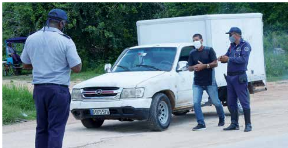
Se mantienen funcionando 12 Puntos de Control Sanitario en las fronteras del territorio.