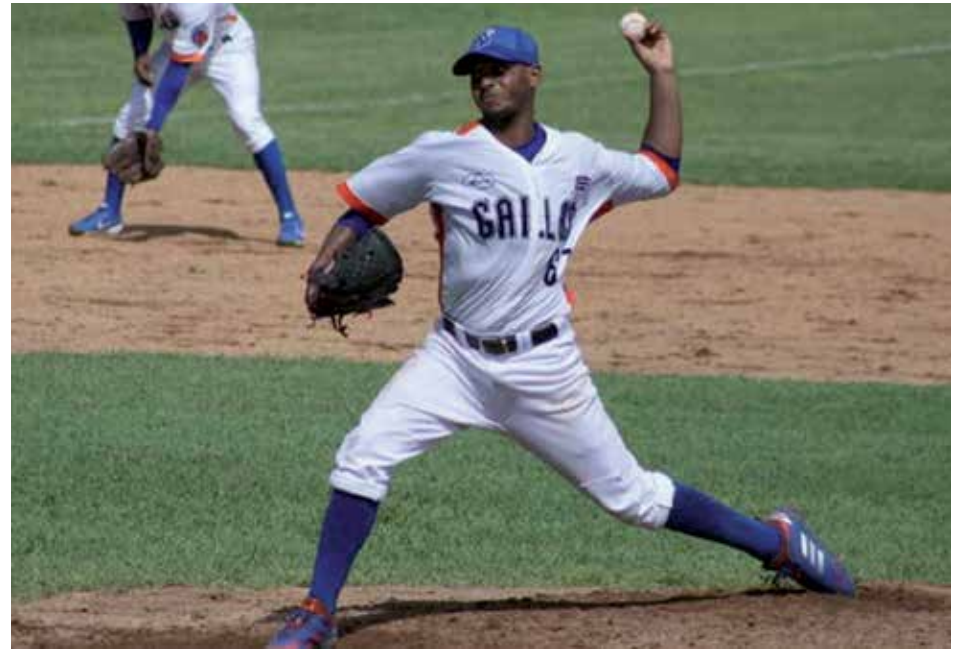
El zurdo espirituario asegura que seguirá luchando por su equipo.

Todos los lanzadores no son iguales, unos se cansan con menos y otros con más lanzamientos. En mi caso, mientras van pasando los innings como que me voy calentando y puedo llegar a 120 y hasta un poco más, aunque ahora al principio sí nos deben regular porque no debemos llevarnos por las emociones, ni el impulso de que estamos ganando y hay que aguantarnos, en ese momento la mente y el cuerpo no sufren, pero el brazo sí, y eso nos puede traer problemas después, porque el objetivo es que nos pasemos los