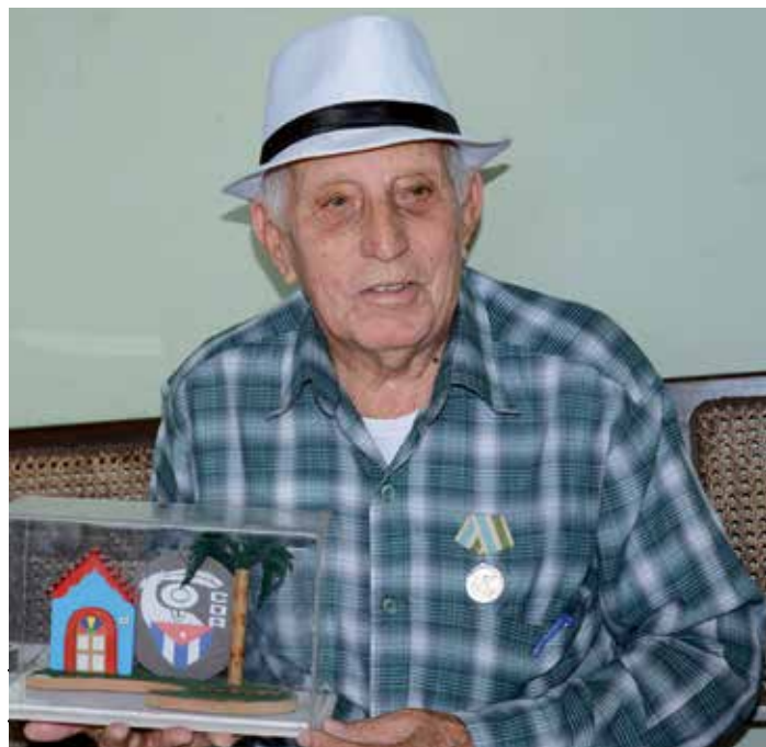
Feliz con el Premio del Barrio de los CDR y su medalla Por la Defensa de la Patria y la Unidad del Barrio.