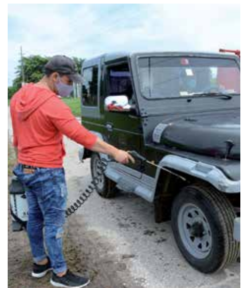
Como parte de las medidas de control, funcionan en la zona dos puntos de desinfección.

Es la estampa que retrata a Venegas de pies a cabeza, aunque ahora mismo luzca tan distinta: la carpa azul a la entrada del pueblo, las calles silentes, las sogas batiendo entre el susto y las casas, como nunca, a puertas cerradas. Venegas parece adormecido, solo parece, porque dentro y fuera mucha gente anda sin pegar un ojo.