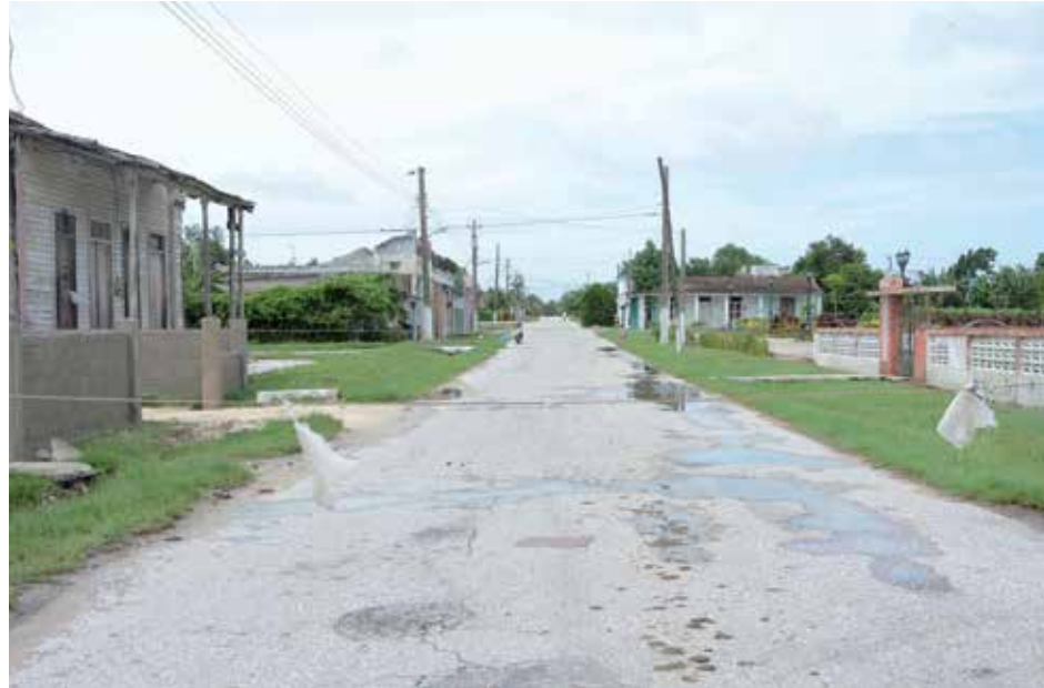
Los pobladores de Venegas enfrentan una compleja situación epidemiológica.