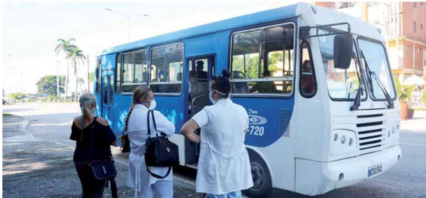
El transporte público fue reabierto en todos los municipios de la provincia.