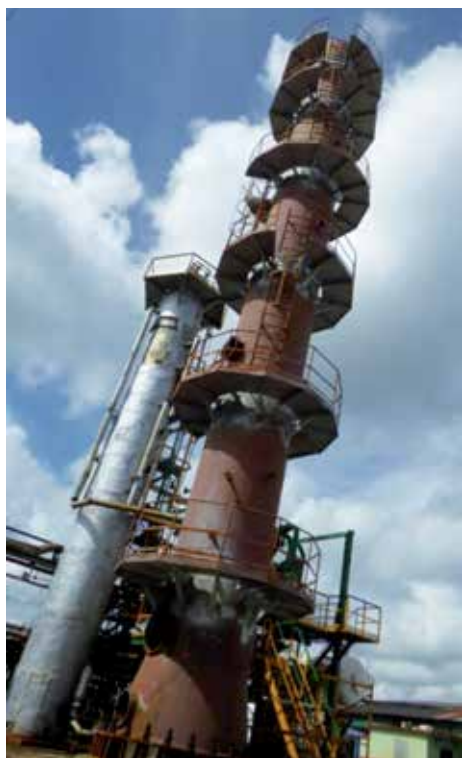
El proceso que se avecina pondrá a prueba la capacidad de reacción del sistema empresarial espirituario.

En la economía nada es absoluto. Sin duda, la unificación constituye condición imprescindible, aunque no suficiente, para reordenar y actualizar nuestra economía, golpeada por una crisis, agravada, como se sabe, por los efectos de la pandemia de la COVID-19 a nivel global y el recrudecimiento del bloqueo del Gobierno de Estados Unidos. Por sí sola, la unificación monetaria y cambiaría no será la solución determinante, la llave maestra para resolver todos los problemas de la empresa; pero sí será esencial para poder ir desatando el nudo gordiano que tiene la economía cubana en la actualidad.