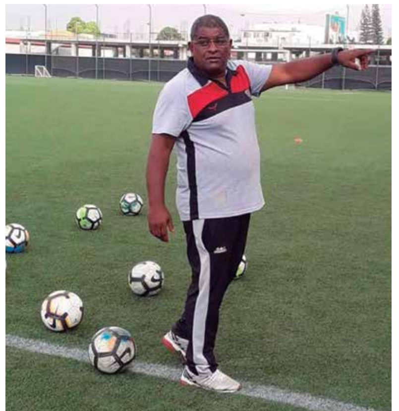
Su experiencia de 30 años como médico ha sido la mejor escuela para esta misión.