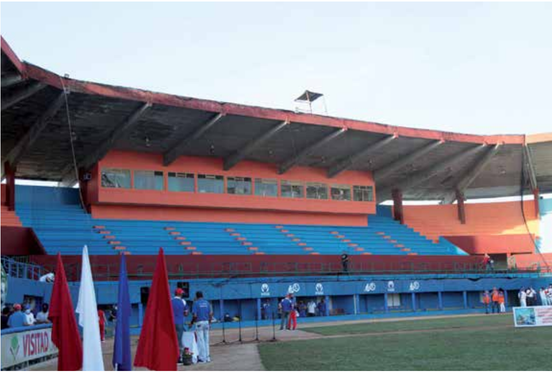
Varias manos se unieron para encontrar colores apropiados en el estadio.