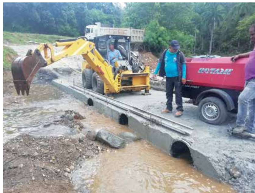
Fuerzas del Micons construyeron el vado que impide que Gavilanes se divida en dos cuando llueve torrencialmente.

De igual modo, los trabajos se extendieron a algunos tramos de los más de 14 kilómetros de camino, donde hubo que hacer excavaciones para nivelar el terreno, se ampliaron las cunetas con más espacio y se reconstruyó el vial en varios sitios donde estaba descarnado. “En total se vertieron allí unos 5 000 metros cúbicos de rocoso, se esparcieron en ambos vados 200 metros cúbicos de hormigón y se utilizaron alrededor de 3 toneladas de acero”, puntualizó Maikel.