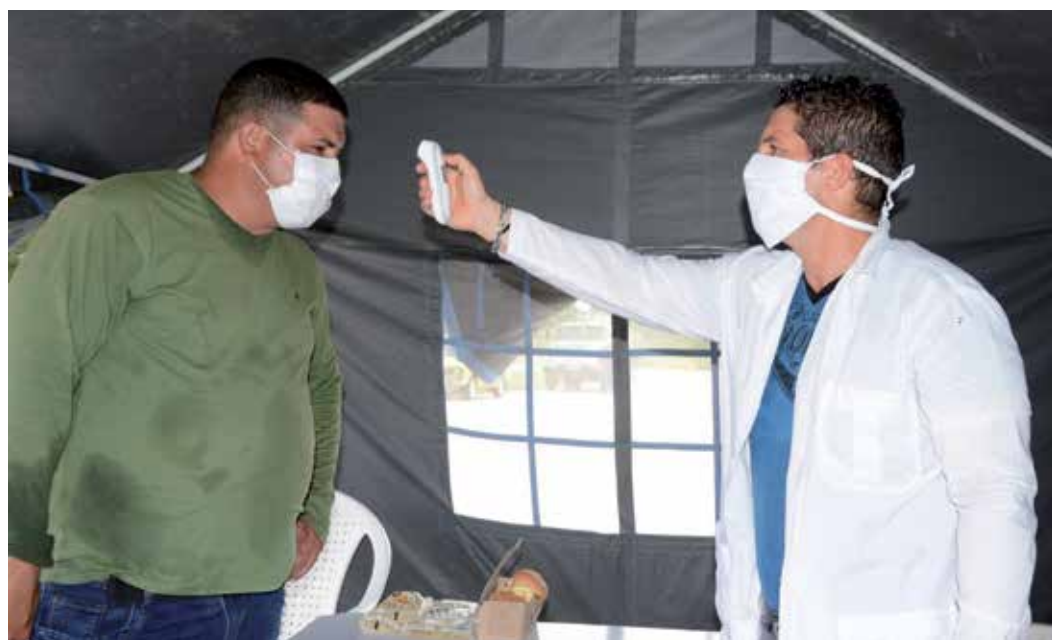
En los llamados puntos de frontera se cuenta con personal sanitario para el control de las personas que entran al territorio desde otras provincias.