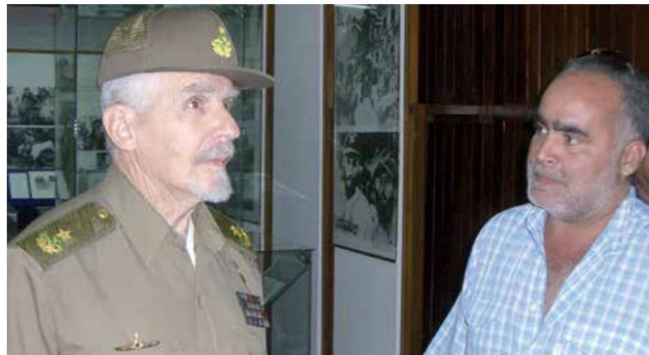
Junto al Comandante de la Revolución Ramiro Valdés Menéndez en una de sus visitas a la institución.

Ha sido un privilegio dirigir el Complejo Histórico; ahora al paso de los años puedo decir que no me asustó dedicar prácticamente mi vida a esta parte hermosa de la Historia de Cuba, porque quizá uno de los más interesados era yo. Desde el día que abrí la puerta para investigar la vida y obra de Camilo y el Frente Norte, no ha existido para mí otro camino; no sé si llegaré un día a ser su soldado, a estas alturas solo me he sentido como un gran ayudante de Camilo.