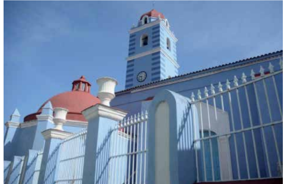
La Iglesia Mayor constituye un símbolo sin par del patrimonio espirituario.