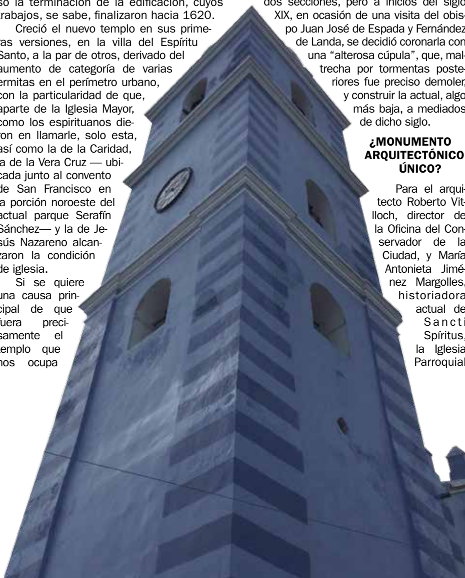
La silueta de la torre constituye un elemento distintivo del paisaje urbano.