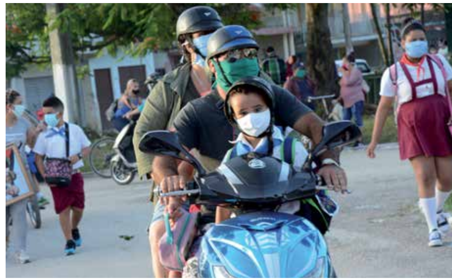
El uso obligatorio del nasobuco fue una de las medidas aprobadas recientemente por el Consejo de Defensa Provincial.

Y nadie es inmune. Deberíamos recriminarnos, entonces, tanta indisciplina, la misma que ha acelerado otra vez los contagios en distintas partes de la isla y que ha puesto a la COVID-19 en reversa.