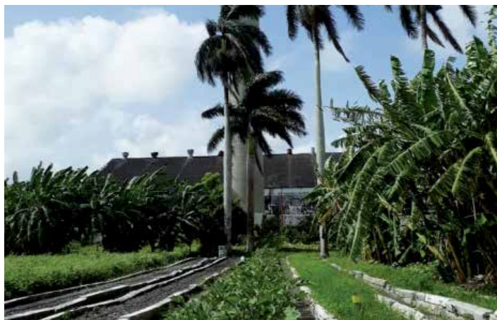
La creación de viveros tecnificados figura entre las acciones del proyecto.

La estrategia de Resiliencia Costera se centra en reforzar una visión integrada de la reducción del riesgo de desastres y la adaptación al cambio climático