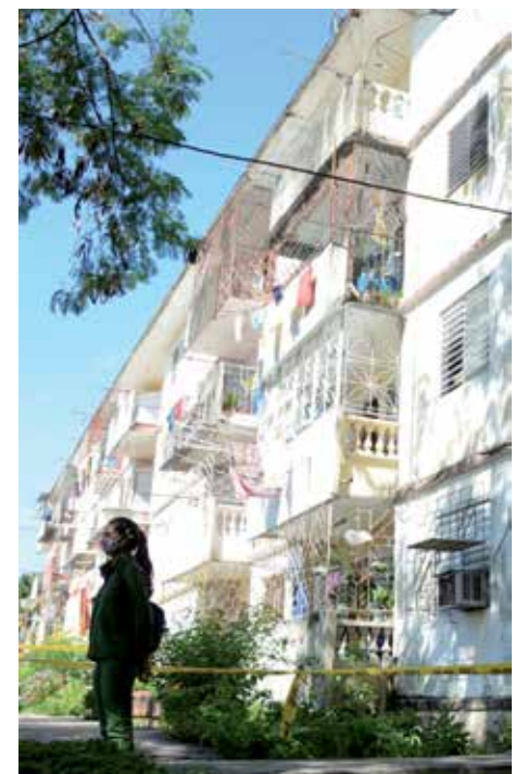
En varias zonas permanece restringido el movimiento de personas.

Sancti Spiritus es una de las dos provincias que en el país han retrocedido a la fase de transmisión autóctona limitada de la COVID-19 y en correspondencia con tal situación se implementan medidas para cerrarle todas las brechas al virus.