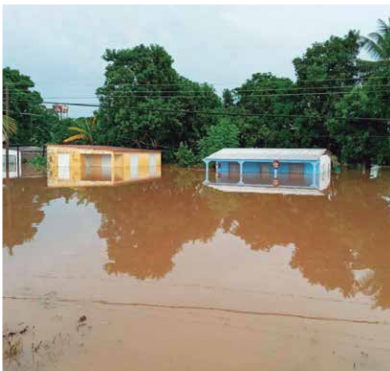
Varias viviendas quedaron bajo agua debido a las inundaciones.