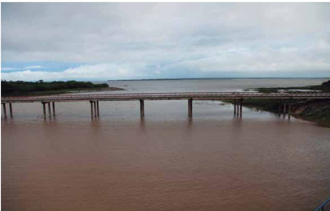
La presa Zaza elevó considerablemente sus volúmenes.