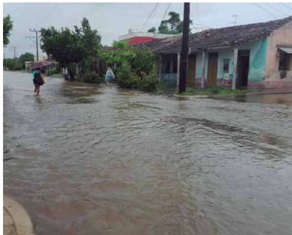
En Casilda se produjeron inundaciones de varias calles a causa de las intensas lluvias.

Las precipitaciones que mojaron Trinidad como consecuencia de la tormenta tropical Eta afectaron cerca de 60 viviendas y provocaron interrupciones del servicio eléctrico en asentamientos rurales, urbanos y montañosos restablecidos en pocas horas; no