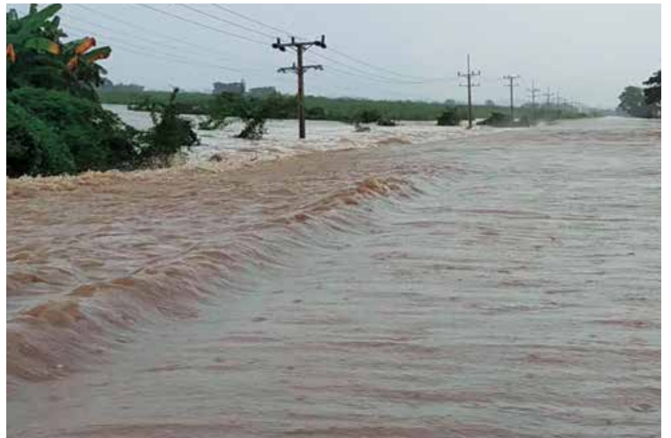
La enorme crecida del Agabama provocó interrupciones del paso entre los municipios de Sancti Spiritus y Trinidad.