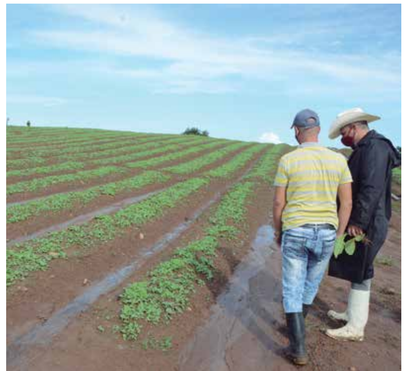
En la agricultura se concentró la mayor parte de las afectaciones.