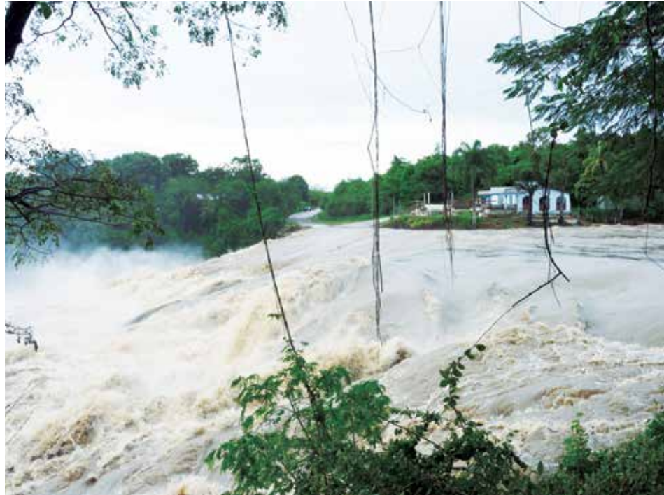
Las lluvias desataron la crecida inusual del Agabama.

Con 37 años allí, asegura que la última gran crecida ocurrió hace unos siete u ocho años. “Aquella vez se podía tocar el agua