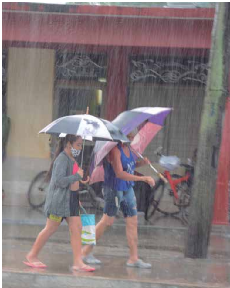
Las precipitaciones ocurridas a raíz del evento superaron con creces el promedio histórico del mes de noviembre.

La presa Zaza, que no recibió grandes aluviones porque su cuenca no aparece con las crecidas y escurrimiento más significativos, se mantiene con 841 millones, al 91 por ciento de sus posibilidades, fijadas en 920 millones por razones preventivas para evitar grandes inundaciones en las comunidades que se ubican por debajo de sus compuertas.