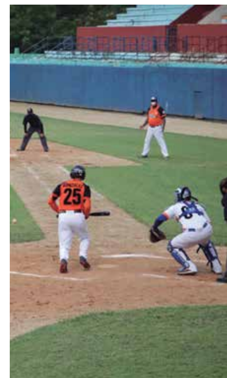
Sancti Spiritus intentará mantenerse en el grupo de los ocho.