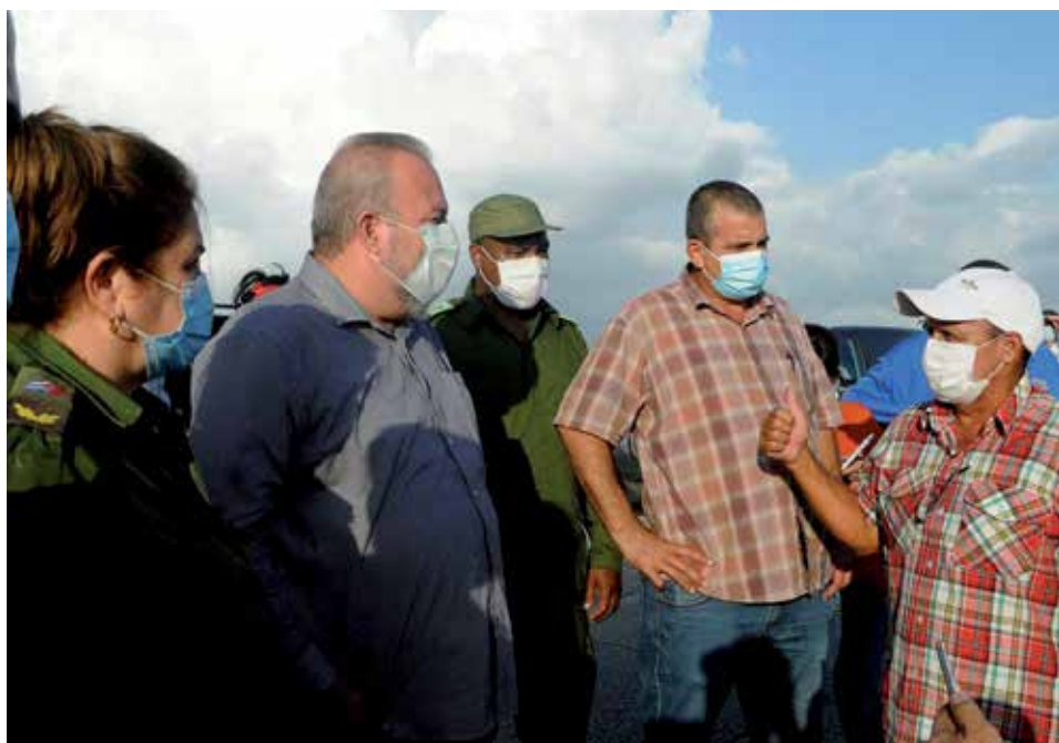
Marrero Cruz constató in situ la magnitud de los daños en la zona sur de la provincia y elogió la celeridad con que el territorio los ha venido enfrentando.

Primer ministro cubano Manuel Marrero Cruz destaca respuesta de los espirituanos a los imponderables creados por la tormenta tropical Eta y llama a no descuidar el enfrentamiento a la COVID-19