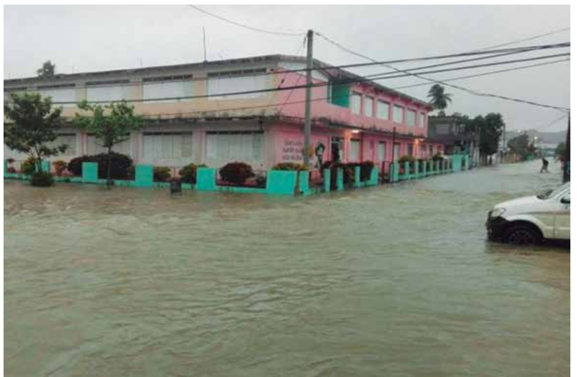
En Yaguajay algunas calles semejaron un río.