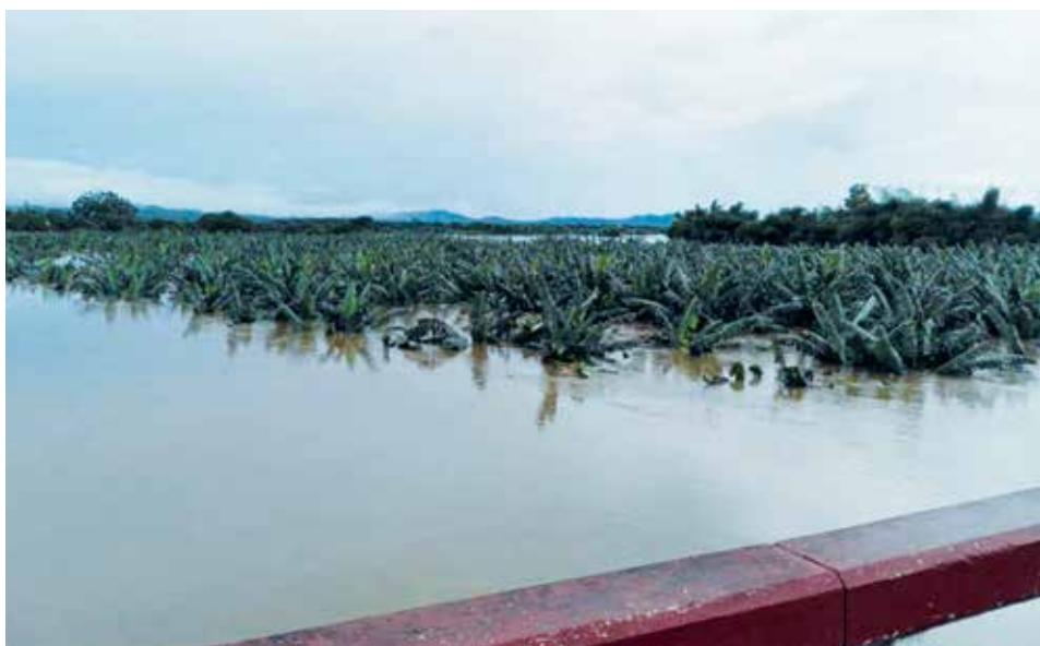
Numerosos cultivos fueron afectados por las lluvias.