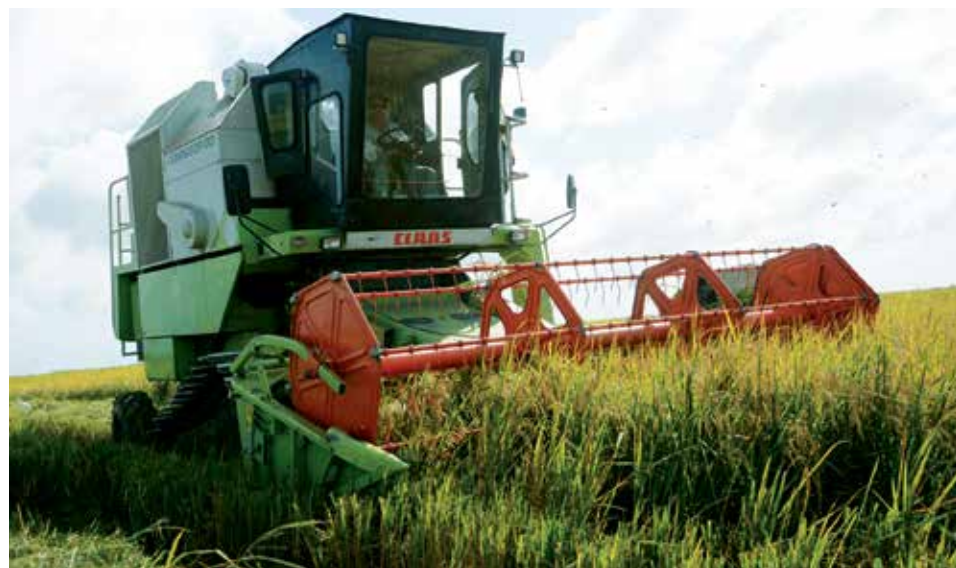
De las 13 700 hectáreas plantadas en la etapa de primavera en Sur del Jíbaro quedan por recolectar todavía unas 5 200.

Destacó el directivo que la infraestructura industrial para el procesamiento del arroz está lista, en tanto no se reportaron afectaciones con el cereal almacenado en las plantas para los procesos de secado y molinado. (J. L. C.)