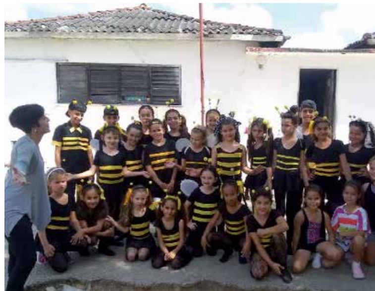
Del evento surgieron proyectos como La Colmenita de Jarahueca.