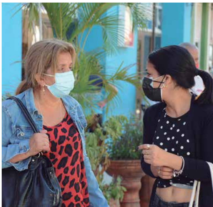
La responsabilidad individual y colectiva es clave ante este aumento de casos positivos.