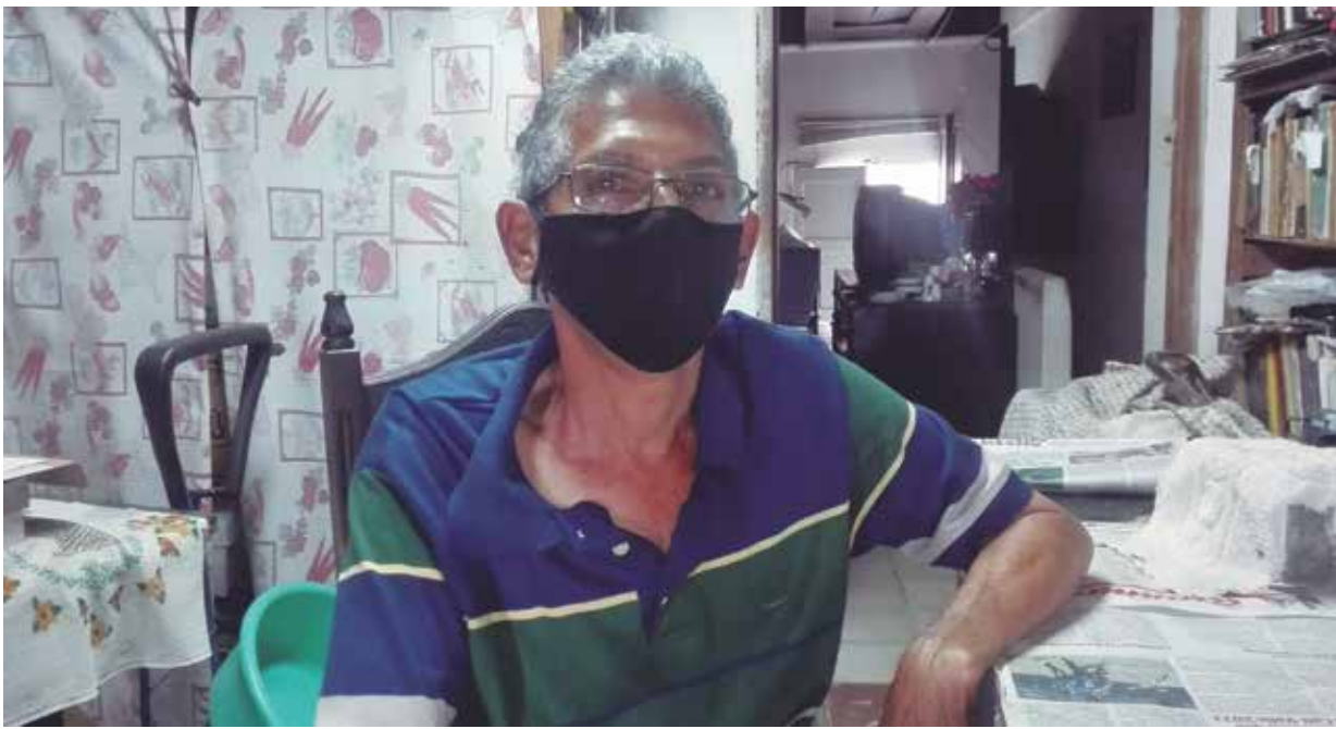
Este auténtico espirituano agradece a todas las personas que han estimulado su carrera profesional.