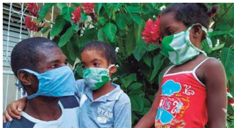
La consulta popular del documento acontecerá de febrero a abril.

Esta nueva versión de la norma jurídica está acorde con lo que recoge la Carta Magna en torno a la familia, en correspondencia con el carácter humanista de la Revolución. (C. R. P.)