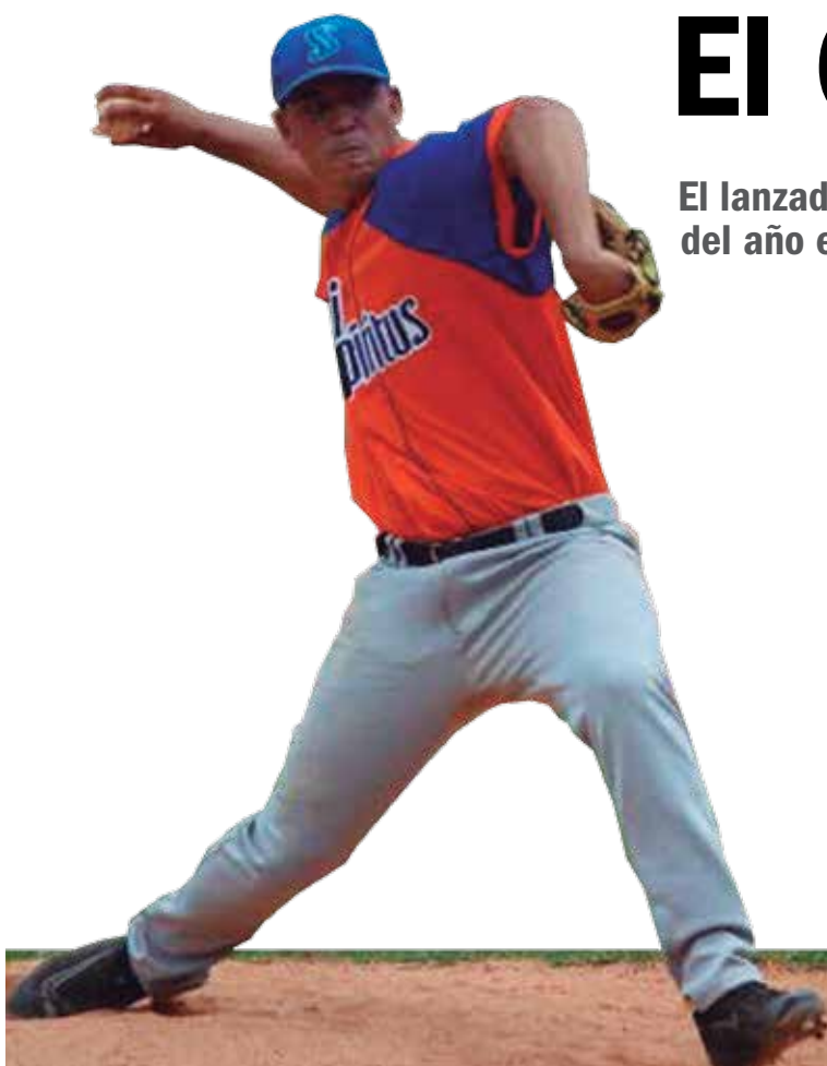
Santos fungirá como segundo abridor de los Gallos en la serie.