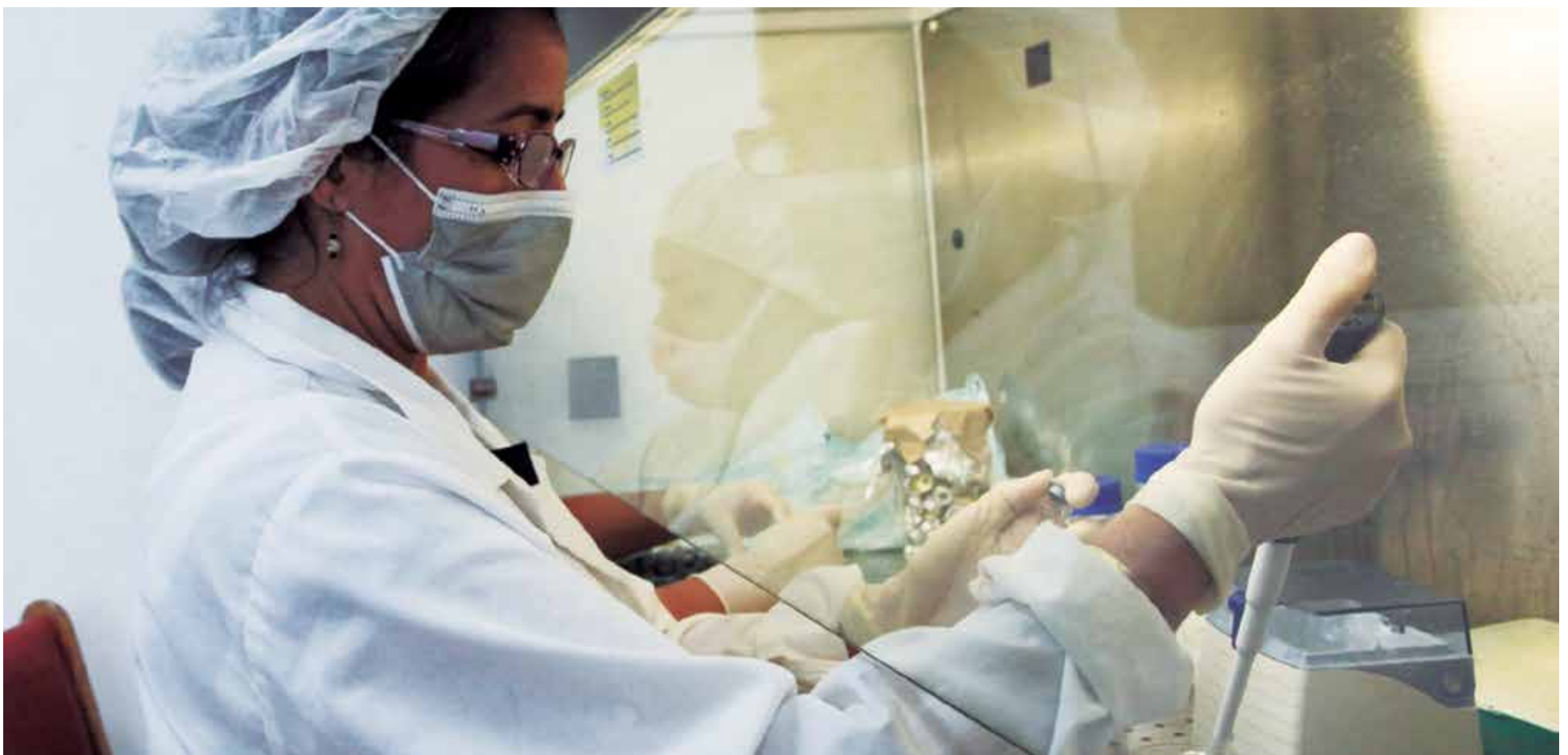
El CIGB espirituano ha realizado una decisiva contribución en la lucha contra la covid.