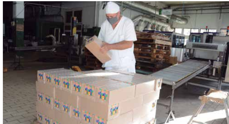
La planta produce toda la compota que se distribuye en la canasta normada del país.

Los ensayos se hacen a escala de laboratorio primero, en el de análisis físico-químico, pero también contamos con uno de evaluación sensorial con catadores evaluados, tenemos un panel de catadores que se encarga de evaluar todas las formulaciones y variantes para después decidir cuál es la mejor.