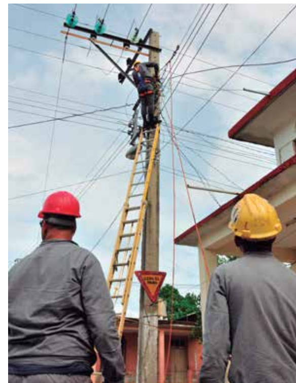
La disminución de los periodos de interrupción figura entre los resultados de los eléctricos espiritanos.

Los eléctricos trabajaron fuerte, además, en la materialización de más de 7 700 necesidades de los clientes, entre las que se incluyen las nuevas viviendas y solicitud de cambio de voltaje, a lo cual se une el aporte en la reanimación de algunas comunidades donde se mejoró el alumbrado público con la instalación de 250 nuevas luminarias en calles principales y puntos vulnerables en los barrios.