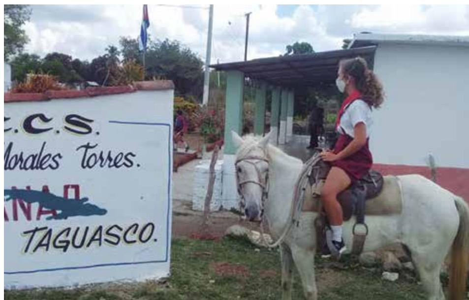
Los jinetes con pañoletas son parte del paisaje diario de la escuela del Consejo Popular de Santa Rosa.

que me reciben, el cansancio se me quita.