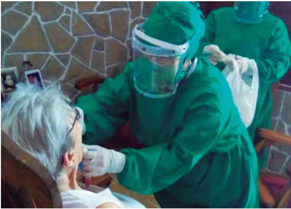
La provincia es uno de los territorios que más casos reportan diariamente.