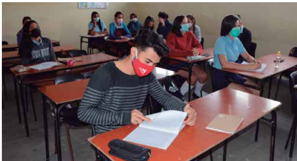
Sancti Spiritus alcanzó el 84.6 por ciento de aprobados en las tres pruebas.