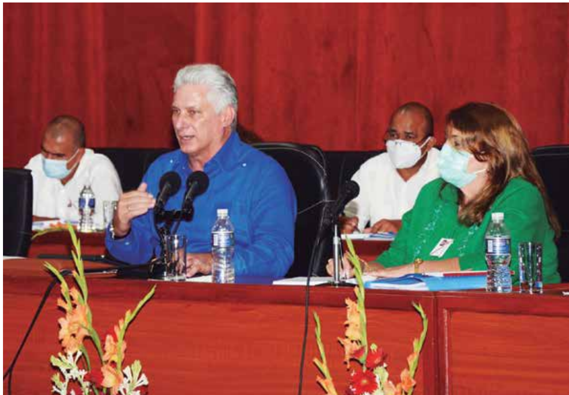
Miguel Díaz-Canel insistió en la importancia del trabajo político-ideológico para mantener las esencias de la Revolución.

A nadie se le puede ocurrir materializar este propósito como cuando triunfó la Revolución o como hace 40 años atrás, sino