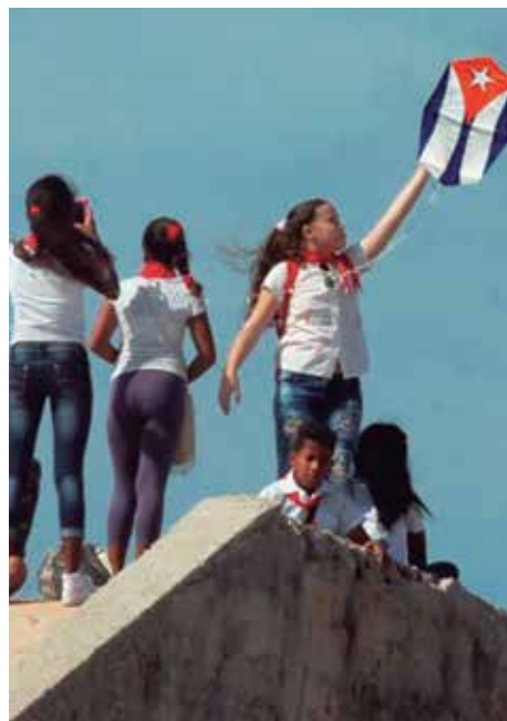
Diversas propuestas animarán la fiesta de la nueva generación.

De cara al evento se ultiman detalles organizativos y logísticos a fin de asegurar las conferencias, las sesiones prácticas y también las actividades colaterales que prevén recorridos de los participantes por sitios emblemáticos de la ciudad y el Valle de los Ingenios.