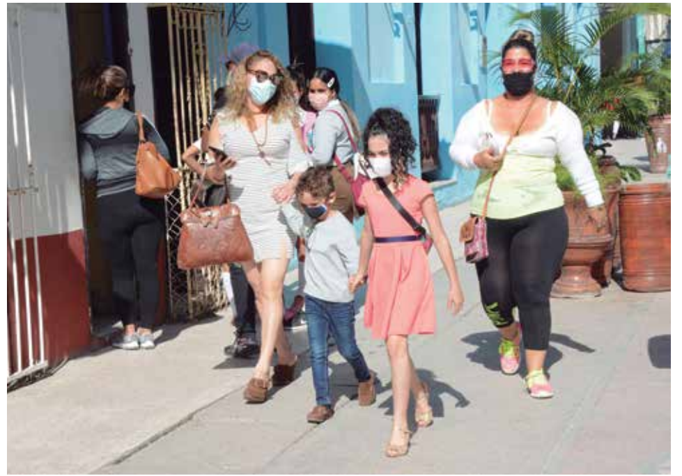
A pesar del avance de la la vacunación, no debe disminuir la percepción de riesgo.